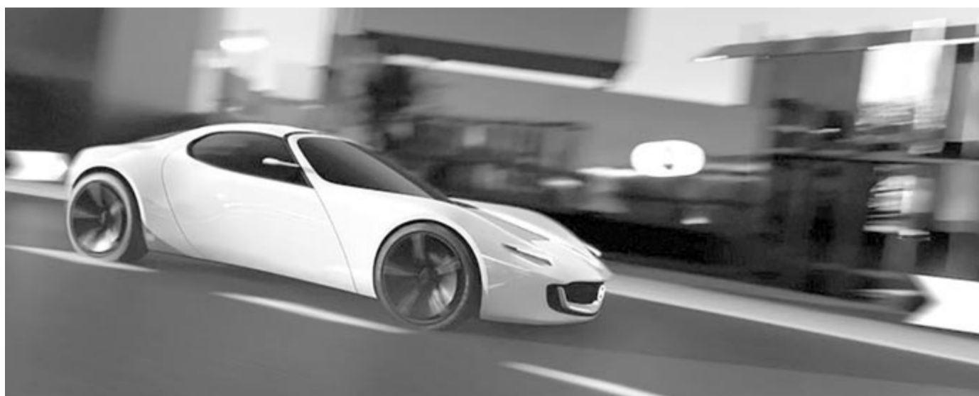
Mazda MX-5 koncepció

Ha a jelenlegi helyzetet nézzük, akkor nagyon úgy fest, hogy a jelenlegi, negyedik generáció, az ND még egy darabig a kínálatban fog maradni, viszont elképzelhető, hogy készül belőle hibrid változat is. Ez pedig már egy jó próba lesz arra vonatkozóan, hogy mennyire sikerül megtartani a típus jellegzetességeit.