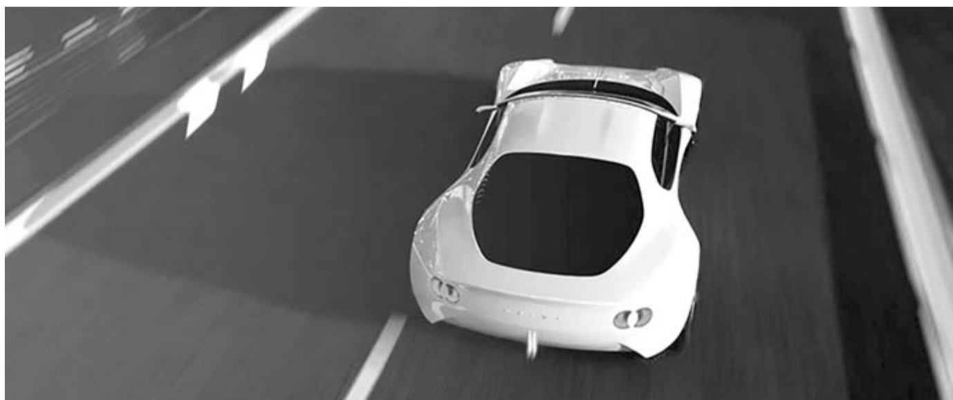
Mazda MX-5 koncepció hátulról