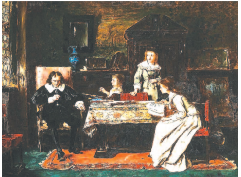
Munkácsy Mihály: Milton – A vak költő lányainak tollba mondja versét