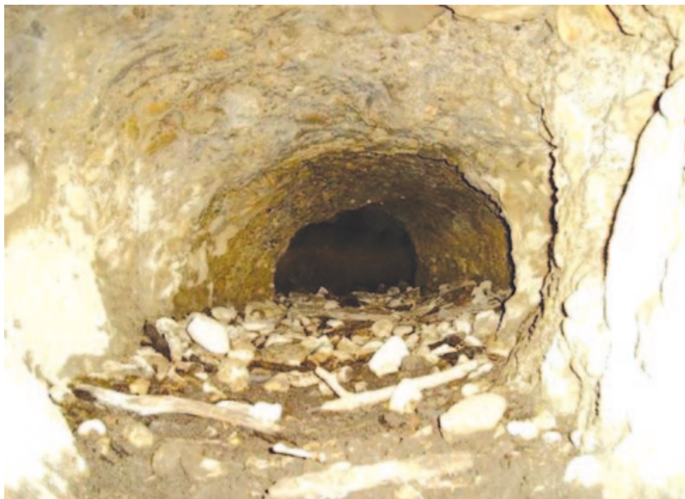
Alagút a görgényi várban

A várban 1572–1573-ban Báthori István építkezett, erről részletesebb adataink nincsenek.