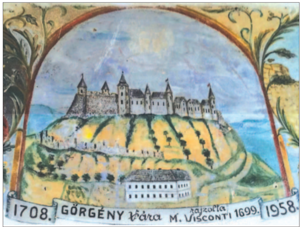
Freskórészlet Visconti képe alapján