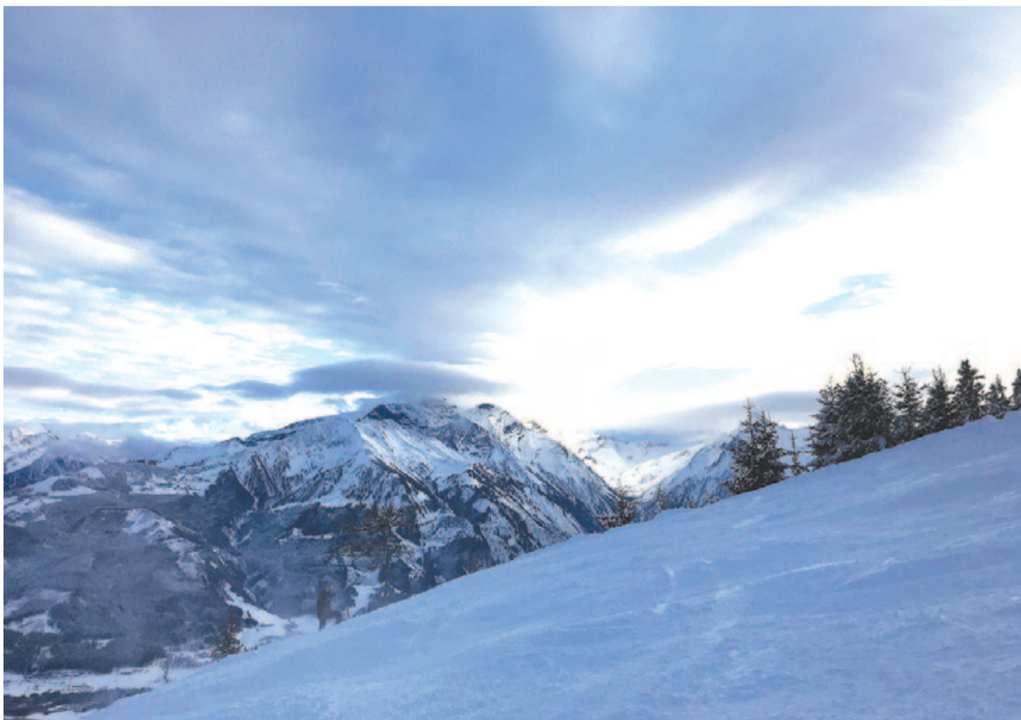
Meddő szirtek vén feje fáradt felleg menhelye

Maradok kiváló tisztelettel. Kelt 2022-ben, 414 évvel az Elveszett paradicsom szerzőjének születése után