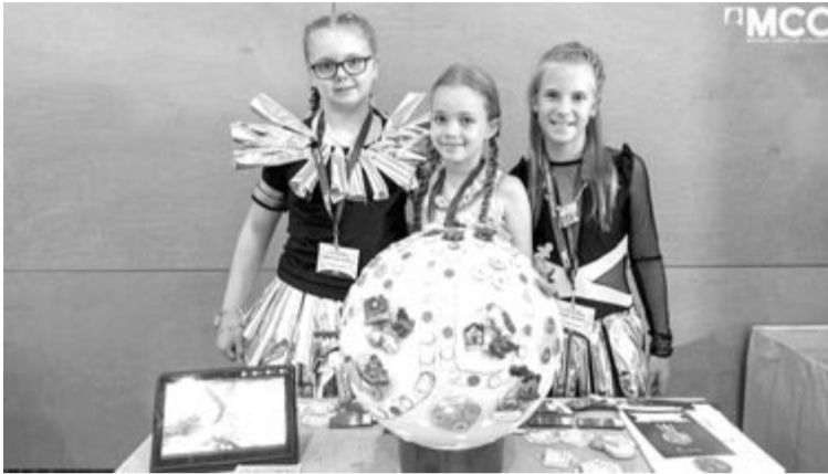
Az előző évi FIT Kaland tehetségversenyen