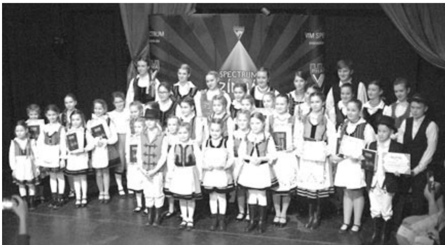
43 diák vett részt a megyei döntőn

A szervezők köszönik mindenkinek a részvételt, gratulálnak a díjazottaknak. A programra Csoóri Sándor Alap támogatásával valósult meg. (grl)