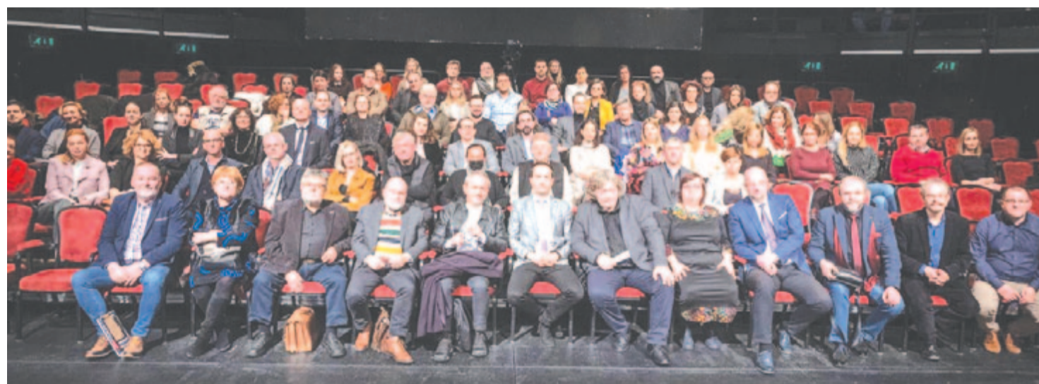
A 10. Színházi Olimpia beharangozó sajtótájékoztatójának résztvevői a Nemzeti Színház Gobbi Hilda Színpadán

Az alternatív szcénát többek között a Jurányi Ház és a Bethlen Téri Színház képviseli. Fesztivált rendez az idén 100 éves Budapesti Operettszínház is. A Győri Nemzeti Színház a Duna menti teátrumokat fogja össze. Az amatőröknek és a diákszínházaknak is lesz-