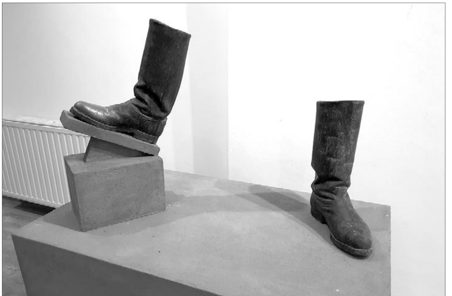
Hódolat... Veress Gábor-Hunor alkotása a marosvásárhelyi Bernády Házban