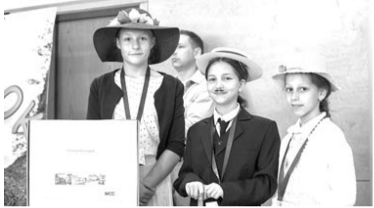
Az előző évi FIT Kaland tehetségverseny – díjazás