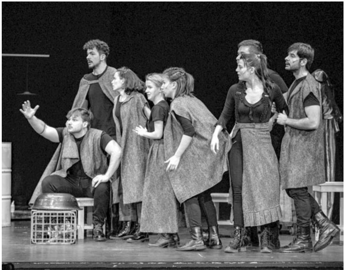
Próbakép az előadásról

Jegyek interneten vásárolhatók elővételben a Stúdió Színház honlapján feltüntetett online rendszerben, vagy az előadás helyszínén, kezdés előtt egy órával. Jegyek foglalhatók a 0736-350-686-os telefonszámon vagy a jegy@studioszinhaz.ro e-mail-címen. (Knb.)