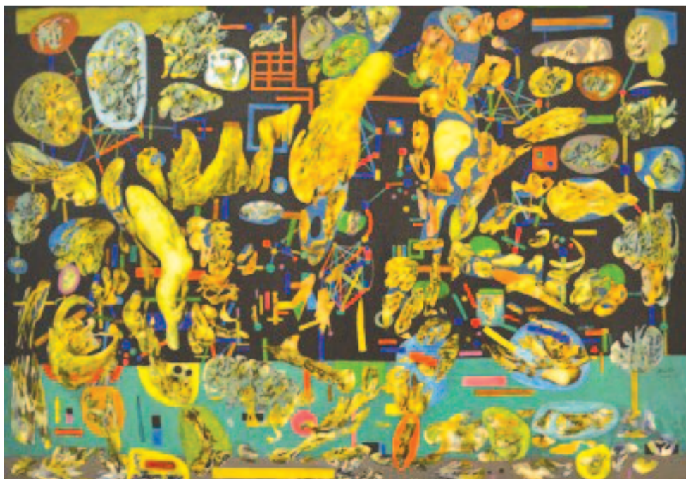
Hantai Simon: Megdermedt harmat, 1950-1951

A Szépművészeti centenáriumi Hantai Simon-kiállítása a múzeum Michelangelo-termében látható szerdától 2023. március 19-ig.