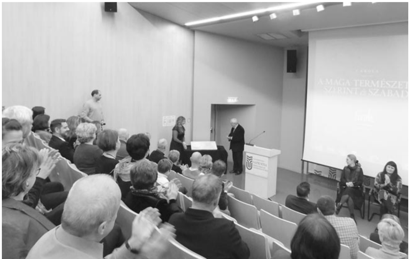
A márványtábla átadása