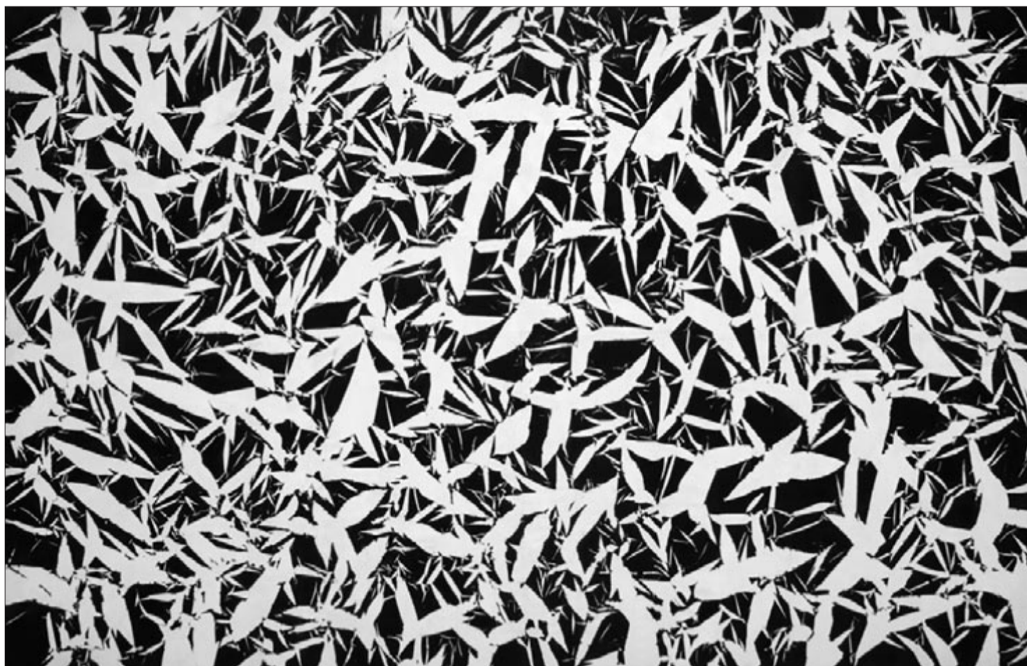
Hantai Simon: Etűd, 1969