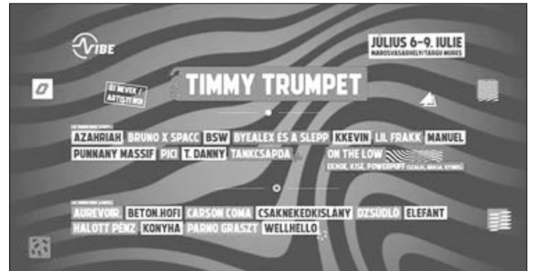
Új fellépők a Vibe Fesztiválon

A változatos stílusú fellépők mellett a Vibe készül egy karácsonyi dobozzal is, azok számára, akik offline december 24-ig, vagy online december 19-ig vásárolnak jegyet. Az offline értékesítési pontok, valamint a promoterek listája megtalálható a fesztivál honlapján. A Vibe karácsonyi dobozában a bérlet mellett egy zokni és különféle matricák (stickerek) található. Ez egy nagyon jó megoldás, ha valaki például ajándékba szeretné megvásárolni egy számára kedves személynek a bérletet, vélekedett a Vibe fesztiváligazgatója. A karácsonyi doboz nem jár anyagi többletfordítással, ugyanannyiba kerül, mint egy egyszerű jegy.