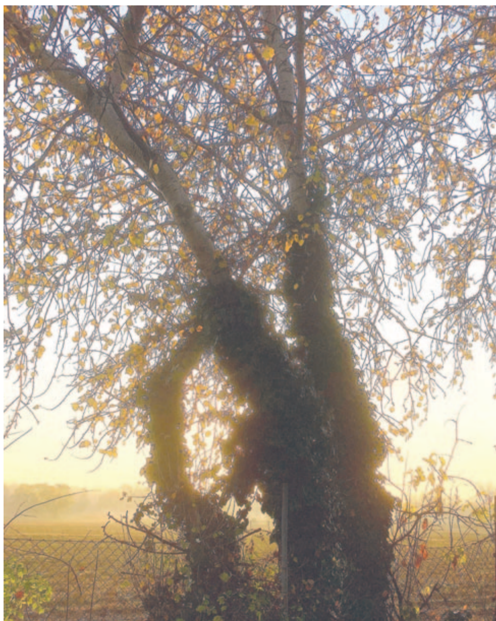
Őreg nyárfa napkeltébe belezissenő levelei

Őszi bánat, csendes, szelíd virág, Úgy körülölelted szívem. Kicsiny királyok. Minden virágod, mintha mosolyogna nekem.