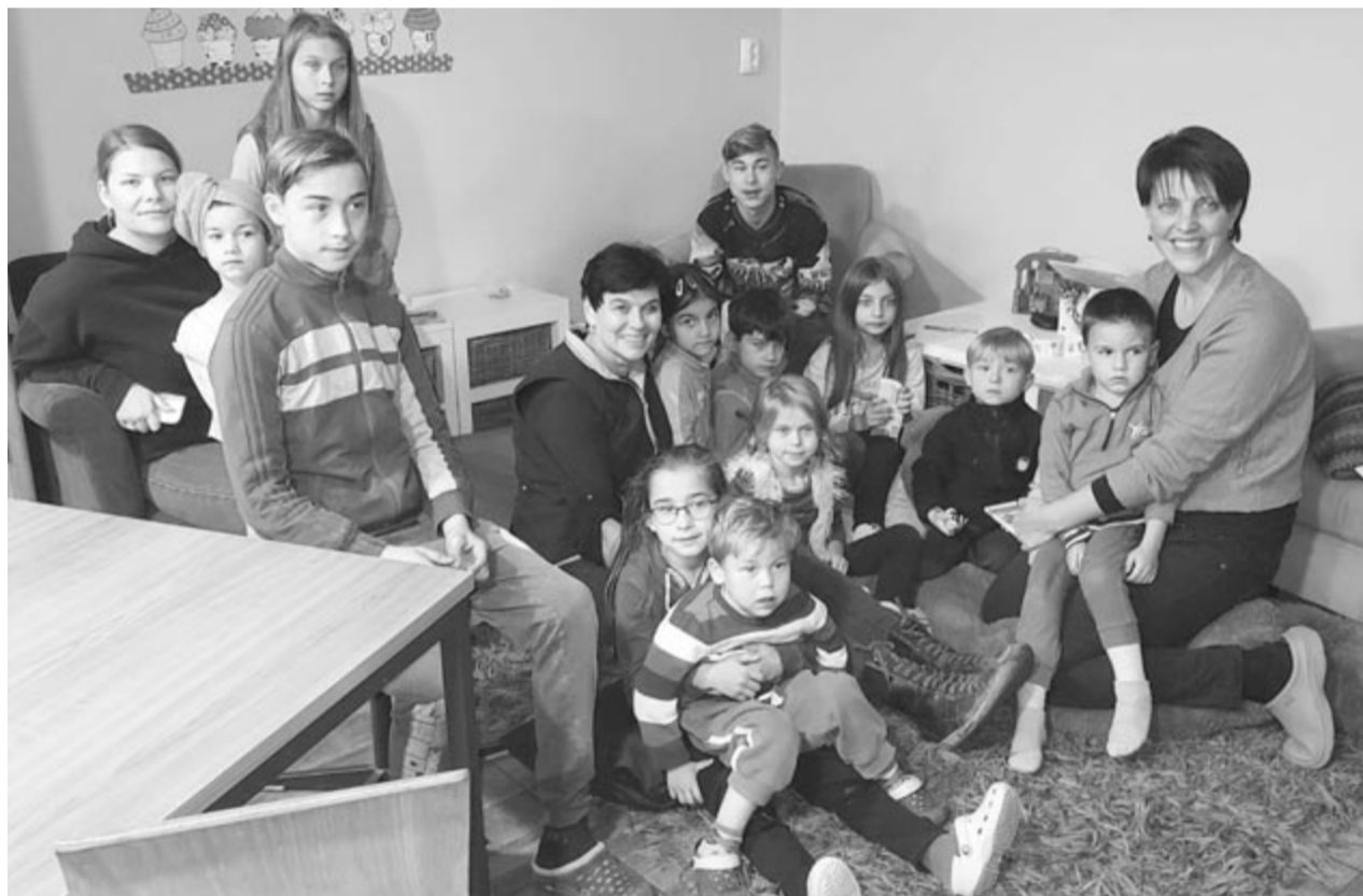
Tucatsni gyerek és két holland hölgy örült a hétfői abodi látogatásnak