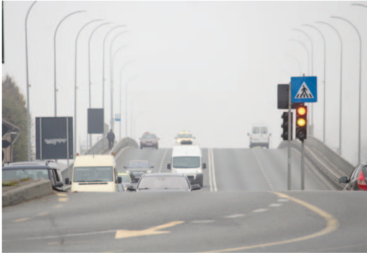
Tervben van egy új híd építése a Maroson