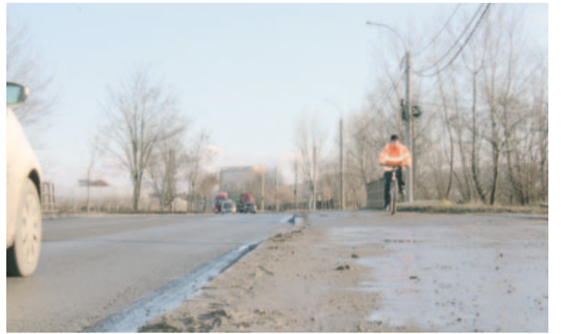
Kerékpárutak létesítéséről is szól a PUG

kozva, hogy követhetetlen azoknak a száma, akik igénybe veszik a tömegszállítási járműveket, az ingyenesség helyett 80 százalékos utazási kedvezményt javasolt mind az idősek, mind a diákok esetében, erre vonatkozó módosító indítványt tett. Radu Pescar hangsúlyozta, a jegyek, bérletek nyomtatása, eladása is költséges, ennek árát meg lehetne takarítani azzal, hogy ingyenes utazást tesznek lehetővé bizo-