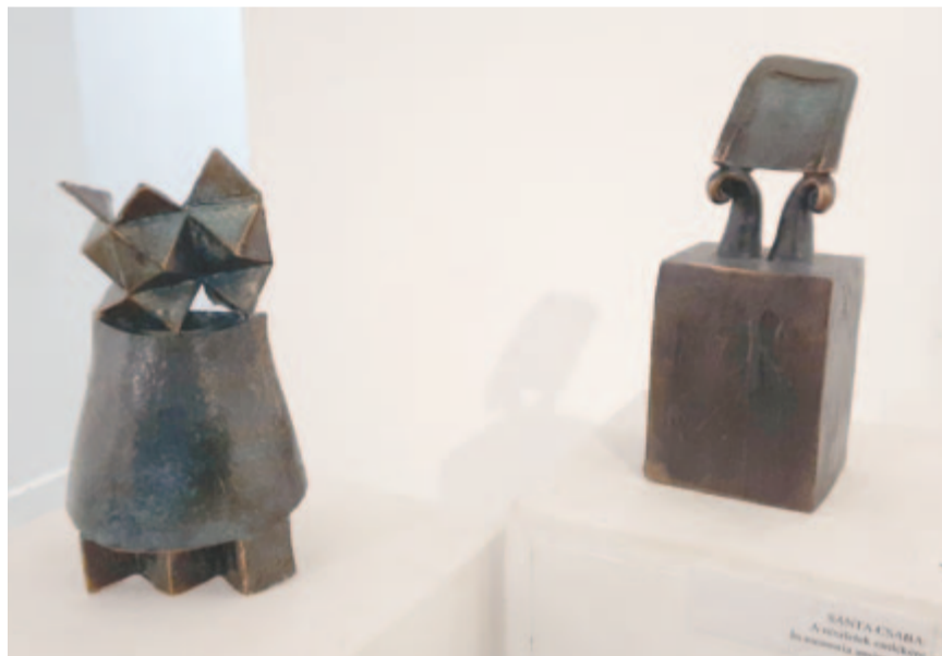
A részletek emlékére... Sánta Csaba bronz kisplasztikái