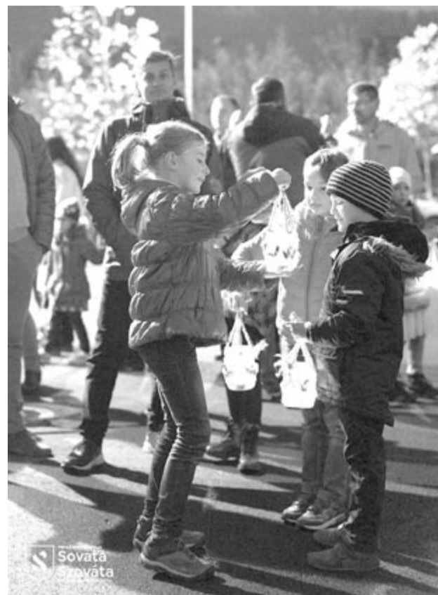
Szováta Szent Márton lámpását, a jó cselekedet fényét gyűjtik meg évente a gyerekek

Mert aki Márton-napon libát nem eszik, egész éven át éhezik – tartották elődeink. Így évek óta Szent Márton napja is megjelent egyes vendéglátóegységek étel-ital kínálatában. A marosugrai Haller kastélyszállóban vagy a Ko-