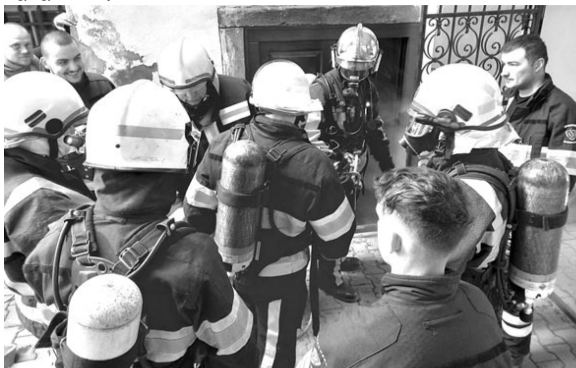
A légzőkészülékek használata és a gázpalackok kezelése fontos tudnivaló

A hétfői gyakorlaton lehetőséget adtak az ifjúsági tűzoltóknak is, hogy egy ötfős csapattal részt ve-