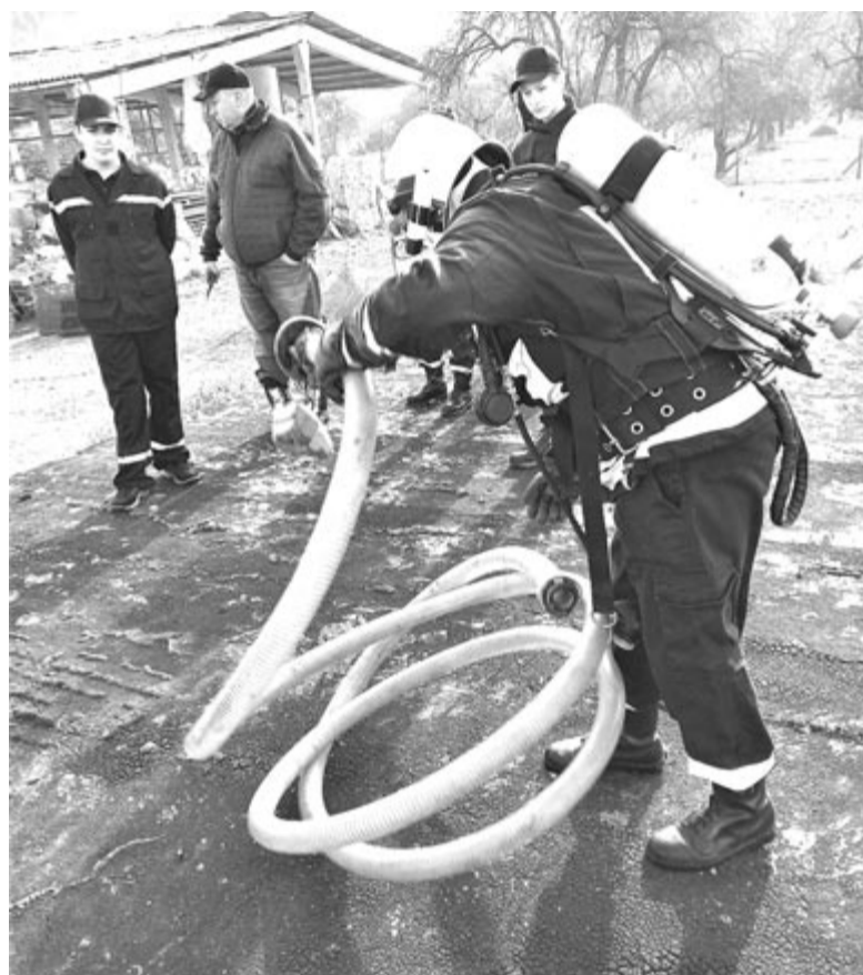
A téli tüzesetek kezelése is célja a gyakorlatoknak

ken általában együtt kell részt venniük, ezért meg kell tanulniuk együttműködni, és ilyenkor az esetkocsik esetleges eszközhiányosságaira is fény derül. A két szereďai alakulat a múlt héten közösen végezte el a városban az éves ellenőrzést, amikor közintézményeket és magánvállalkozókat kerestek fel, hogy felderítsék a tűzvédelmi hiá-