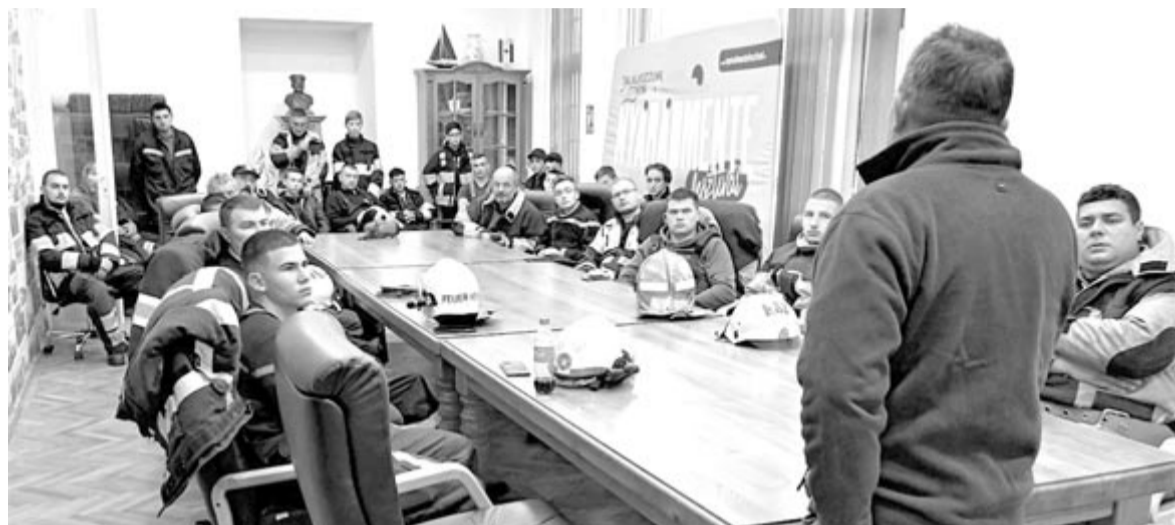
Elméleti oktatás és számos helyzetgyakorlás szerepel ilyenkor a programban