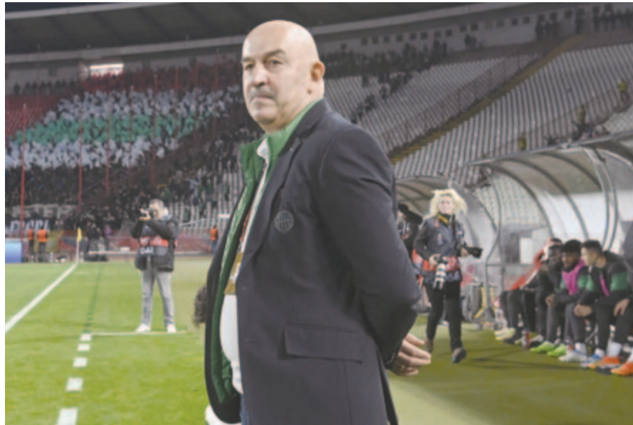
A Ferencváros vezetőedzője, Sztanyiszlav Csercseszov az Európa-liga csoportkörének harmadik fordulójában játszott Crvena zvezda – Ferencváros mérkőzésén

„Nagyon elégedett vagyok a játékkal és az eredménnyel is. Az első perctől erőteljesen futballoztunk, ami meghozta a várt sikert. Remélhetőleg ez a győzelem lendületet ad a csapatnak a folytatásra – értékelt Milos Milojevic, a Crvena zvezda trénera. – A mostani győzelem után van remény továbbjutni ebből a csoportból, de a földön kell maradnunk. Egy hét múlva az lesz a fontos, hogy újabb sikerrel a saját kezünkben tartsuk a sorsunkat.”