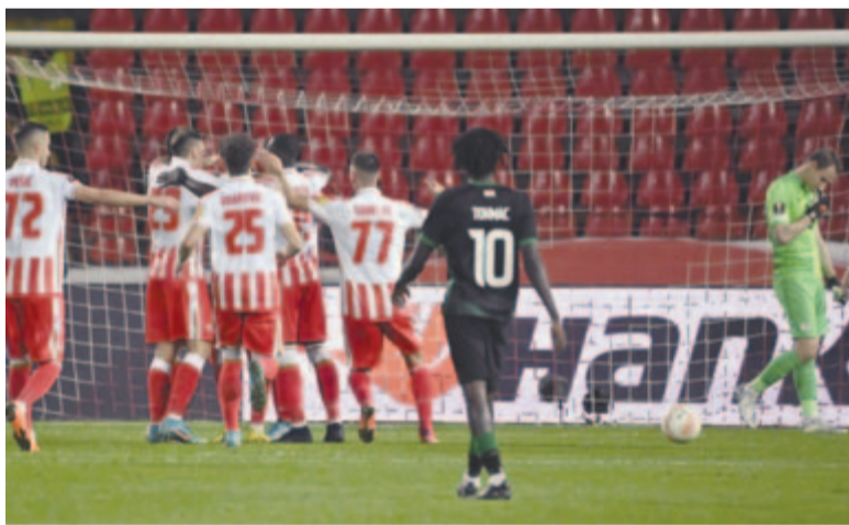
A szerb csapat gólröme az Európa-liga csoportkörének harmadik fordulójában játszott Crvena zvezda – Ferencváros mérkőzésén a belgrádi Rajko Mitic Stadionban 2022. október 6-án

A folytatásra nagyobb sebességi fokozatba kapcsolott az FTC, de lendületét hamar megtörte, hogy az első kontrából Katai betalált, így tulajdonképpen el is döntötte a három pont sorsát: az 50. percben Katai közepén vezette a labdát, majd 16 méterről a jobb alsó sarokba lőtt (3-0). A zöld-fehérek a kettős csere sem segített, mert támadásaik erőlenek maradtak, a biztos előnye birtokában visszaállt Crvena zvezda továbbra is magabiztosan játszott, egyórai játék után pedig tovább növelte előnyét az eredményjelzőn: Kanga a 16-os bal sarkának magas-