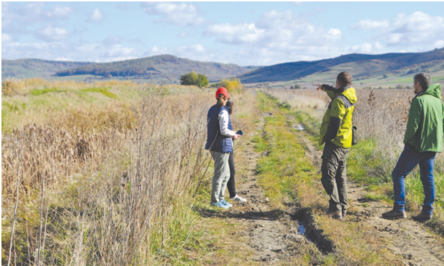
Backamadarasi terepszemlén a szakértők