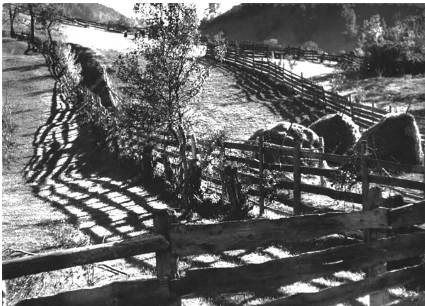
Marx József: Nyugati-Kárpátok – díjazott fotó, 1974

105 évvel ezelőtt született és 15 éve hunyt el (1917. október 5. – 2007. november 19.) a József Attila- és Kossuth-díjas író, költő, műfordító, a Digitális Irodalmi Akadémia alapító tagja.