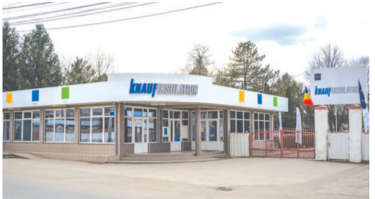
A dicsőszentmártoni termelőegység bejárata

tizenhat országban. A Knauf Csoportnak világszerte hozzávetőleg negyvenezer alkalmazottja és háromszáz gyára van több mint kilencven országban. 2021-ben a cégcsoport üzleti forgalma meghaladta a 12,5 milliárd eurót. A Knauf Grup független családi vállalkozásként 1932-ben alakult meg, és értékrendjében elsődleges a partnerség, az elkötelezettség, a vállalkozói szellem és az emberség. A dicsőszentmártoni és a bánffyhunyadi termelőegységekben a legújabb gyártási technológiákat alkalmazzák majd, ugyanakkor a környezetvédelemre is nagy hangsúlyt fektetnek.