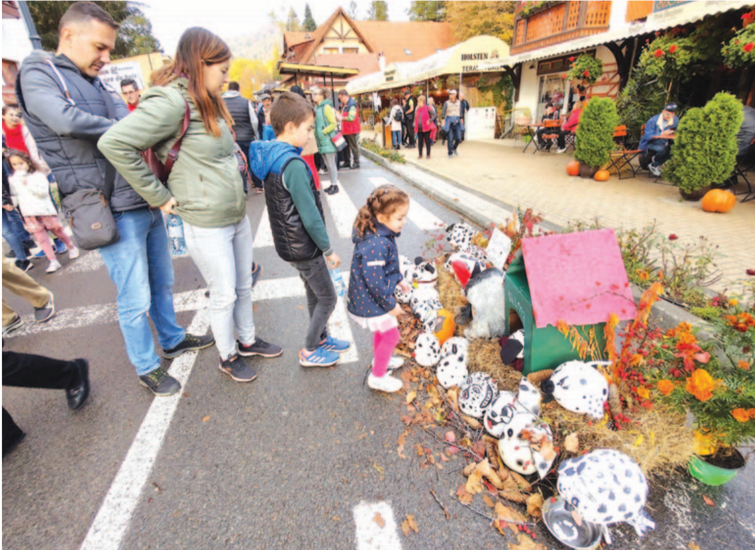
Sok-sok ötletes tökös és őszi díszletet tettek közzemlére a diákok