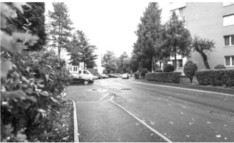
A Marosvásárhelyi Polgármesteri Hivatal kül- és belföldi kapcsolatok osztálya