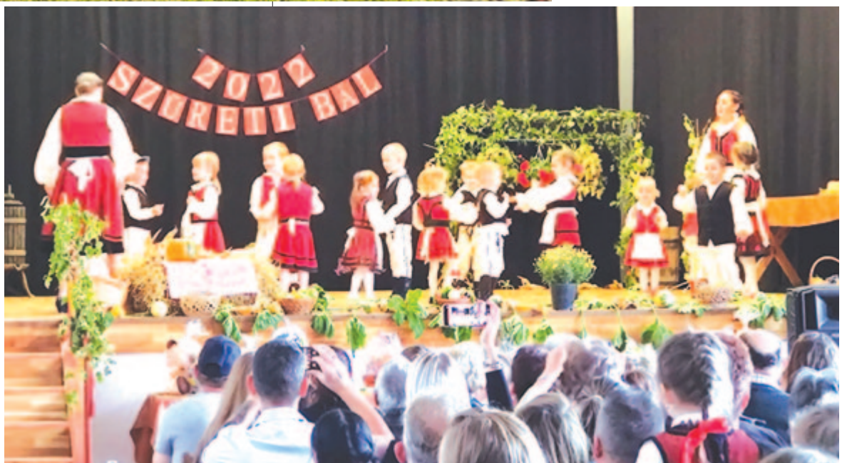
Zsúfolásig telt művelődési házban adták elő műsorukat a gyerekek