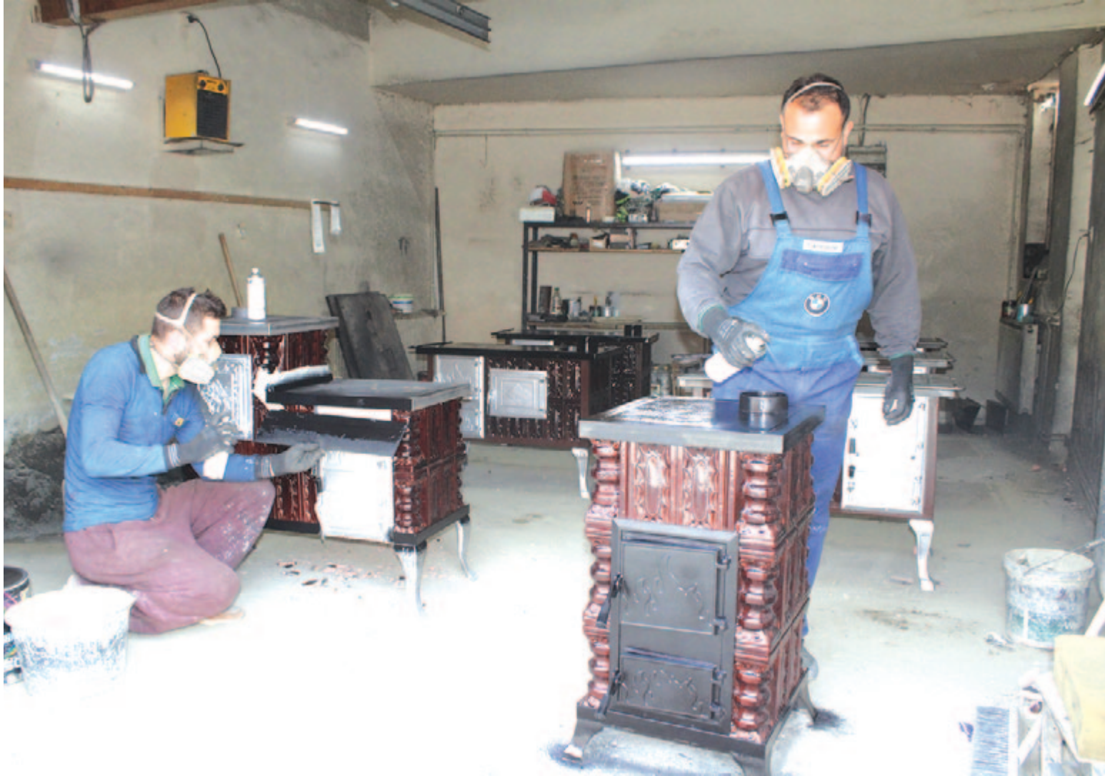
Backamadarasi újság a 6. oldalon