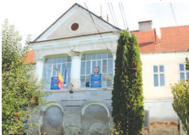
Felújítják a polgármesteri hivatal épületét

A cég ügyvezetője, ahogy a másik kályharakó céget működtető testvére is, édesapjától örökölte a mesterséget, aki a régi rendszerben ipart váltott, és addig rakta a csempekályhát, amíg fiai is megtanulták, majd a vállalkozást átadta nekik.