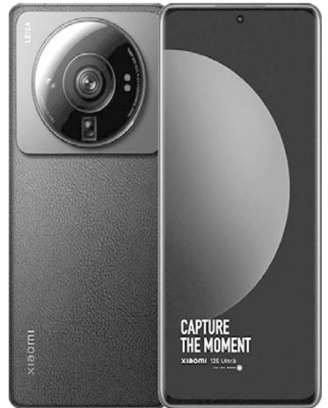
Xiaomi 12S Ultra

Az iPhone 13 Pro Max ezzel szemben három, egyenként 12 megapixeles kamerával bír, az optikai zoom pedig háromszoros átfogást tud biztosítani. Ezért lehetséges, hogy zoom szempontjából a Xiaomi új készüléke sokkal erősebb.