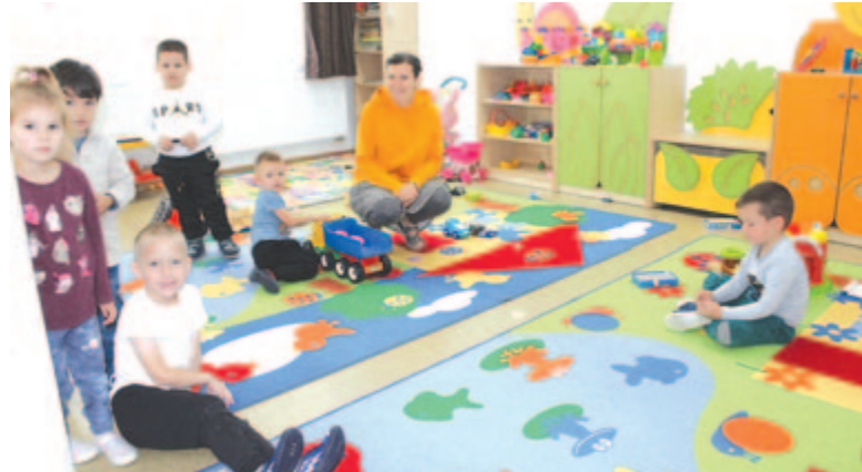
Népszerű a napközi otthon