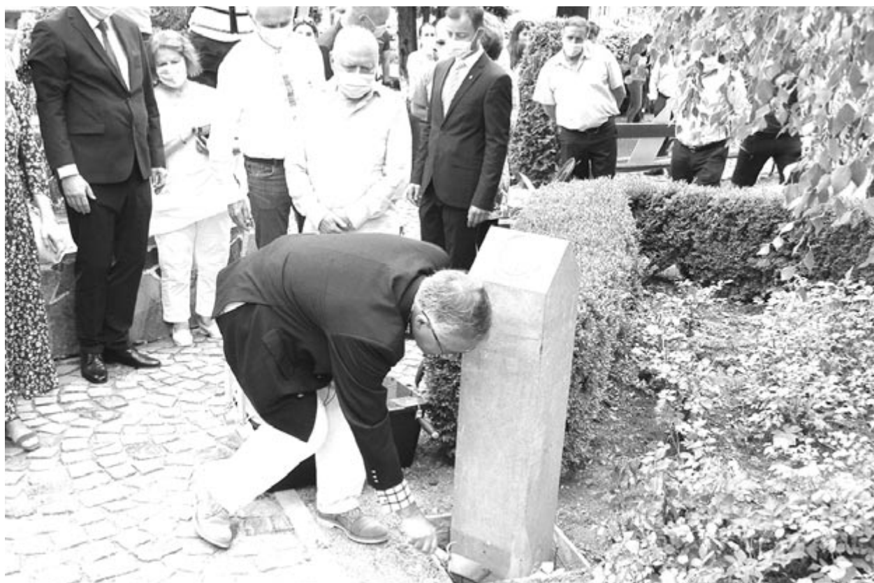
2020-ban Szovátán avatták fel a Via Transilvanica Maros megyei szakaszát

A kiépítés során több ezren bejárták a Via Transilvanicát, amely méltó helyre kerül nemcsak a hazai, hanem a nemzetközi tematikus turistaútvonalak között is. A teljes szakasz avatását követően várhatóan még többen járják majd be, megismerkedve az ország és különösen Erdély sokszínűségével, változatos földrajzi, geológiai és néprajzi sajátosságaival.