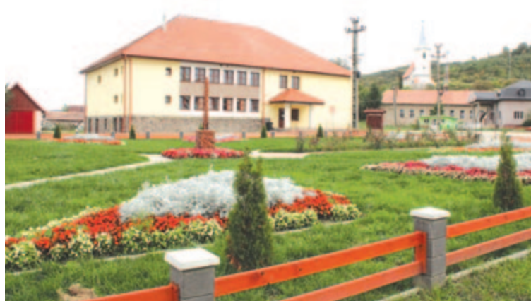
Szentgerice megszépült központja