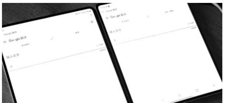
Samsung Galaxy Z Fold4 fólia nélkül és fóliával

Az érdekes videóiról híres Ice Universe azonban talált egy módszert a gyűrődés szinte teljes eltüntetésére. Ez pedig nem más, mint hogy eltávolította a védőfóliát. Ezt a technikát viszont a Samsung nem ajánlja. Olyannyira nem, hogy az idén még erősebb ragasztót használt, mint tavaly, mert néhány Fold3-tulaj arra panaszkodott, hogy a fólia magától leszakadt. Persze védőfólia nélkül is tökéletesen működik a telefon, ez a mostani kísérletből is kiderül, azonban kérdéses, hogy mennyivel csökken így az élettartama. Éppen ezért senkinek nem ajánljuk a trükk otthoni elvégzését, még annak ellenére sem, hogy valóban szinte teljesen eltűnik ezáltal a gyűrődés.