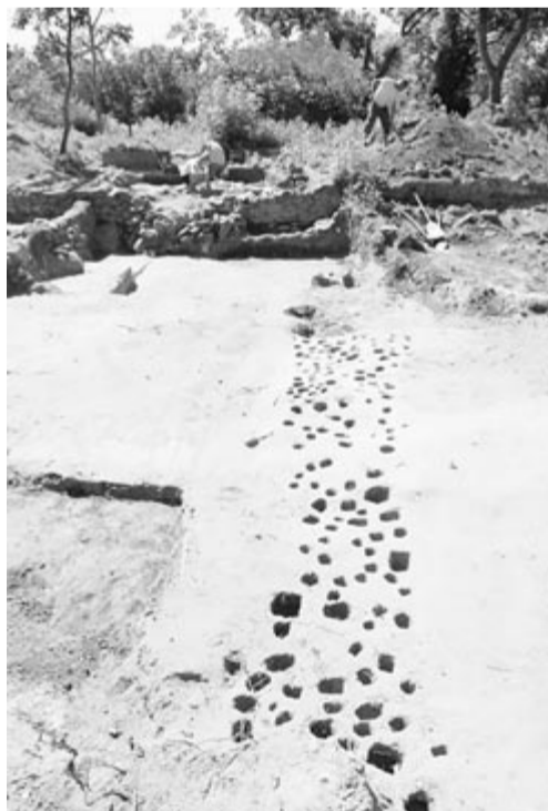
A kolostor cölöpös alapozású fala

A tűzhely kelet felé a monostor keleti falának alapárkáig nyúlt, és egy kis szakaszon bele is vágott abba. Déli szomszédságában egy hozzá hasonló, de kevésbé épen maradt tűzhely maradványai is előkerültek. Hogy a kolostornak pontosan mely építési fázisaihoz köthető a két tűzhely, azt az ásatás folytatásakor tisztázhatják majd a kutatók.