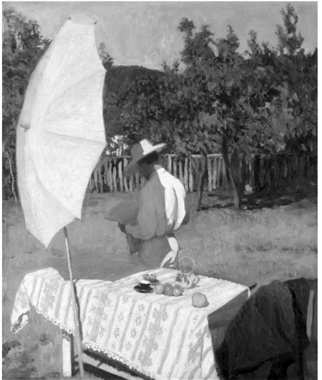
Ferenczy Károly: Október, 1903