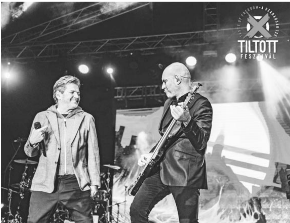
Thomas Anders a színpadon

Thomas Anders kendőzetlenül beszélt arról is, hogy már évek óta ugyanazokra a helyszínekre hívják vissza, nincs se több, se kevesebb meghívása. Természetesen a koronavírus-járvány alatt nem voltak fellépései, de ennek az első évben még örvendett is, hiszen otthon tudott lenni a családjával. Azonban a második év számára is már unalmas volt, hiszen elkezdtek hiányozni a fellépések és a közönséggel való találkozás. Meglátása szerint az idején, 2022-es év volt az, amikor a világ ilyen szempontból elkezdett visszatérni ahhoz az állapothoz, amit 2019-ben maga mögött hagyott, de még kell egy kis idő, ameddig teljesen visszatér a koronavírus előtti nyugodt időszak.