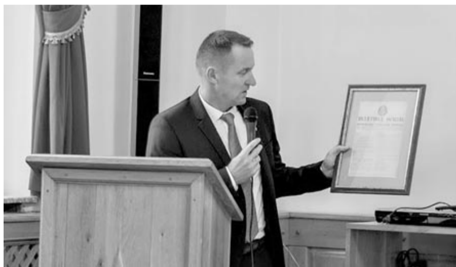
Hetven évvel ezelőtt jelent meg a Hivatalos Közlönyben a Szováta várossá nyilvánításáról szóló rendelet