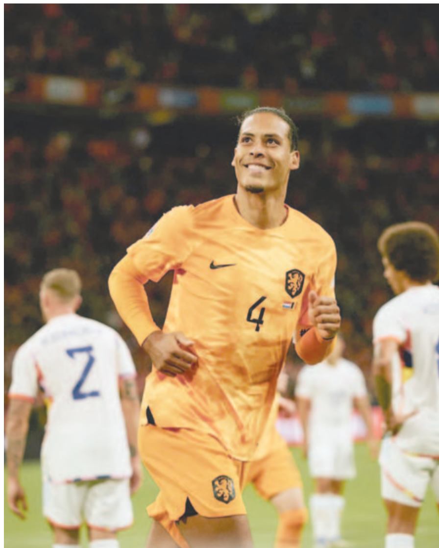
A középhátvéd Virgil van Dijk gólt szerzett, ezzel csapata megnyerte a belgák elleni meccset

1. csoport: Andorra – Lettország 1-1, Moldova – Liechtenstein 2-0. A végeredmény: 1. (és feljutott) Lettország 13 pont, 2. Moldova 13, 3. Andorra 8, 4. Liechtenstein 0.