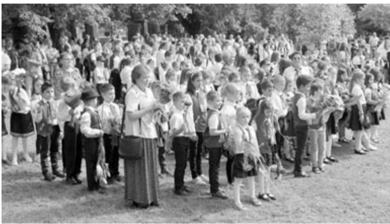
Tanévkezdés a katolikus iskolában

A marosvásárhelyi helyi tanács időben hozzáfogott az újbóli létrehozás folyamatának elindításához a Bolyai Farkas Elméleti Líceum szerkezetének a megváltoztatásával, ugyanis az alapítónak folyó év augusztus 31-ig kell jeleznie a szándék-