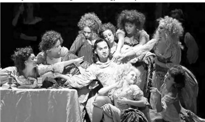
Pillanatkép a Don Giovanni című operából

Casanova keresztje lassan porladni kezdett, és egyszer csak letört. A kiálló facsonkba több asszony szoknyája is beleakadt. Innen származik az a legenda, hogy Casanova még halála után is el-elkapott egy-egy szoknyát.