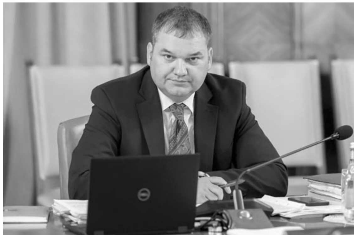
Cseke Attila fejlesztési miniszter

Az intézkedés, mutatott rá a közigazgatási miniszter, azoknak a kisebb önkormányzatoknak kedvez, amelyek nem rendelkeznek megfelelő kapacitással ahhoz, hogy például finanszírozást pályázzanak különböző beruházásokra. Országszerte több mint 1.500 településtervezési, közel 500 pénzügyi és közel 2.000 közbeszerzési szakértői állást nem tudnak betölteni az önkormányzatok. Ezért van szükség arra a jogalapra, amely megengedi, hogy egy közalkalmazott több önkormányzat munkáját is segítse – hangsúlyozta Cseke Attila.