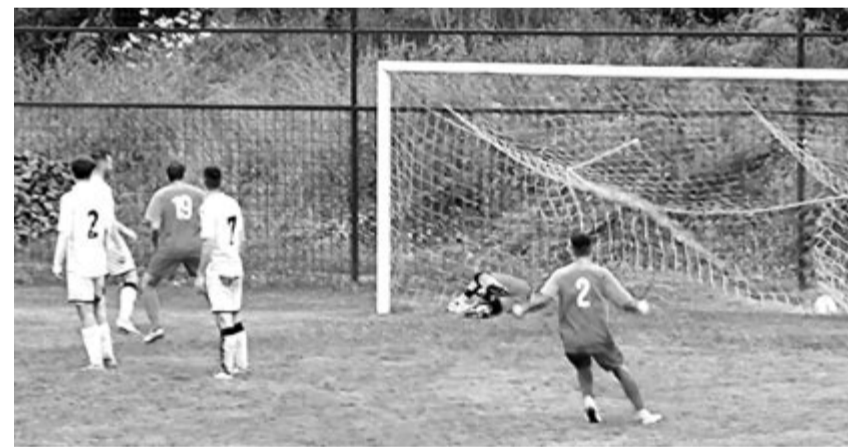
A fürdővárosiak első gólja szabadrúgásból született