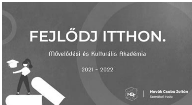
Fejlődj itthon – plakát