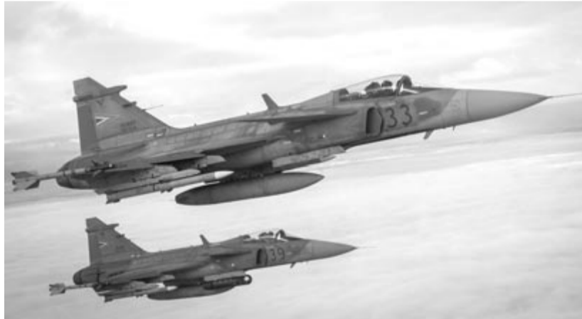
A Magyar Honvédség JAS 39 Gripen típusú vadászrepülőgépei gyakorló elfogást hajtanak végre Litvánia légtérében 2022. szeptember 21-én. A magyar kontingens harmadik alkalommal védi a balti országok légtérét.

A Magyar Légierő küldöttségét szállító Airbus A 319-es repülőgépet a litván légtérbe érve két JAS 39 Gripen vadászrepülőgép kísérte, illetve egy gyakorló riasztást is bemutattak a program keretében. (MTI)