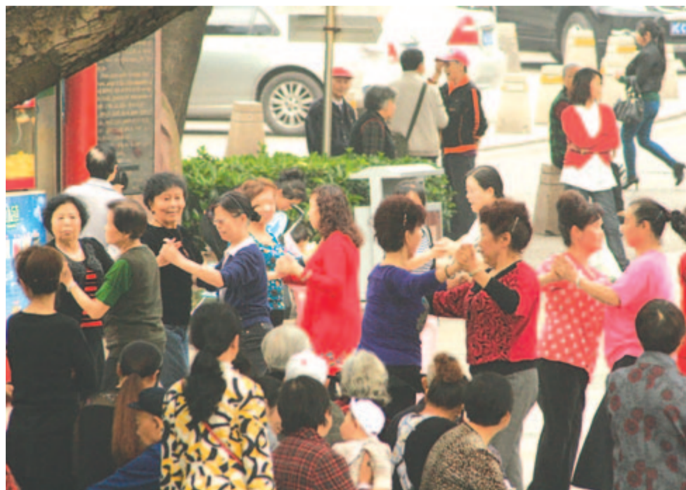
Az utca tánca