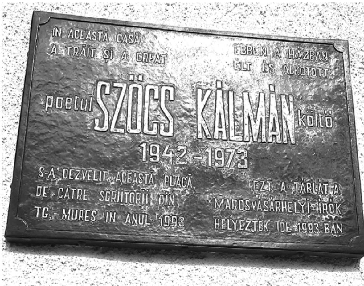
A felújított emléktábla a Horea utca 20. számú ház falán