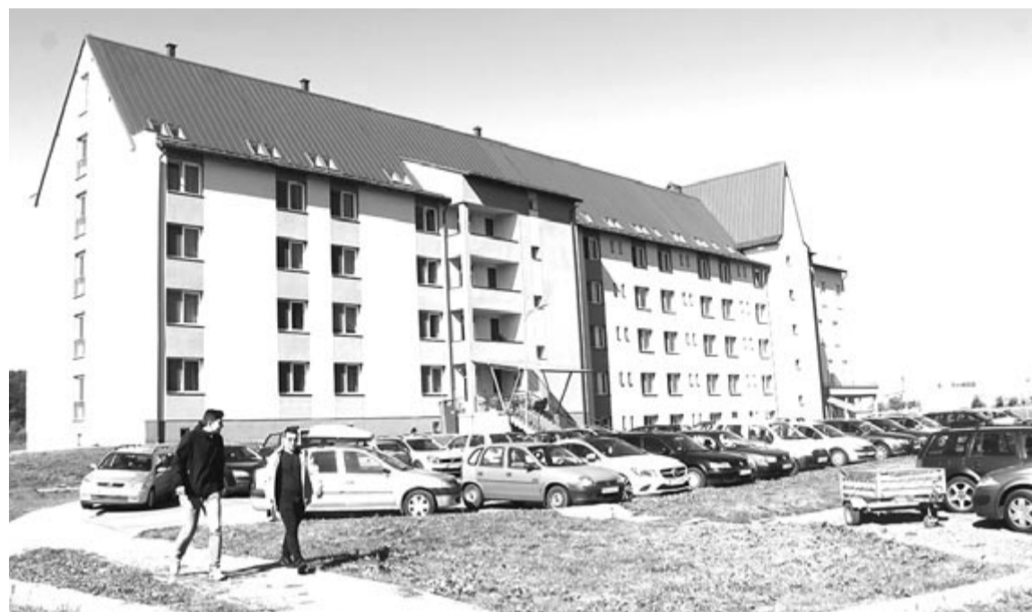
A Sapientia bentlakása

Hozzátette: több olyan történelmi, irodalmi és sportoló hősről van, akinek az életét és tevékenységét be kell mutatni a nézőknek. Magyarország a filmgyártás fontos bázisává vált, a magyar alkotók ugyanazokkal a stábokkal forgatnak együtt, mint a külföldi sztárok. (MTI)