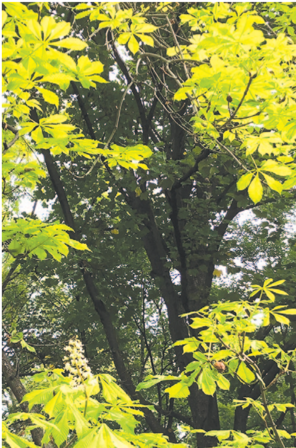
Másodvirágzó vadgesztenye gyertyái égnek

Kelt 2022-ben, 470 évvel Eger ostromának kezdete után.