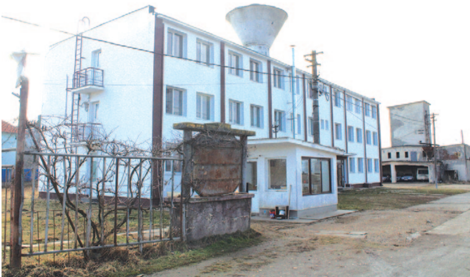
A jelenlegi marosludasi ápolóintézet