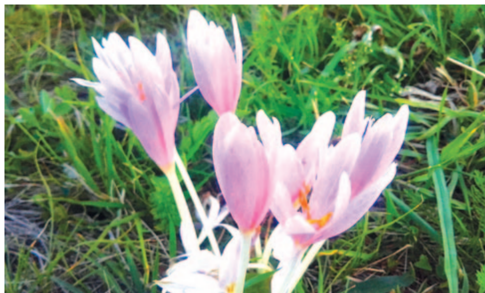
Őszi kikerics halványlilája

A kalendáriumi jóslások közül a legnagyobb pályát az időjárás futotta be. Már a kezdeteknél sem csak az asztronómiára támaszkodott, hanem a több évszázados megfigyelésekre, a felhalmozódott tapasztalatra is. „ Időjárás tapasztalás szerint ” – írták minden hétre a kalendáriumok a XIX., de még a