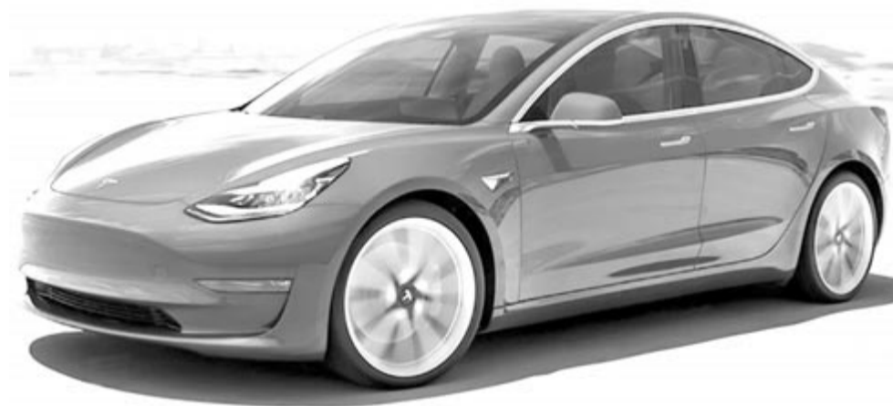
Tesla Model 3

A helyzet érdekessége, hogy hiába került most nehezebb helyzetbe a Tesla, a többi autógyártó még így sem tudja felvenni vele a versenyt. Idén a második negyedévben a Tesla több mint negyedmilió autót szállított le, ezeknek a túlnyomó többsége Model 3 és Model Y volt. Továbbá a Tesla célja, hogy az ez végére kétmillió darabszámra tudják növelni a termelést, amivel komolyan meghaladhatják az egyes belső égésű motoros autógyártók által kitűzött célszámokat is. Természetesen az már egy másik kérdés, hogy ez valóban sikerülhet-e Elon Musk vállalatának, vagy csak ismételtlen egy megvalósíthatatlan ígérettel álltak elő? Jövőben kiderül.