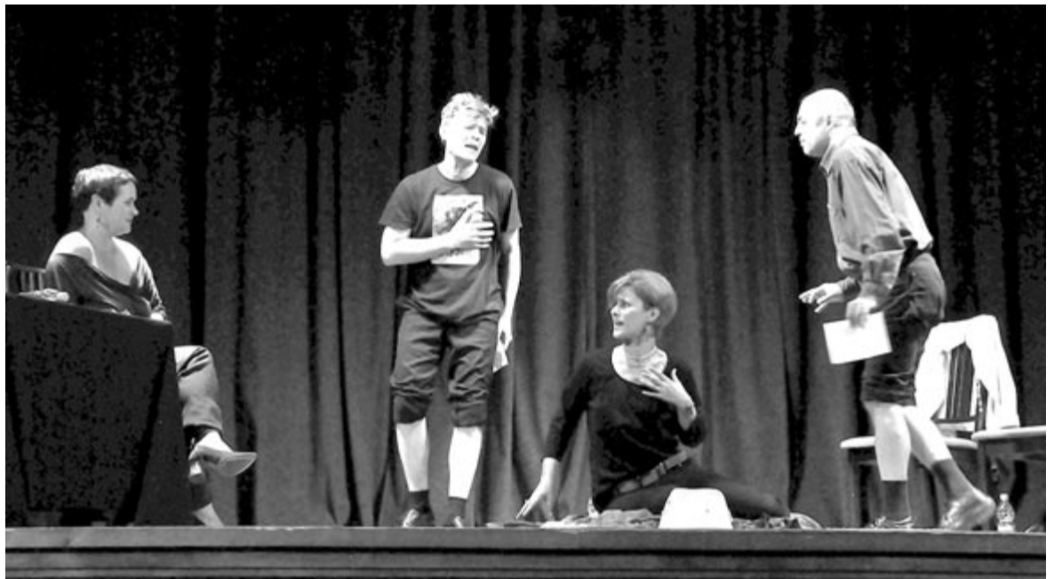
A temesvári Csíki Gergely Állami Magyar Színház színészeinek improvizációs játéka

fiatal is szerepet vállalt a szervezésében, ez pedig jele annak, hogy a rendezvénynek közösségteremtő ereje is van. Vincze Lóránt Európa parlamenti képviselő munkájára utalva elmondta, nem szereti használni a „kisebbségi” meg a „szörvány” kifejezést egy olyan közösségre, amely csupán a többségiekhez viszonyított számarányt jelzi, ugyanis egy erős közösség igazolhatja, hogy mindez csak matematika. Sajnos még ma is meg kell küzdenünk kisebbségi létünkért. Bánffyahunyadon az önkormányzat nem akarja elfogadni a magyar óvoda létrejöttét, Felfaluban is külön tanácsi határozat kellett a futballpálya használatáért a fesztivál idején, holott ez alanyi jogon járt volna az itteni magyar közösségnek. A Mente fesztivál bizonyítja, hogy szükség van az összefogásra, az összetartó közösségre, ékes példája annak, hogy együtt sikerül érvényesíteni kultúránkat, megőrizhetjük identitásunkat – fogalmazott a képviselő.