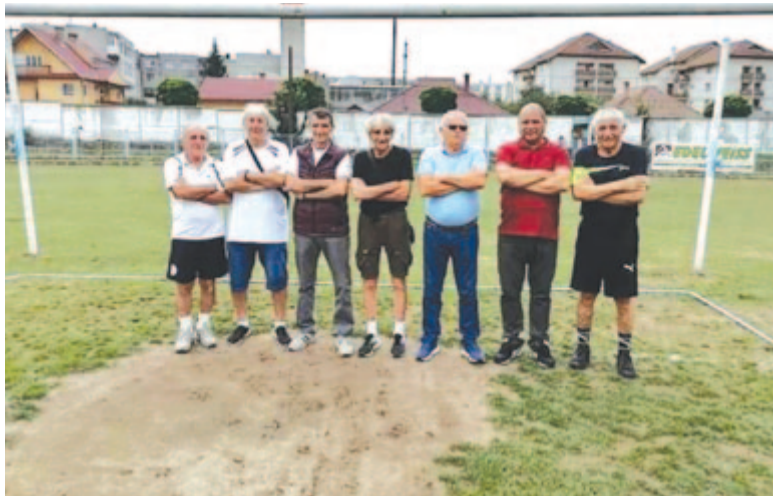
A Maros megyeiek egy csoportja az ideai gyergyói focitalálkozón

– A gyergyószentmiklósi önkormányzatnak és a labdarúgóklubnak ezúttal nem volt lehetősége, hogy anyagilag támogassa a rendezvényt, így mi, egykori játékosok és a sportszervezet egykori alkalmazottai közös erővel szerveztük meg a baráti találkozót. Délelőtt találkoztunk a klub stadionjában, ahol fényképeket készítettünk, miközben elkezdtük feleleveníteni emlékezetes mérkőzéseinket, aztán megnéz-