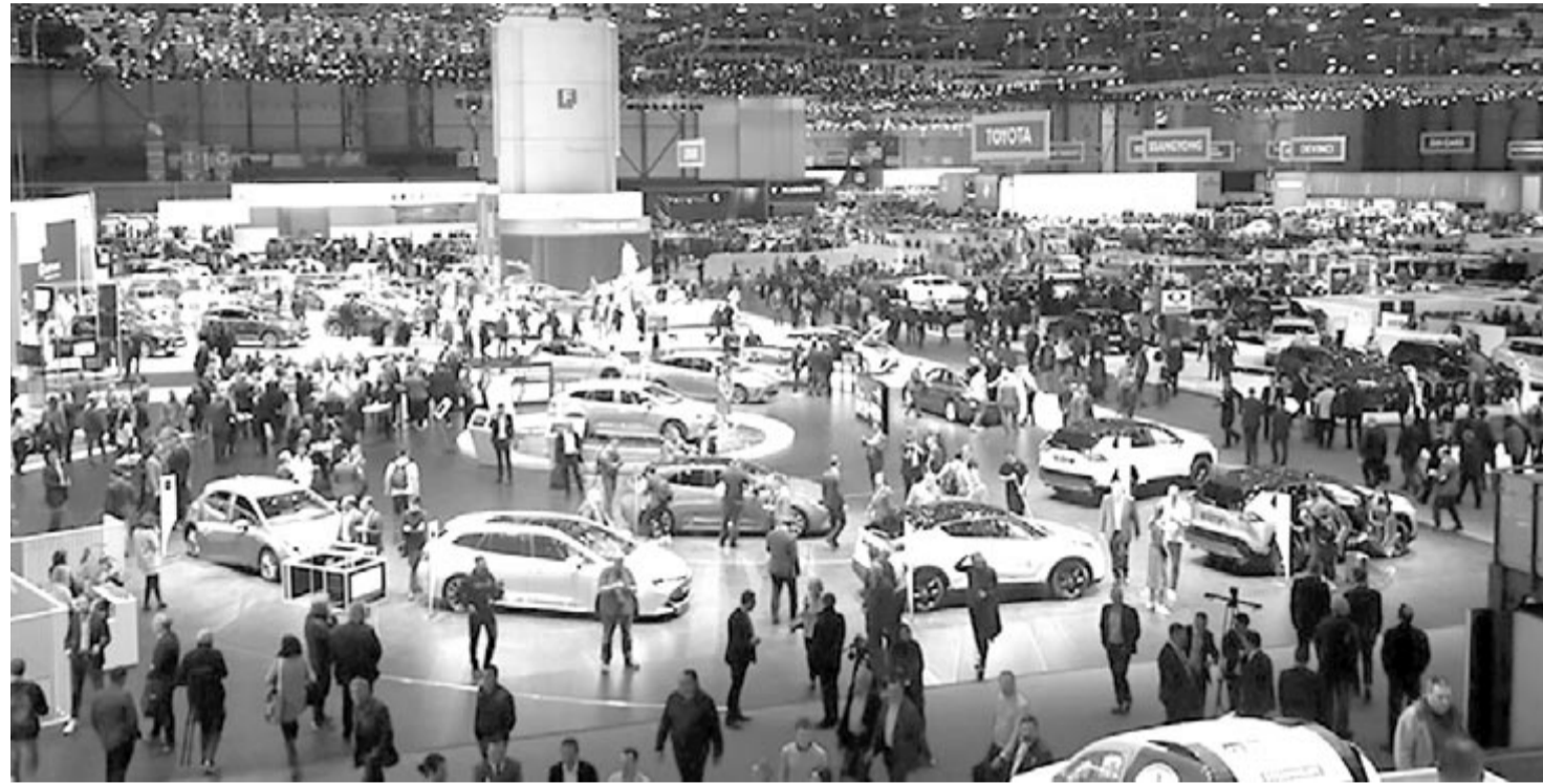
A Genfi Autószalon