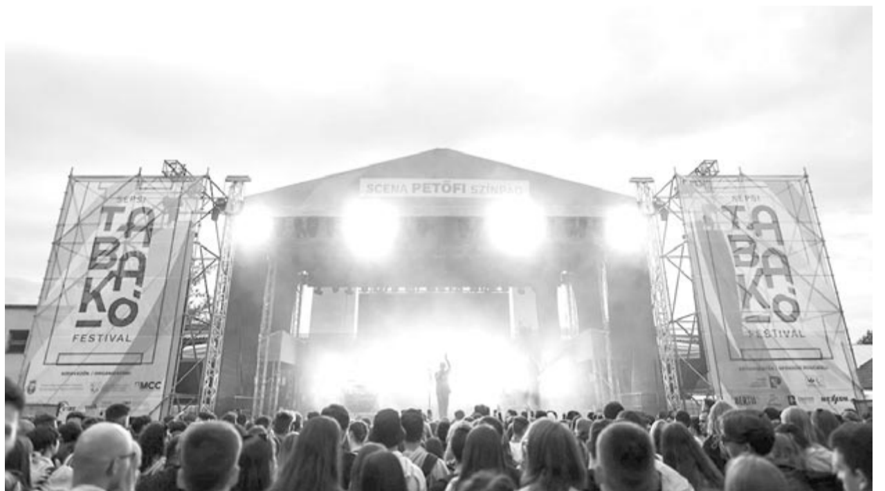
Koncert a Sepszi Tabakó fesztivál nagyszínpadán