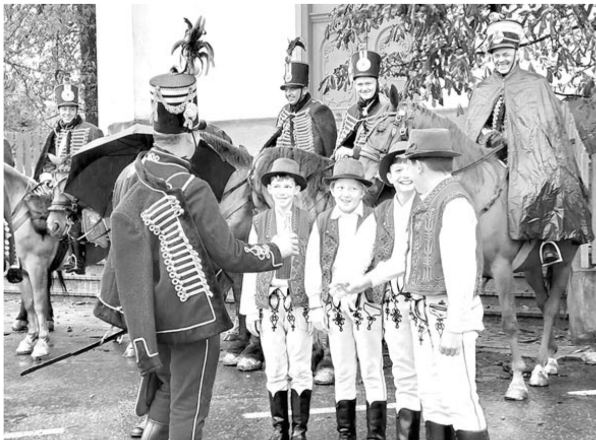
Felelevenített hagyomány: szombaton a legénykék itták a király borából, jelképesen beléphettek a honvédségbe