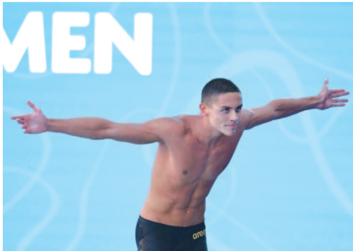
David Popovici újabb világlétséget ünnepelhetett