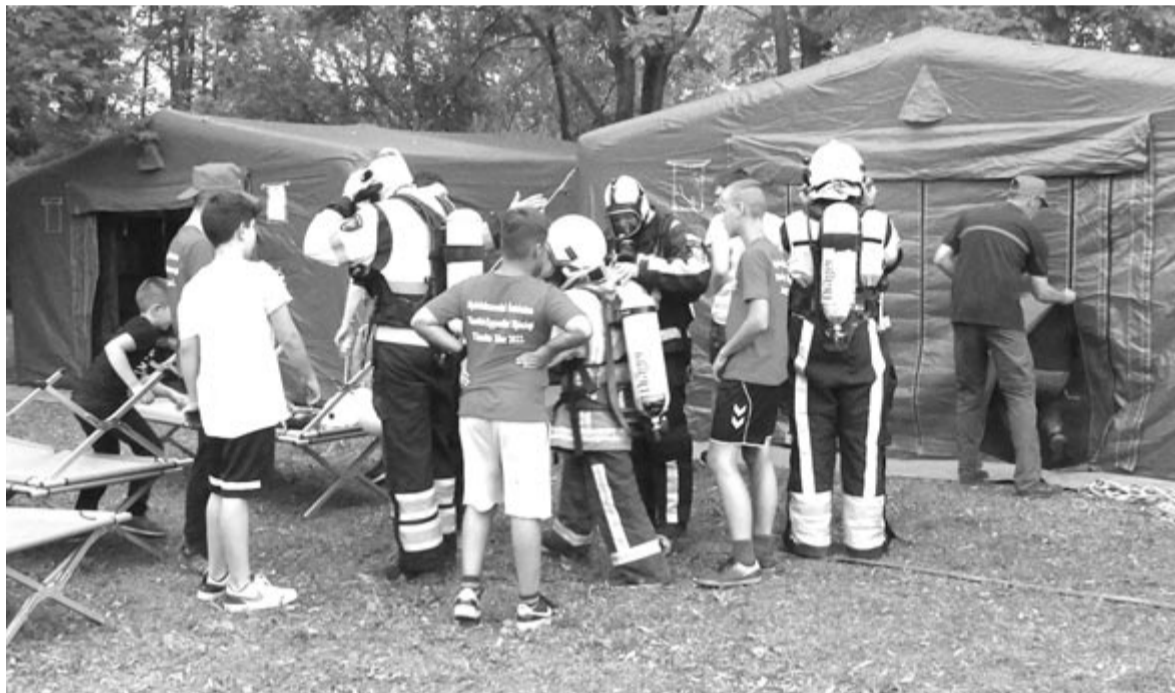
Játékosan és komolyan, de egész nap szakmai kérdésekkel foglalkoztak