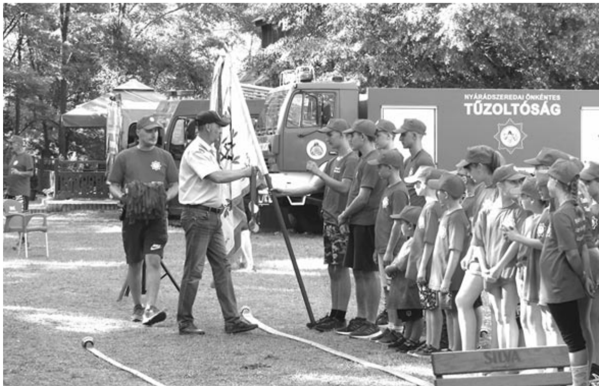
Szép emlékekkel, sok ismerettel és elismeréssel távoztak a résztvevők