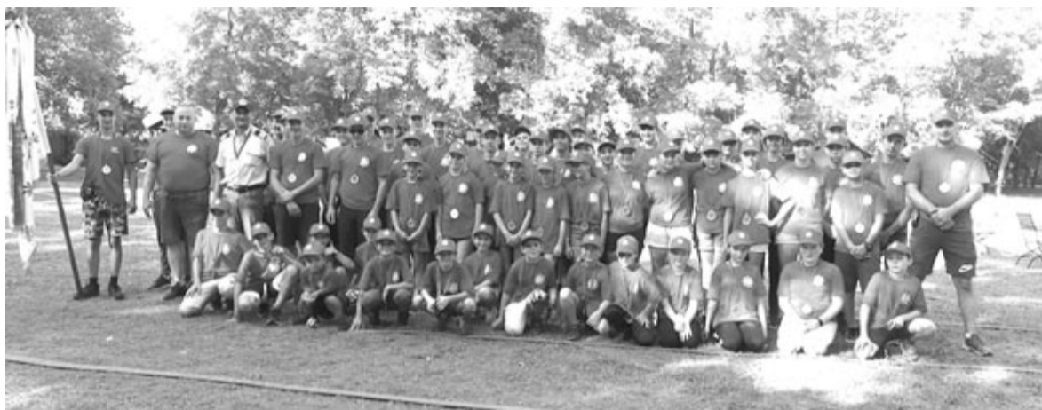
Hatvan gyerek és ifjú vett részt az első táborban, jövőre két korosztálynak szervezik meg

A tábori napirendhez tartozott a takarítás, mosogatás is. Ezt is a gyerekek csinálták, ők oldották meg