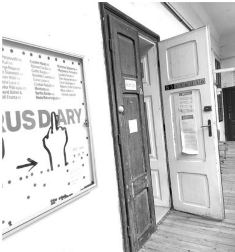
A B5 Stúdió bejárata

– Vannak, de nem áruolom el őket. Ismerem a projektek egy részét. Visszatérve a MAMŰ-re, amelynek egy adott pillanatban 30–35 tagja volt, de a vizes halmok projektben csak 5–7 ember vett részt. Még én sem tudom, mennyire csinálták ezt komolyan, mennyire volt játék. Őket sem érdekelte, hogy mennyire érti a nagyközönség. A többség hagyományos technikával, de valamilyen szinten abból egy kicsit kitekintve, hozta létre az alkotásait.