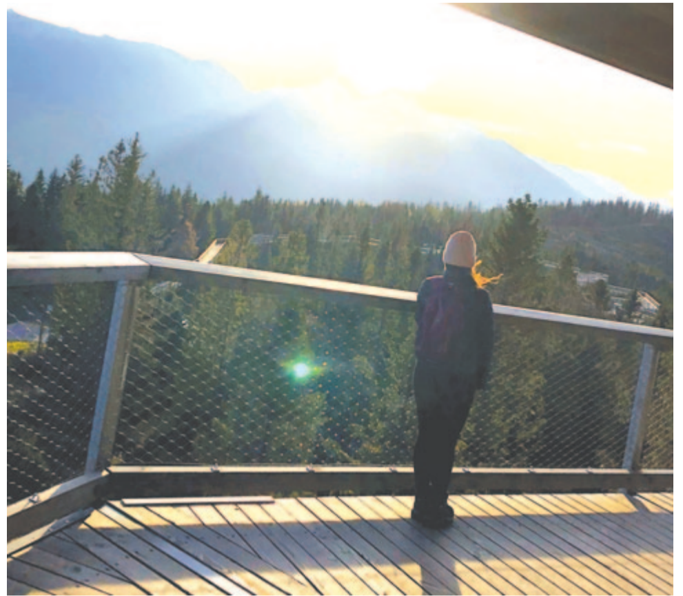
Leszáll a hegyről az árnyék, és még kaszálja tüzes fűrtjeid

1945. augusztus 6-án reggel 8 óra után 15 perccel és 17 másodperccel vakító kékesfehér fény lobbant Hirosima fölött, felrobbant az első atombomba. A robbanás körzetében 1,2 kilométer sugarú körben minden a földdel vált egyenlővé. Az áldozatok számáról csak becslések vannak: a hirosimai emlékművön 61.443 név szerepel, élelmiszerjegyét 78.150 ember nem váltotta be soha többé, az amerikai felderítés 139 ezerre tette számukat. A többség halálát nem a robbanás okozta, hanem az azt követő tűzvész, épületomlás és tömegpánik. Sokan csak napokkal később, a hőhatás, a lökéshullámok vagy a radioaktív sugárzás következtében, elképzelhetetlen