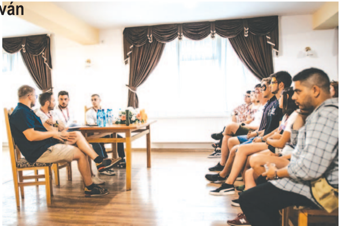
A konferencia lényege a meghatározó énünk megtalálása volt a számos beszélgetés, tudományos és vallásos megközelítés révén

A jelmondatot többféleképpen lehet darabolni: él, nem él, bennem él, bennem nem él – mindezekről az énekről volt szó, hogy mi van a felszínen, és mi van a mélyben. Mindent pedig különböző tudományágak szemszögéből próbálták megközelíteni. A nyitóelőadáson pszichológusi szemmel próbálták elmagyarázni a tudattalant, majd teológiai előadások, irodalmi panel-beszélgetések és sport révén próbálták megvizsgálni az adott témát. A vallási megközelítés mellett világi előadók is jelen voltak, akik a témát megtestesítő élettörténeteket mutattak be. Az első napon a teljes előadás-sorozat kiscsoportos beszélgetésekkel kezdődött,