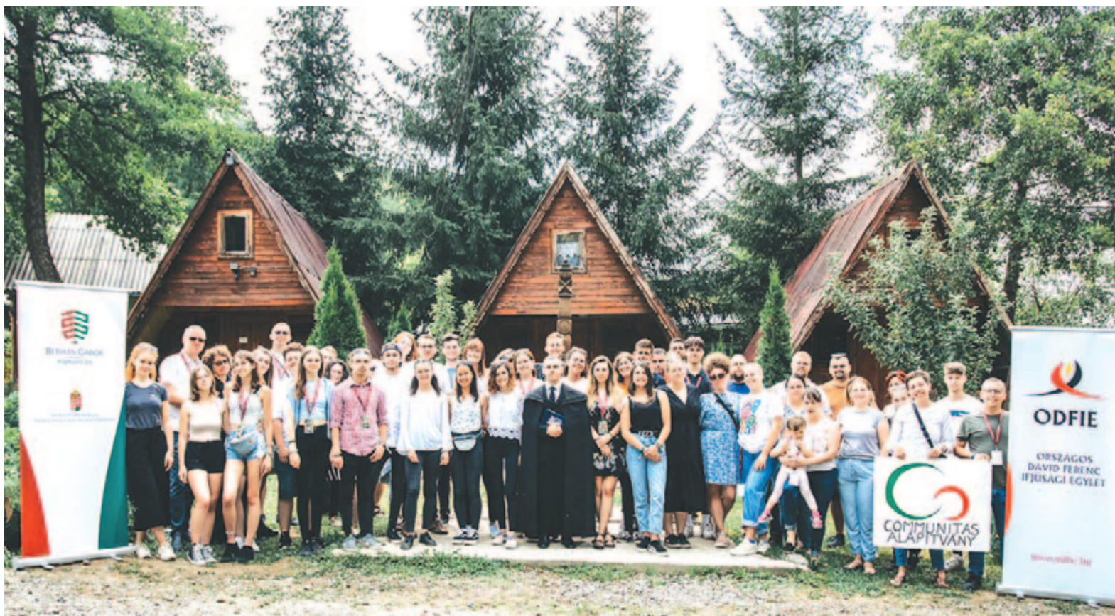
Minden évben a konferencia résztvevői jelet hagynak maguk után egy kopjafán

Az esemény a Bethlen Gábor Alapkezelő Zrt., a Communitas Alapítvány és a Unitarian Universalist Funding Program támogatásával valósult meg.