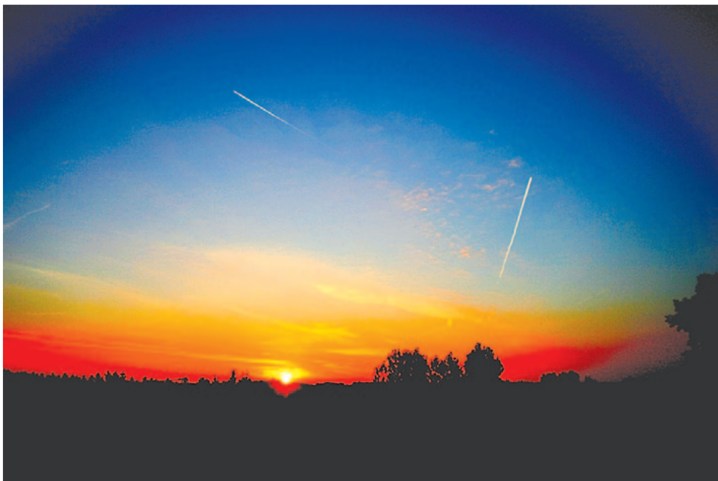
Pihennek a házak még csendben alva, de már lángtól vörös az égnek alja

Kelt 2022. augusztus 5-én, 77 évvel Hirosima utolsó békés boldog estje után.