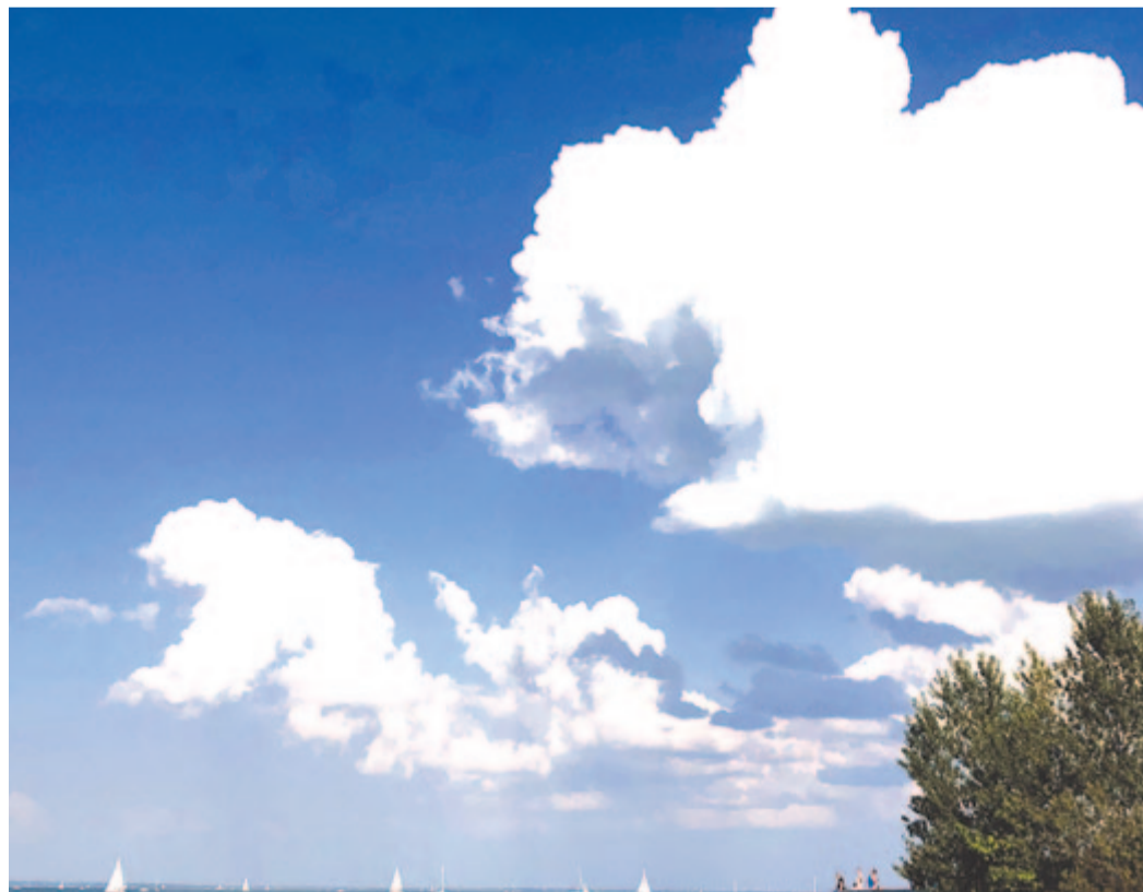
Tengernyi kék lepedő – júliusi Balaton

Maradok kiváló tisztelettel. Kelt 2022. július 22-én, 566 évvel a nándorfehérvári diadal után