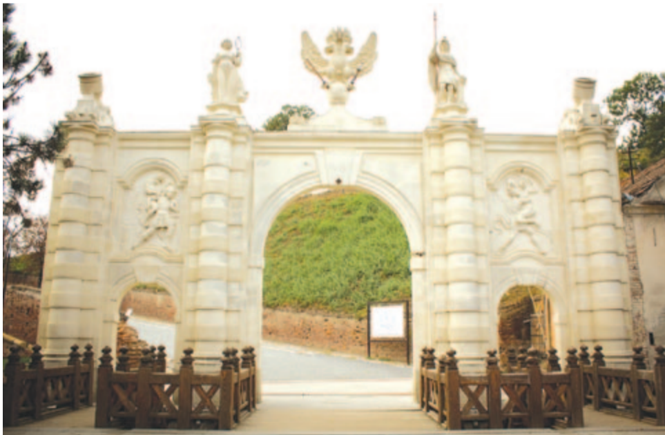
A gyulafehérvári vár bejárata

És itt még megjegyezzük, hogy az erdélyi püspökséget I. István király 1009-ben alapí-