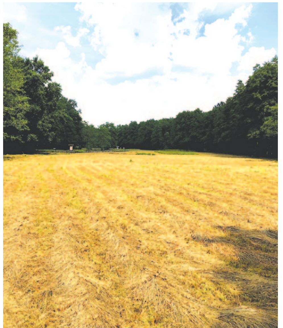
Július fényverése nyers – kaszák járta mező