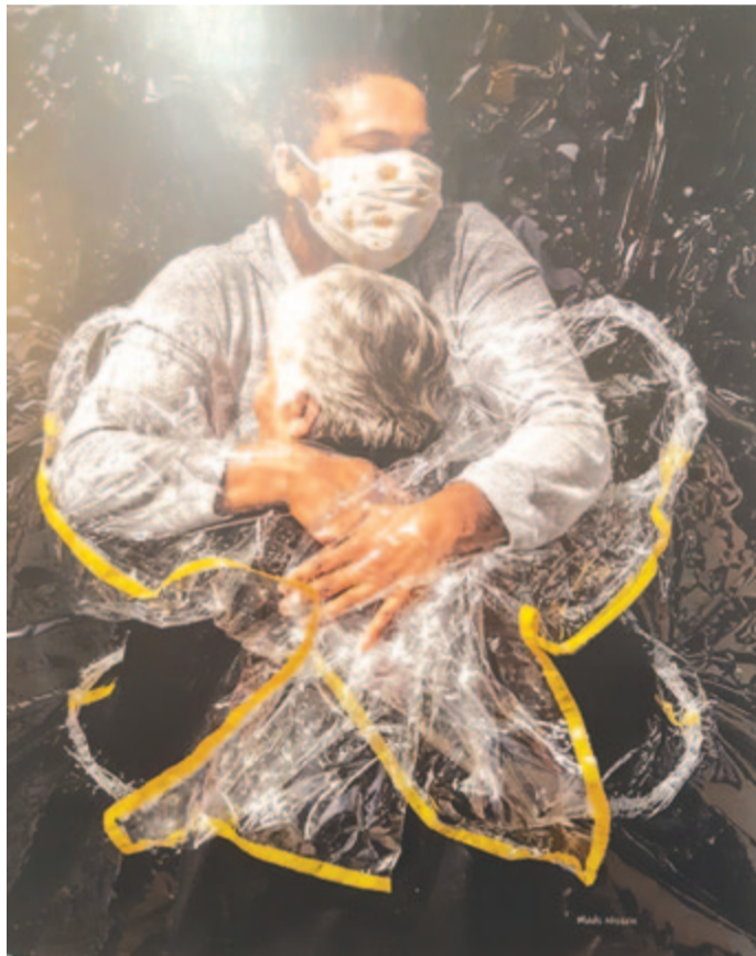
Az év sajtófotója

Covid-19 – Büntetés vagy kegyelem? Elgondolkodtató tárlat az elmúlt két év minden napjairól, reményről és reménytelenségről. Budapesten a hatodik kerületi Szent Teréz-