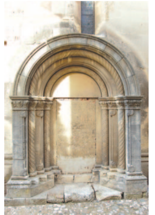
A régi sekrestye bejárata

Írott dokumentumokból derül ki az is, hogy 1516-ban Ulászló király az erdélyi káptalannak megparancsolta, hogy a vár régi, romlott falait az egyház és a haza védelmére új kőfállal és fedéllel erősítsék meg, melynek elősegítésére kétszáz aranyforint értékű só kiutalását engedélyezte.