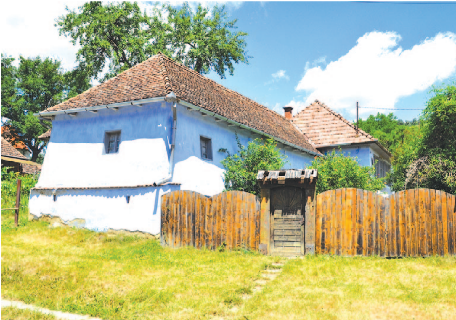
Bözödi György felújításra váró emlékháza