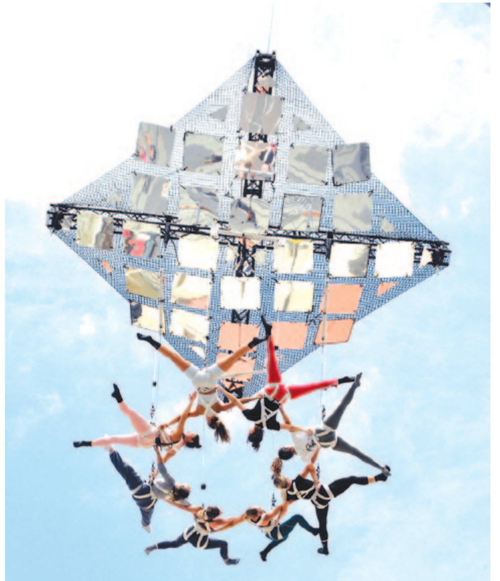
Aerial Strada utcai légtornászok (Spanyolország és Argentína): Sylphes