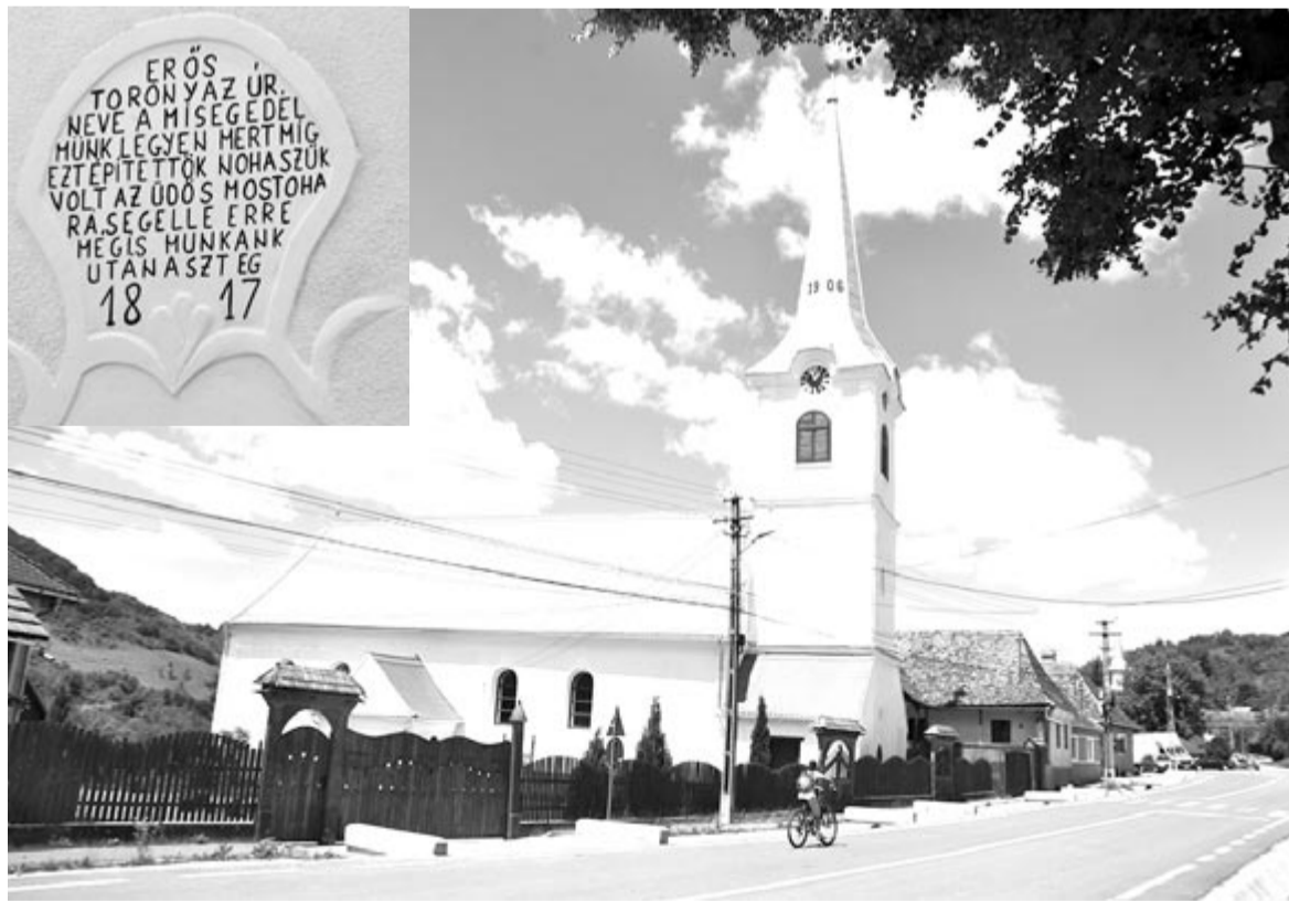
A felújított bözödi unitárius templom. A bejárat fölött a torony építésének éve

A felújított templom újraszenteletését jövő májusára tervezik, ugyanis 2023-ban lesz 210 éve, hogy a hívek használatba vehették Isten házát, és ez alkalommal nagyobb ünnepség szervezését is tervezik – mondta az esperes, majd hozzátette, hátramaradt a környék, a templomudvar megszüpítése, elrendezése is, amelyet szintén a közösséggel együtt tesznek majd rendbe. A bözödi unitárius egyházközséghez mintegy 230 lélek tartozik. A faluban még mintegy 90 református, néhány katolikus, Jehova tanúja és ortodox vallású él.