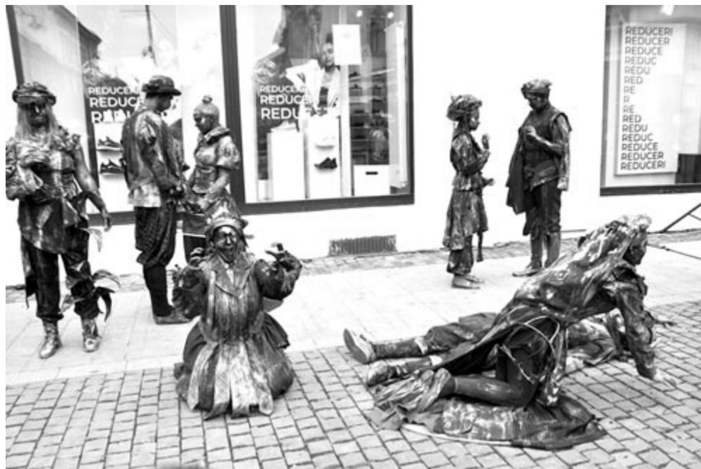
Rómeó és Júlia

További információk az egyetem honlapján, illetve az egyetem hirdető felületein található ( www.szini.ro , www.uat.ro ). További elérhetőségek: 0265-266281 (telefon/fax), e-mail: uat@uat.ro , székhely: Köteles Sámuel utca 6. szám, Marosvásárhely. (Knb.)