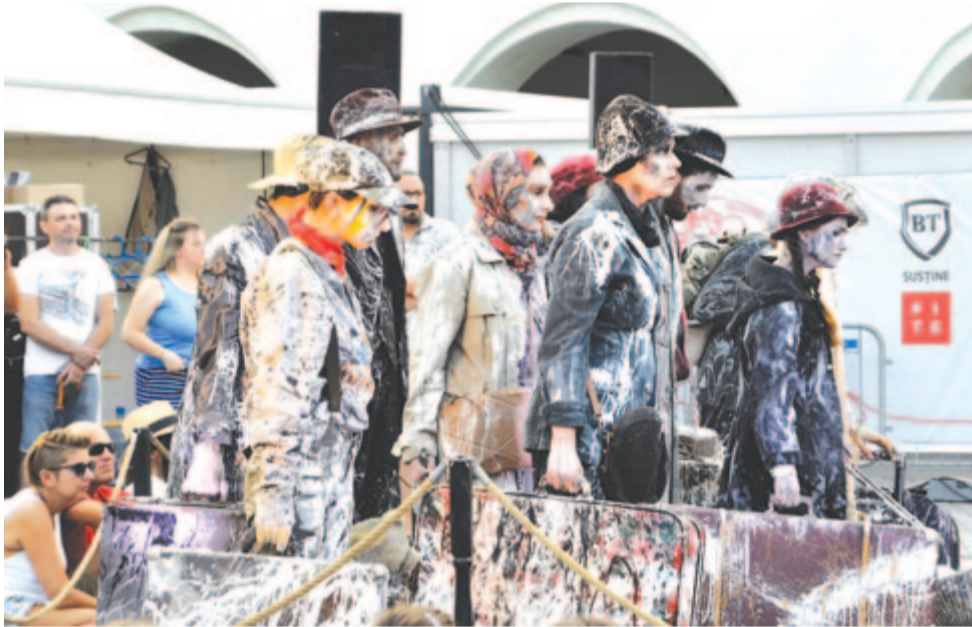
Teatru Masca: Exodus – rendező Mihai Mălaimare