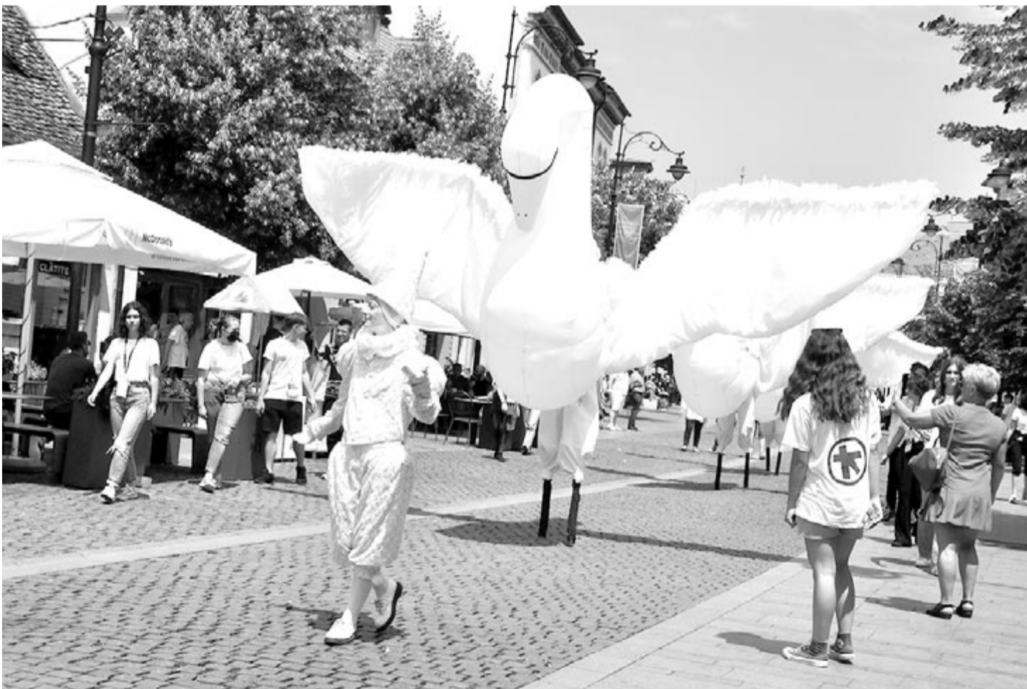
Teatro per Caso: Fehér hattyúk