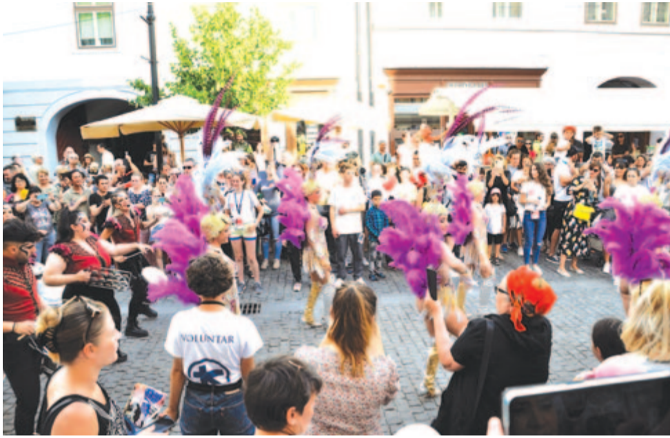
Batucada de Murcia & Carnival Group de Alicante: Karnevárra készülődve

A harmincadikat 2023. június 23. és július 2. között szervezik, valószínűleg a jubileumnak köszönhetően még gazdagabb programkínálattal. Addig is: egy évig tartó vastaps!