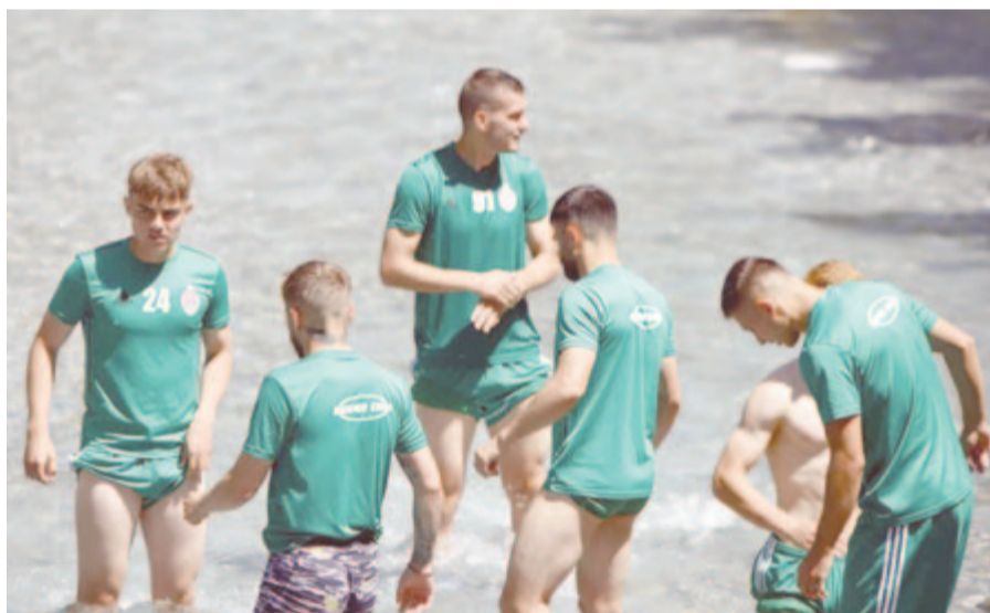
A hűsölésre is jutott idő Ausztriában.

Pályára léptek a második 2x30 percben: Niczuly – Mitrea, Dumitrescu, Ninaj, Bărbuț, Păun, Ion Gheorghe, Bojić, Tudorie.