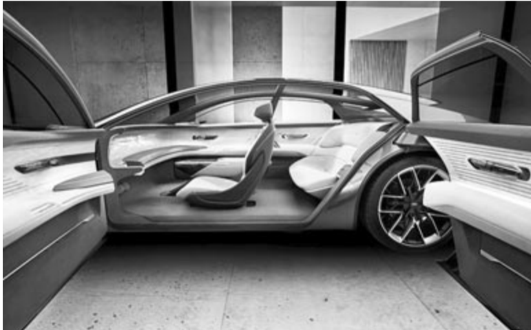
Önvezető autó beltere

Az utastér viszont teljesen át fog alakulni. Egyrészt az első ülések hátrafordíthatók lesznek azért, hogy