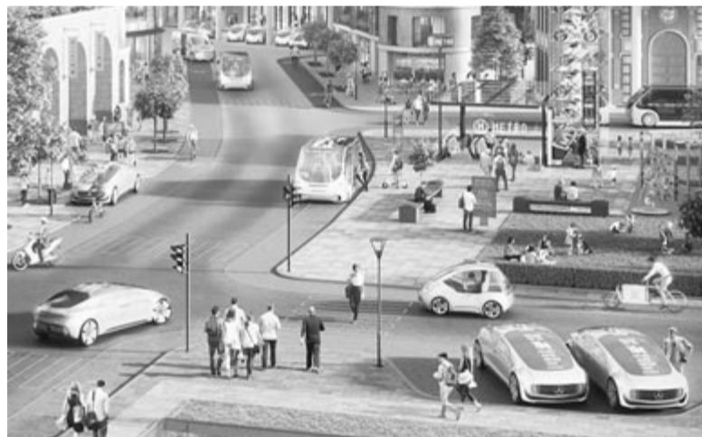
A jövő városai

Például pont úgy, ahogy az emberi szem sem lát át egy éles kanyaron, az önvezető autó szenzorjai sem fogják tudni, hogy mi várható a kanyar után. Az ilyen jellegű gondokról csak más közlekedők vagy kihelyezett érzékelők adhatnak hírt. Ebből kifolyólag a teljes önvezetés