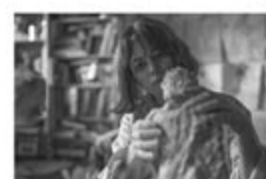
Gyenge Zsolt Cannes-i fesztiválnapló 2022 20