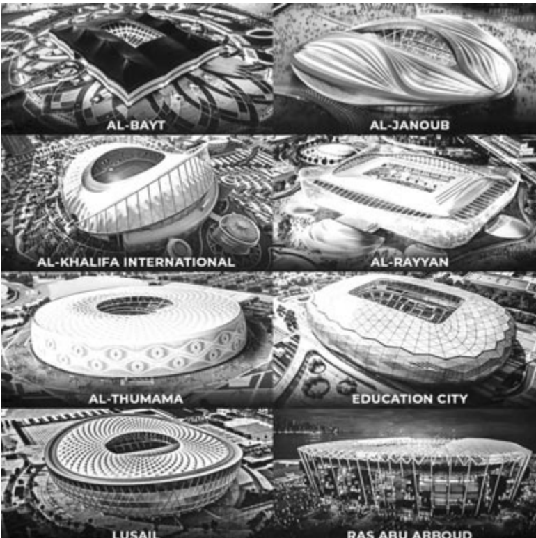
A katar vb stadionjai: a szervezők minden mérkőzésen telt házzal számolnak.

FIFA-ranglista (zárójelben az előző helyezés): 1. ( 1.) Brazília 1837,56 pont, 2. ( 2.) Belgium 1821,92, 3. ( 4.) Argentína 1770,65, 4. ( 3.) Franciaország 1764,85, 5. ( 5.) Anglia 1737,46, 6. ( 7.) Spanyolország 1716,93, 7. ( 6.) Olaszország 1713,86, 8. (10.) Hollandia 1679,41, 9. ( 8.) Portugália 1678,65, 10. (11.) Dánia 1665,47, 11. (12.) Németország 1658,96, 12. ( 9.) Mexikó 1649,57, 13. (13.) Uruguay 1643,71, 14. (15.) Egyesült Államok 1635,01, 15. (16.) Horvátország 1632,15, ...37. (40.) Magyarország 1486,76, ...54. (48.) Románia 1427,84.