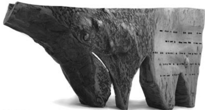
Kurjeló Tamás: Móra Lapszámunk 1., 3., 6., 9., 11-17., 19., 25. és 28. oldalán a Barabás Miklós Céh Maros megyei csoportjának tárlatáról írtuk, amely Marosvásárhelyen, a Bernády-házban látogatható.

A lapszám teljes tartalomjegyzéke az alábbi hivatkozáson érhető el: https://bit.ly/3Q1b7wh