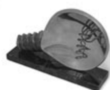
Vahe Arsen Versei 8