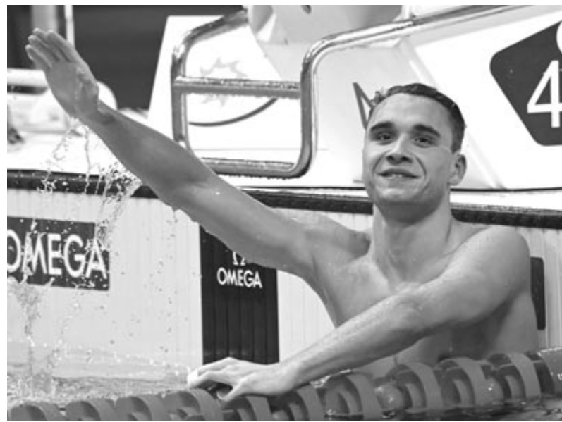
A győztes Milák Kristóf a férfi 100 méteres pillangóúszás döntője után a vízvilágbajnokságon a Duna Arénában 2022. június 24-én.

„Összességében elégedett vagyok a világbajnoksággal, a szervezéssel, azzal, hogy itt lehetünk. Remélem, akad még ilyen lehetőségünk, de ha nem, akkor találkozunk 2027-ben” – mondta a Honvéd klasszisa, aki hozzászólta, nagyjából öt nap pihenője lesz, utána viszont gőzerővel készül az augusztusi római Európa-bajnokságra, ahol hasonló sikereket szeretne elérni.