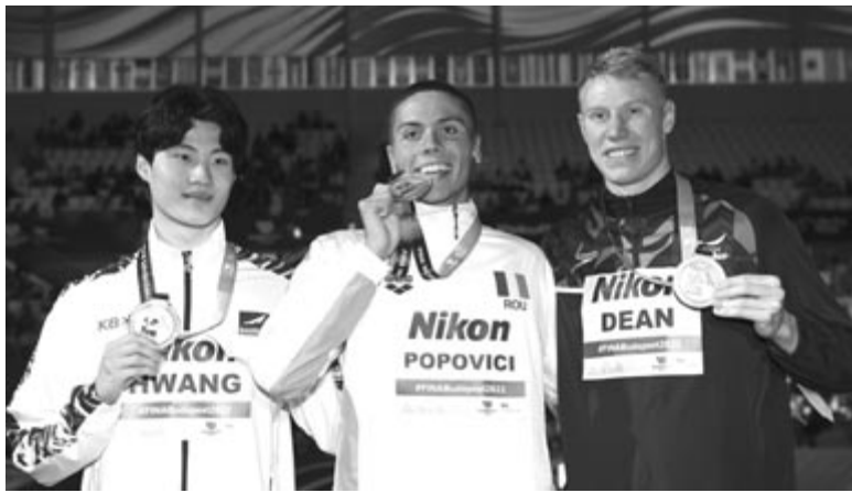
A győztes román David Popovici (k), a második helyezett koreai Hwang Szun Vu (b) és a harmadik helyezett brit Tom Dean (j) a férfi 200 méteres gyorsúszás eredményhirdetésén a vízvilágbajnokságon a Duna Arénában 2022. június 20-án.