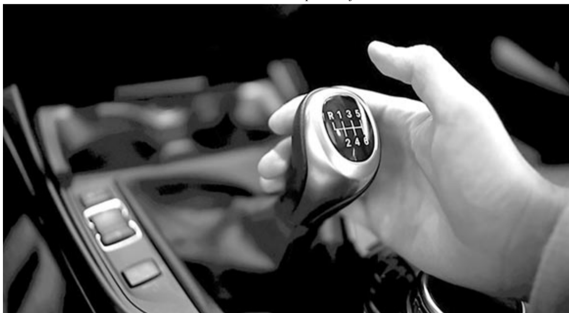
Kézi váltó, illusztráció

lanyautók Ausztráliában és az Egyesült Államokban vonzó a legkevésbé, legalábbis a 38, valamint a 29%-os szavazati arány alapján.