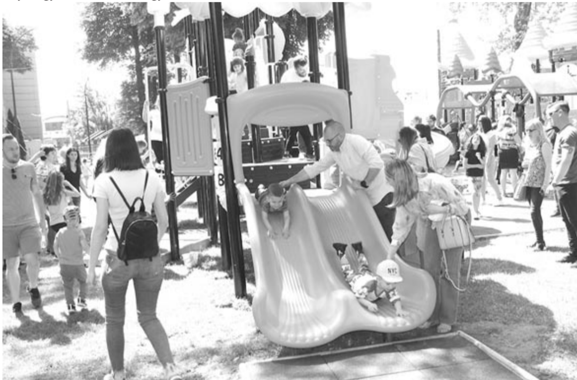
Illusztráció.