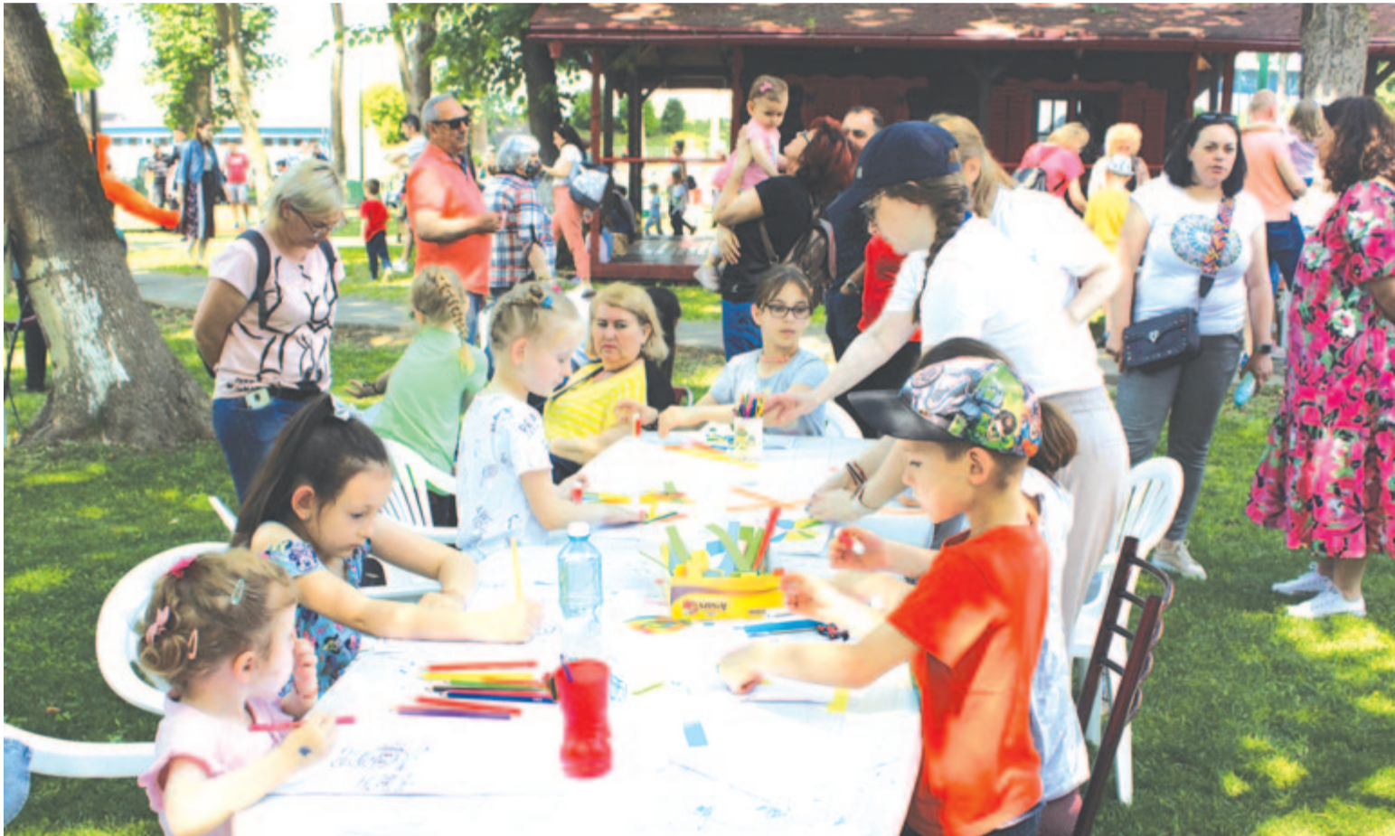
Felvételünk az idei gyereknapon készült Marosvásárhelyen