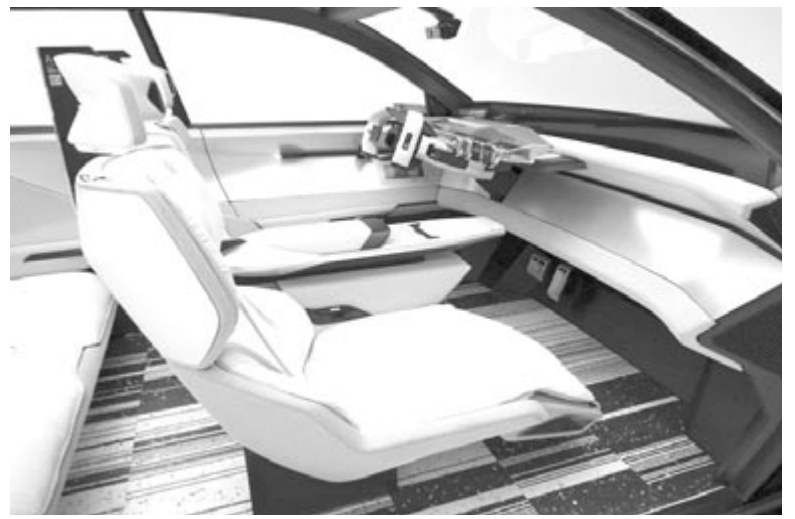
Renault Vision Scenic-beltér

Az autó külseje az éles-szögletes formákkal nem mindennapi látvány, csúnyának azonban aligha nevezhető. A Renault elmondása szerint a Scenic egy 2024-ben érkező családi modell előfutára. Az már egy másik kérdés, hogy valamelyikbe bekerül-e egyáltalán a hidrogénhajtás, vagy a francia gyártó megmarad a tisztán elektromos változatnál, esetleg beépít egy nagyobb akkucsomagot. Szintén kérdéses, hogy az olyan megoldások, mint például az egymással szembenálló oldalajtók, az ülésekben tárolt gubó-légzsákrendszer vagy a repülőgép stílusú kormány eljut-e a szériagyártásig. Érdekes technológiákról van szó, amelyre egyértelműen vevő lenne a piac, viszont ezeket a költségoptimalizálási fázisban szinte minden esetben levágják. Arról nem is beszélve, hogy