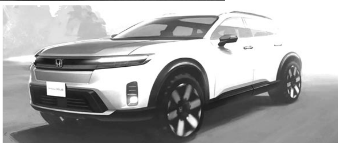
A Honda és a GM első közös fejlesztésű autója, a Prologue

jó oka volt. Mégpedig az, hogy előállt egy elektromos tanulmányautóval, amely a Vision Scenicet viseli. Azaz nem arról van szó, hogy egyszerűen elengedték a Scenicet, hanem újrashasznosították a nevet. Azonban csak ezt vitték magukkal, a régi Scenic formáját már nem. A tanulmányautó egy magas építésű – kicsit SUV-ra hajazó –, de alacsony hasmagasságú autó. Hasonló, mint a Renault Megane E-tech Electric, mindössze annyi a különbség, hogy egy méretostályllyal magasabban helyezkedik el. A Vision Scenic 4,49 méter hosszú, a tengelytávja 2,835 méter. Bár méretben nagyobb, mint a Megane E-