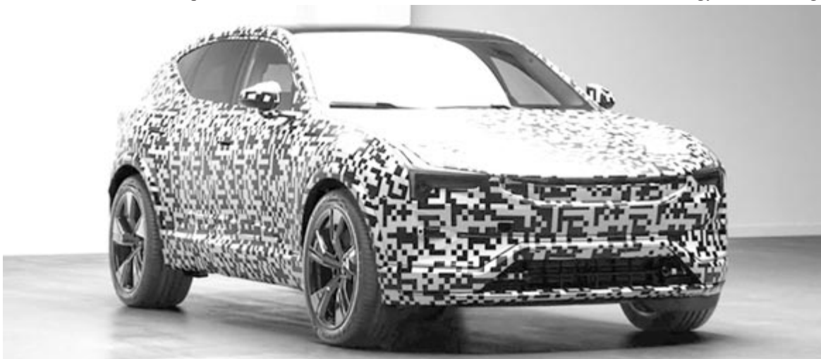
Polestar 3, álcázott formában

Az új típus feltehetőleg a GM mexikói üzemében készül. Azonban a Prologue nem az első és utolsó közös fejlesztésű autó, ez csak a kezdet. A jövőben teljes villanyautó-paletta készül bemutatni közösen a GM és a Honda.