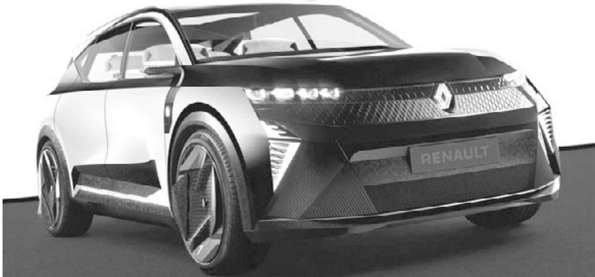
Renault Vision Scenic

Ezek értelmében a Polestar is a Teslát próbálja másolni. Alighanem