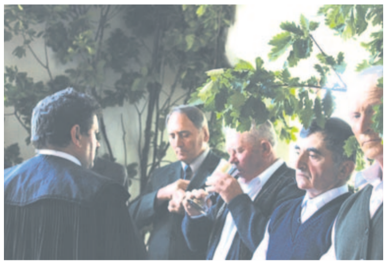
Pünkösdi úrvacsora a kőbölküti templomban (2013)

volt szeretőjük, vagy nemrég kötözték a faluba, azoknak kisebbeket tettek. A zöldágazásról a legényeket minden háznál behívták, itallal kínálták. Újösben csak a nagy-leányok kapuját díszítették pünkösdkor a májusfához hasonló gyertyánfaágakkal. A visszaemlékezések szerint régebb a legtöbb leánynak tettek, és szégyennek tartották, ha nem volt a leány kapuján pünkösdfa. 2013 pünkösdjén még láthattam, hogy szépen díszlegnek a magyar többségű utcákban. A vegyes lakosságú mezőségi falvakban tehát magyar identitásjelző funkciójuk is volt. Néhány településen a pünkösdi virágozás leginkább a gyermekek körében népszerű. Az észak-mező-ségi Tacson mind a nagyleányoknak, mind a leánygyermeknek tettek zöld hársfaágat, napjainkra már gyermekszokássá vált. Hasonló a helyzet Mezőpanit szomszédságában, Székelykövesden, itt a leánygyermeknek tesznek zöld ágat, illetve virágkoszorút. Ezekben a falvakban a szülők, a családok kapcsolatrendszerét, baráti körét jelzik a pünkösdi virágok, vagy egyszerűen azt, hogy hány a leánygyermek az illető településen. Egyre kevesebb van.