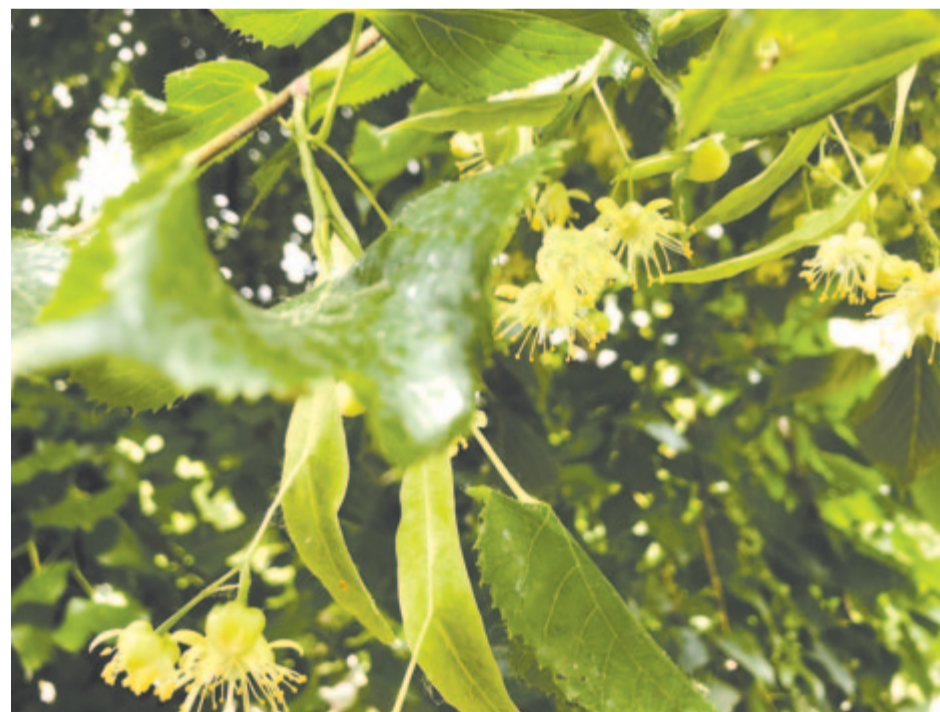
Nyílnak már a hársak a Trébely alatt

Itt hátrább e kettős horpadásban, mely éppenhogy kitapintható, a fürdés-s az úszástudomány van, a Duna vonzása, meg a tó