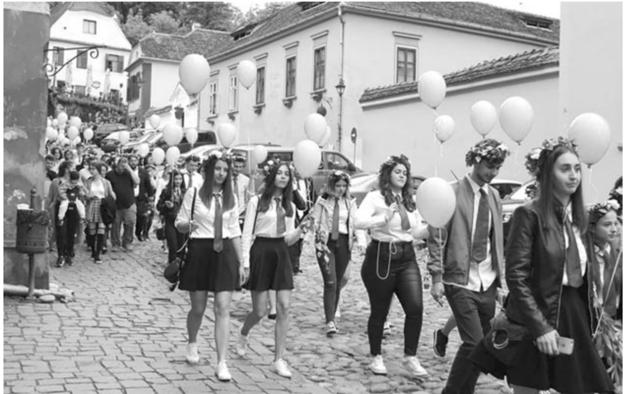
Ballagtak a segesvári Joseph Haltrich Elméleti Líceum diákjai

27-én, pénteken (ma) 9.30-tól indul a Bolyai Farkas Elméleti Líceum és a Református Kollégium végzőseinek díszkörmenete, 10 órától ökumenikus istentiszteletet tartanak a Vártemplomban, majd 11 órától a váruddvaron kezdődik a ballagási ünnepség. 10 órától a Kultúrpalotában tartják a Marosvásárhelyi Művészeti Szaklíceum kiscsengetési rendezvényét. Ugyanekkor kezdődik a nyáradszeredai Bocskai István Elméleti Líceum ünnepsége. A szovátai Domokos Kázmér Szakképző Líceum és az erdőszentgyörgyi Szent György Szakképző Líceum végzőseit 11 órától búcsúztatják a tanintézet udvarán.