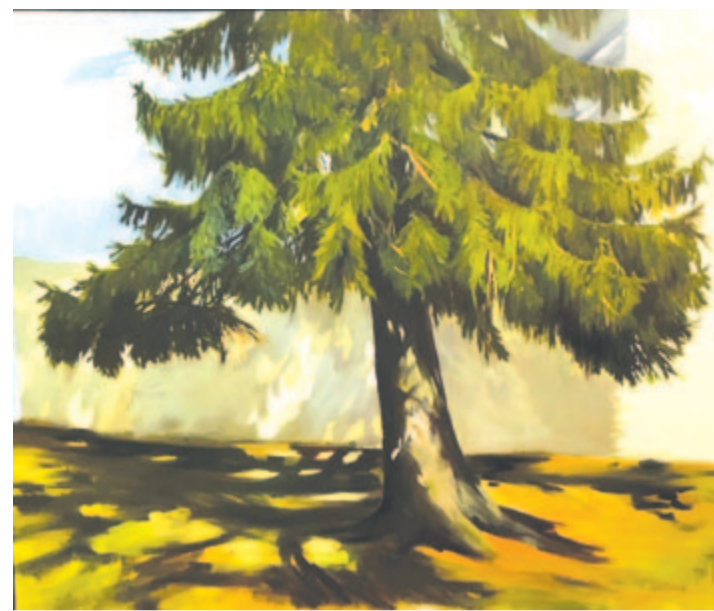
In laudem confiniorum – Öry Annamária: Fenyő

1949. május 30-án született Fabinyi Rudolf vegyész. 1878-tól a kolozsvári állami vegykísérleti állomás igazgatója, 1899–1900-ban az egyetem rektora volt. A Magyar Kémikusok Egyesületének első elnökevé választották. 1884-ben Magyarországon az első kö-