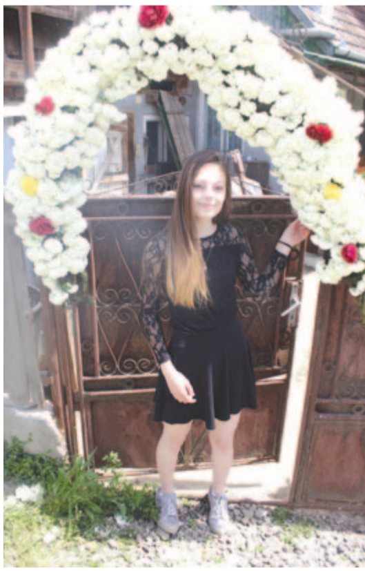
Konfirmált leánysorba nőve először örülhet a sokrozsás bolthajtásnak (Mezőpanit, 2021)

Néhány mezőségi faluban napjainkban is gyakorolják azt a középkori eredetű szokást, hogy pünkösöd ünnepére a közösség szakrális központjában, a templomban vagy a templom ajtaján helyezik el a zöld ágakat, mintegy a Szentlélek kitöltését jelképezve. A belső-mező-ségi Kőbölküton a református templomban felállított három-négy méteres tölgyfaágak között tartják az ünnepi istentiszteletet, és veszik magukhoz a pünkösdi úrvacsorát. A tölgyfaágakat a gyülekezet fiataljai hozzák a közeli erdőből a presbiterek segítségével. A kőbölküti nagyon ragaszkodnak a templomi pünkösdi zöld ágakhoz az észak-mező-ségi Zselyk evangélikus felekezetű magyarjai is. Itt hársfaágakat vágunk az erdőből a fiatal legények, ünnep szombatján a padosorok mellé és a templom kapujához állítják. Zöld ágak között tartják a pünkösdi istentiszteletet emberemlékezet óta, mondják. A múlt század közepéig a Marosvásárhely közeli, székely mezőségi Csittszentiván református és Szabéd unitárius templomának belső terét is zöld ágakkal díszítették pünkösöd ünnepére. Utána változott a szokásrend: a