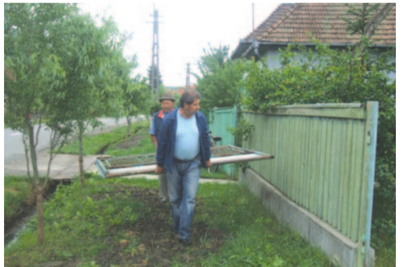
Az apák és nagyapák dolga, hogy hazahozzák az éjszaka eltűnt kaput... (Mezőpanit, 2011)

fel-fellángolt a legénysorba igyekvő fiatalok kapulopási láza, aztán hosszabb időre lelohadt. Az egyházi és világi elöljárók igyekeztek örökösíteni az ünnep szép szokásrendjének megtartását, az ünnepontás elkerülésénél, akár úgy is, hogy a templomban szóvá tették a kirívó eseteket, vagy presbitéri határozatokat hoztak azok elkerülésére. Ezek a tiltások viszont a virágozás „rendes szokását” is befolyásolták, mint ahogyan az elmúlt évtizedben Csittszentivánon tapasztalhattuk. A szokások „elhanyagolódásának” nyilván nemcsak a tiltások az okai. A kisebb falvakban megfoghatóak a lehetséges „ajándékozók” és az „ajándékozottak”, és jól észrevehető tendencia a hagyományos szokások elhagyása is. 2021 pünkösdjén nem láttam kivirágozott leánykaput sem Csittszentivánon, sem Bergenyében, sem Kölpényben, az északibb Cegőtelkén és Újösben is kimaradt. Csak két faluban volt szinte ugyanannyi kivirágozott kapu, mint évtizedekkel ezelőtt: Szabédon és Panitban. Szabédon a szokás szerves részének tartották a kártevés nélküli viráglopást és a kapuelvitel legénytréfáját, 2021-ben viszont rendőrségi beje-