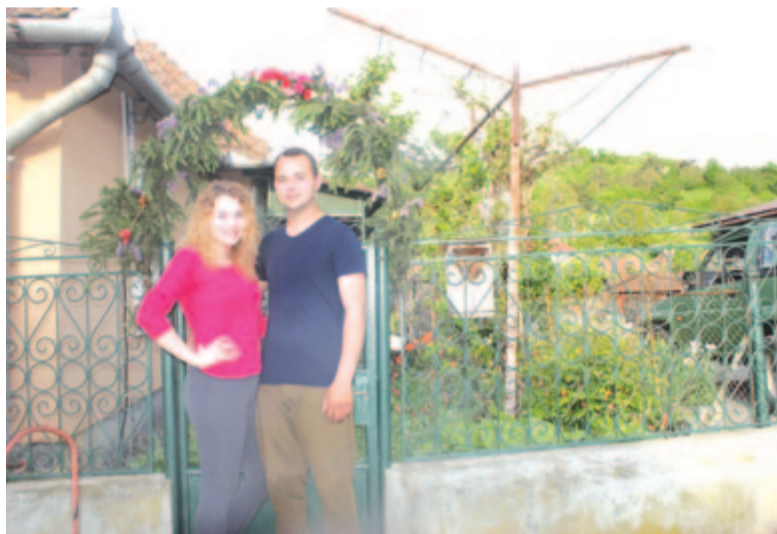
A szabédi bolthajtás üzenete nyilvánvaló: nem sokára meglesz a lakodalom (2021)

A tavaszi zöld ág a természet megújulásának, az életnek, az egészségnek, a termékenységnek ősi, egyetemes szimbóluma. A zöld szín pedig a kereszténységben a feltámadás és a halhatatlanságé, a Szentlélek és a reményé. Tavaszi ünnepeink, népszokásaink legtöbbszörében (virágvásárnapon, húsvétkor, Szent György napján, május 1-jén, pünkösdkor, úrnapi) napjainkig élünk a kizöldült vagy örökzöld ágak és a virágok többféle jelképes funkciójával. Pünkösöd, a Szentlélek ünnepe is egyik ilyen jeles és jelképes alkalom. Kárpát-medencei és erdélyi magyar tájainkon többféle pünkösdkor állítottak zöld ágakat, ajándékoztak virágokat. Az erdélyi szászok körében általános volt ez a szokás, a románok körében szórványosabban. Az alábbiakban – az elmúlt évtizedekbeli gyűjtéseink alapján – a mezőségi falvakból szeretném bemutatni vagy csak jelezni a pünkösdi „zöldágazás”, „virágozás” változatait és változásait. Az ezeket a szokásokat életető falvak magyar lakossága többségében református felekezetű, illetve van egy evangélikus és egy többségében unitárius falu is.