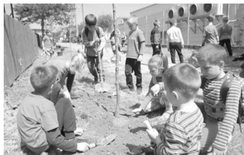
A szovátai faültetés csak egyik szakasza a megyei önkormányzat által támogatott projektnak

leti tagnak és helyi lakosnak, aki részt vett a takarításban, és hozzá-