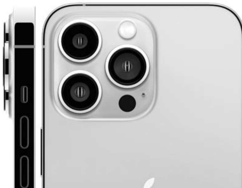
iPhone 13 Pro, illusztráció

A SellCell összehasonlította a Google Pixel 6-ot, az iPhone 13-at és a Samsung Galaxy S22-t. A felsoroltak közül a Pixel 6 a legolcsóbb, míg a Samsung és az iPhone árai megegyeznek, legalábbis az Egyesült Államokban. A felmérés eredménye igazán sokkoló lett, hiszen alig két hónappal a megjelenése után az S22 átlagosan 46,8%-ot veszített az értékéből. Ez az arány az új és a használt telefonok közötti különbségre utal. A Pixel 6 sem teljesített valami fényesen, de ezt a szintet azért tudta überegni, egy két hónapos karcmentes