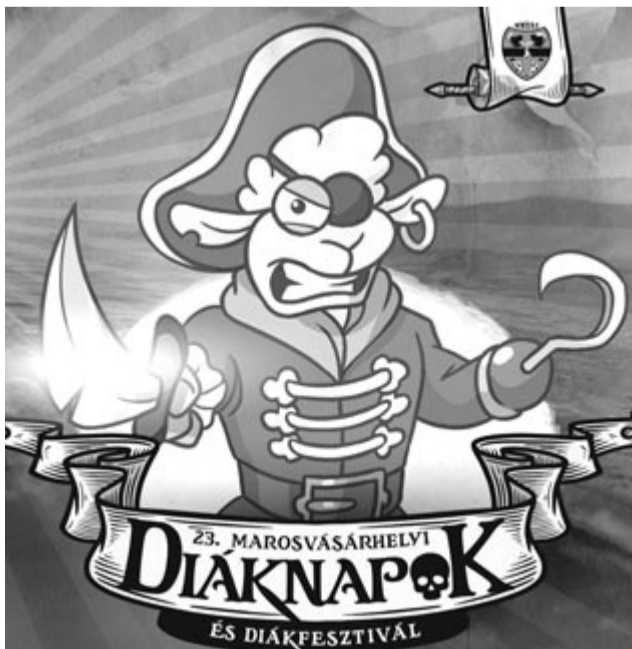
A 2022-es diáknapiak plakátja

– Eddig 23 csapat regisztrált, csapatonként 30-34 taggal. Ez szűk 700 ember. Ezenkívül körülbelül 60-70 résztvevő fog folyamatosan tevékenykedni. Tehát körülbelül 800 fő fog aktívan részt fog venni a diáknapiakon. Továbbá körülbelül ugyanennyi külső szimpatizánsra és szórakozni vágyó fiatalra számítottunk, összesen körülbelül 1600-1700 főre, és természetesen várunk mindenkit sok-sok szeretettel!