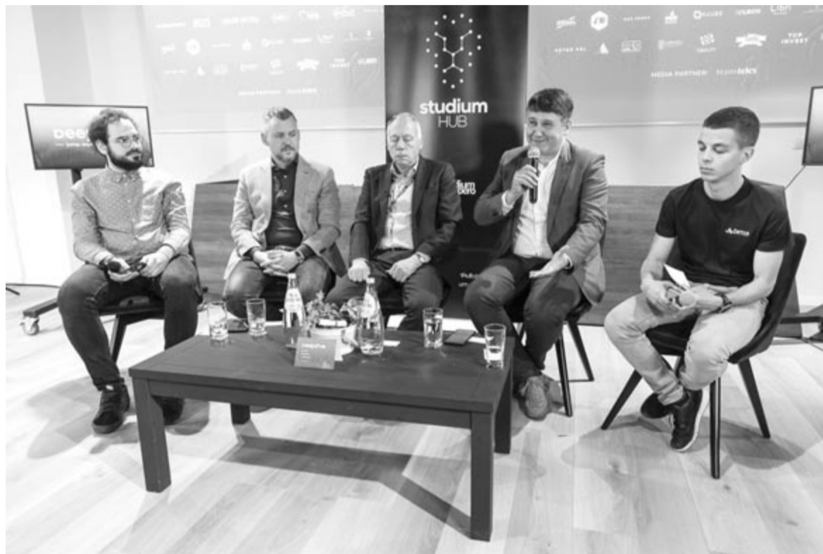
A DeepDive kulturális-tudományos-közéleti fesztivál megnyitóját

hozzanak létre, amely teret biztosít az új kezdeményezéseknek. A Studium Prospero Alapítvány ügyvezető elnöke úgy vélekedett, hogy egy ilyen esemény megszervezése felér azzal, mint mikor évekkkel ezelőtt megszervezték az első egészségügyi konferenciát vagy az első diáknapokat. Reményei szerint az eseményből évek múlva egy rangos szakmai tudásátadás biztosító rendezvény nő ki.