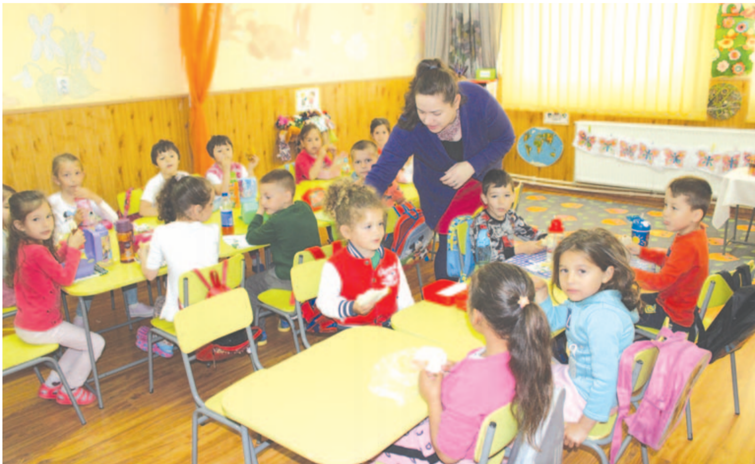
Mezőmadarasi Népszó a 6. oldalon