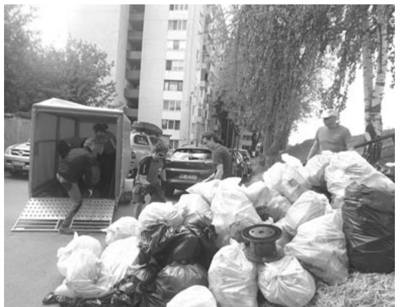
Zsákokban a szemet