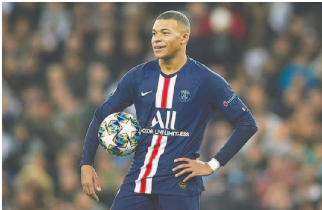
Mindenki beszél, de senki nem tudja... – írta ehhez a fotóhoz a PSG francia sztárcsapatja egy korábbi posztjában, amelyet közösségi oldalán tett közzé

Több hírforrás arról számolt be hétfő este, hogy a 23 éves futballista, akinek június 30-án lejár a szerződése a Paris Saint-Germainnél, évi 30 millió eurós fizetésre, egy 120 millió eurós aláírási bónuszra, illetve a nevéből keletkező bevételek jelentős részének megtartására bőlintott rá a Real Madridnál.