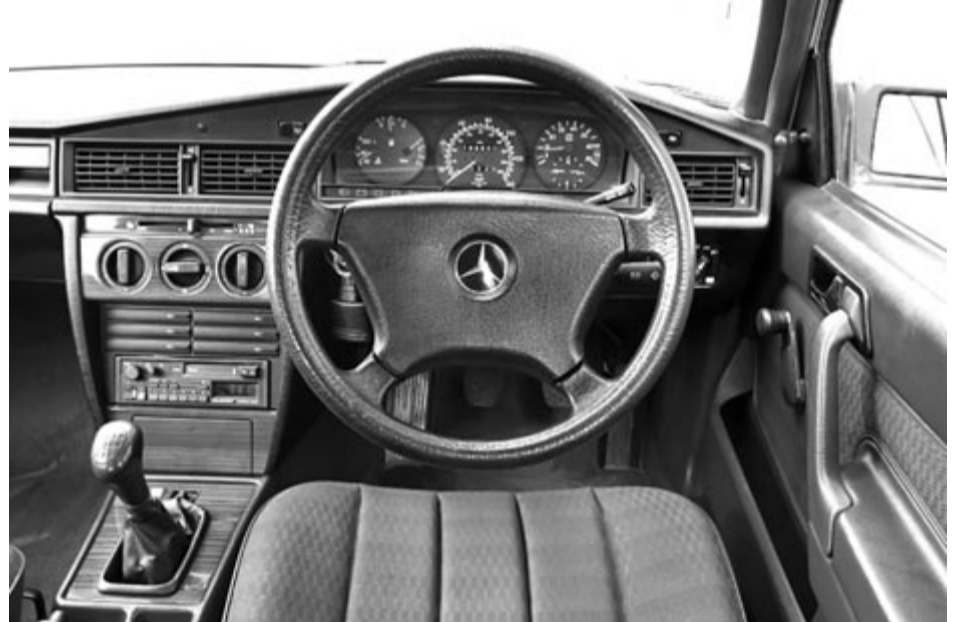
Jó állapotú autó

A hirtelen erőhatások nem tesznek jót az autónak, ez igaz a hirtelen kuplungolásra vagy a váltókar rángatására is. A hirtelen és durva kapcsolás nemcsak a váltó és a kuplung élettartamát rövidíti, hanem a féltengelycsuklót is. De a kapcsolószekrény is nagyon hosszú élettartammal hálálja meg, ha finoman bánunk vele, és egyenletes mozdulatokkal húzzuk be a következő fokozatba. A motorfékhasználat is elkerülendő, hiszen nem tesz jót a váltónak, illetve érdemes szem előtt tartani, hogy a fékbetét- (és féktárcsa-) csere még mindig sokkal olcsóbb, mint a kuplungcsere vagy a váltófelújítás.