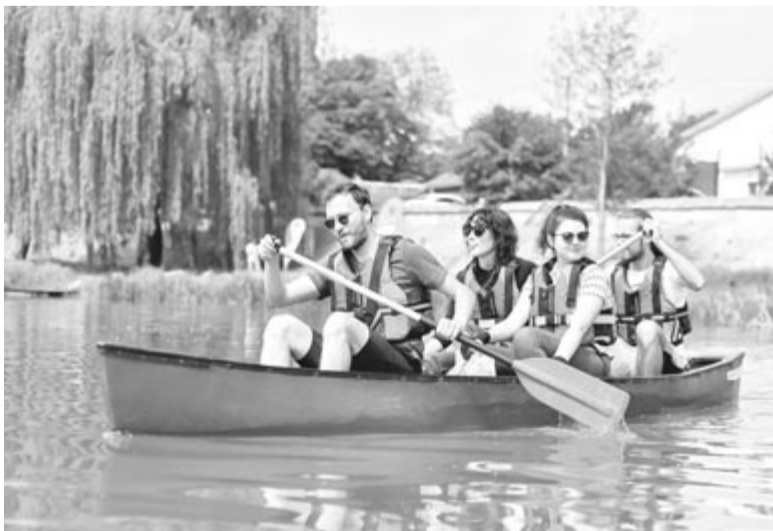
A vízből is kiszedték a szemetet.

– Mennyire voltak vonzóak a különböző programok? Volt olyan, aki kimondottan csak ezekért ment el?