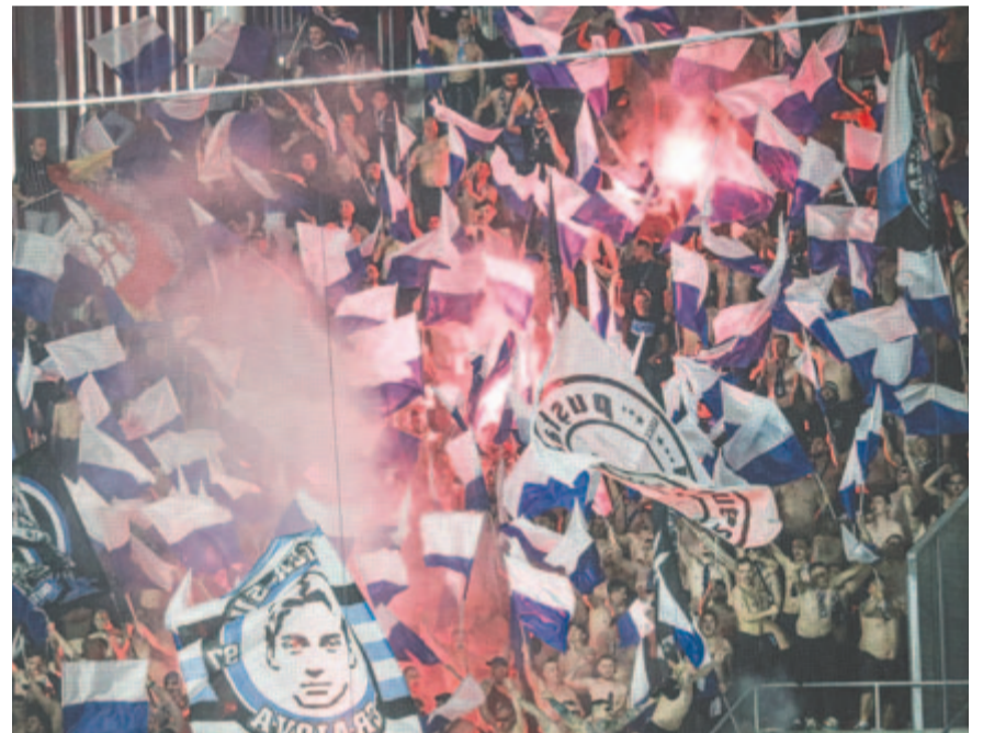
A craiovai közönség elvetette a sulykot

A 37. fordulót követően a következő az állás a másodosztályú bajnokság élén: 1. (és feljutott) Vasas FC 84 pont, 2. (és feljutott) Kecskemét 74, 3. Diósgyőr 69.