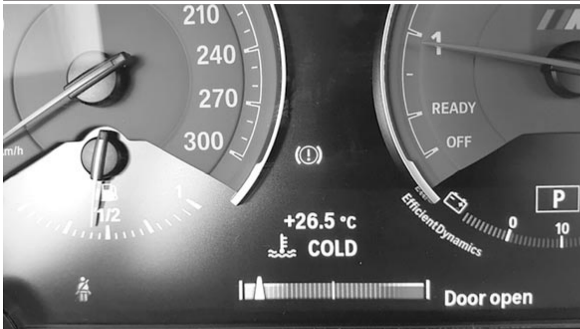
Hagyni melegedni, hagyni hűlni a motort