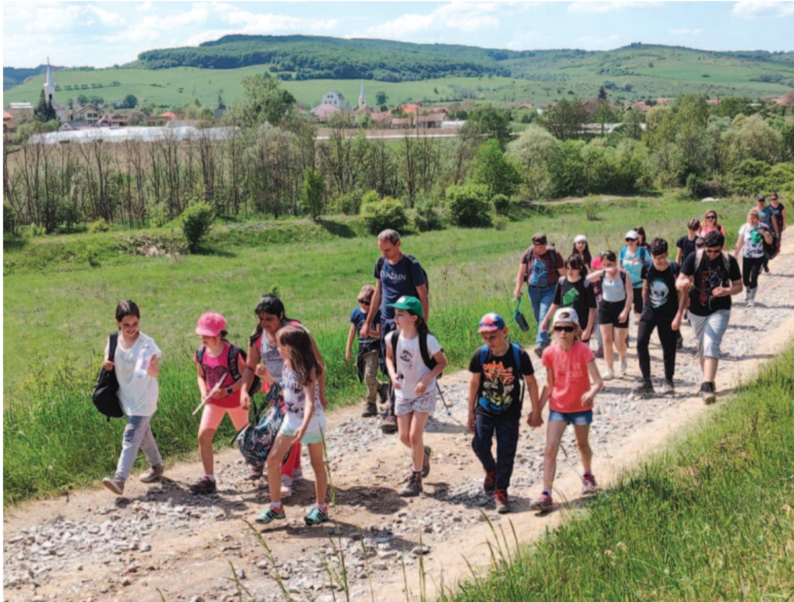
A Só útját végigjárni nem teljesítmény kérdése, hanem a természet szeretete