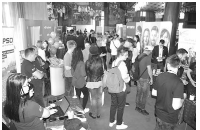
Illusztrációnk a május 10-i állásbörzén készült felvételt a Marosvásárhelyi Nemzeti Színházban.

Az eseményen való részvétel ingyenes – tájékoztatott a Maros Megyei Munkaerő-foglalkoztatási Ügynökség. (szer)