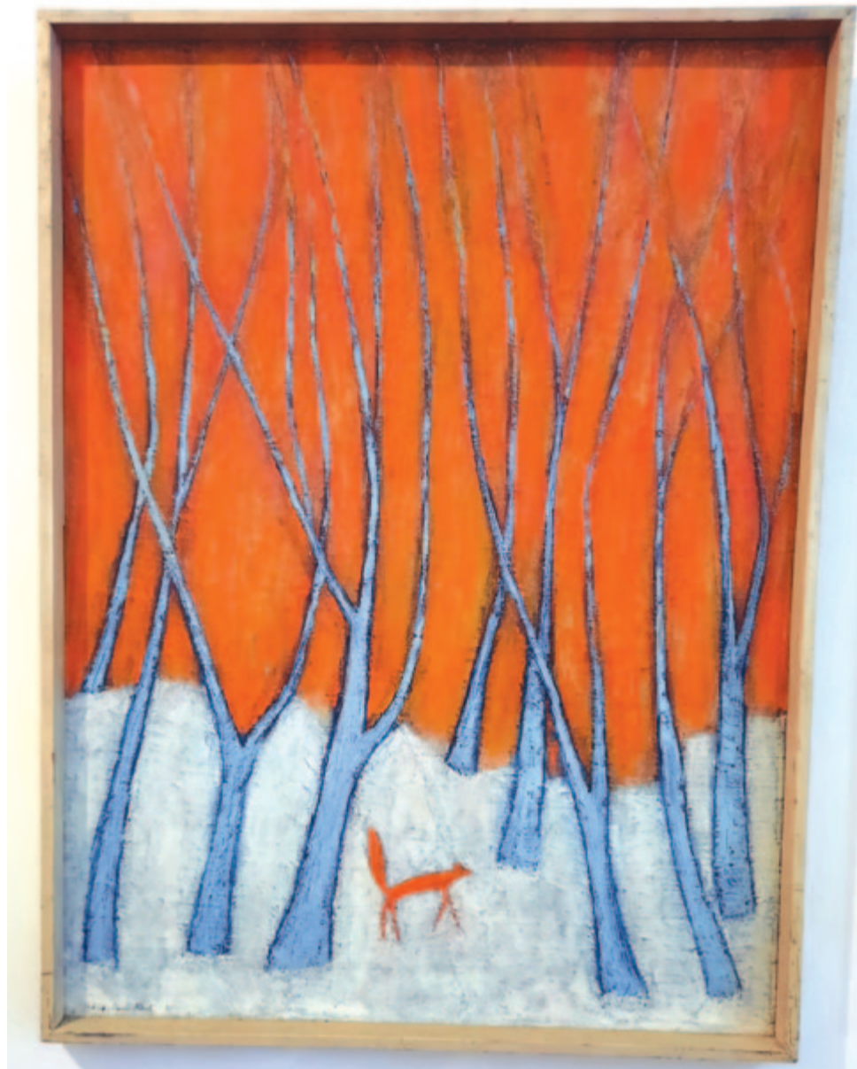
Téli erdő piros rókával, 1975