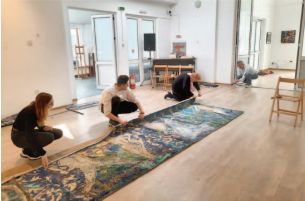
Csoportmunka... Családi összefogás tárlatrendezés közben