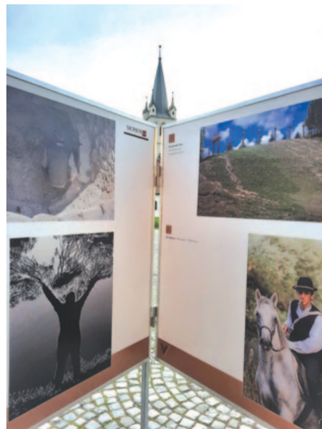
Kiállításrészlet szemközt a toronnyal

nes, sokrétű összképet rajzolnak ki a régió településeiről és lakóiról a harmónikuszerűen kigyózó kiállítófelületen. A tárlatot a hét végén a Múzeumok Éjszakája eseménysorozaton még megtekinthetik az érdeklődők, május 15. után más helyszínre szállítják.