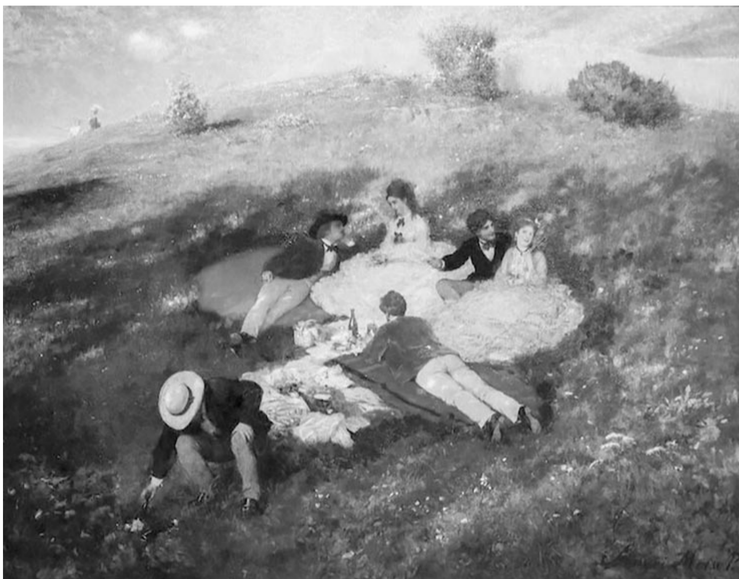
Szinyei Merse Pál: Majális