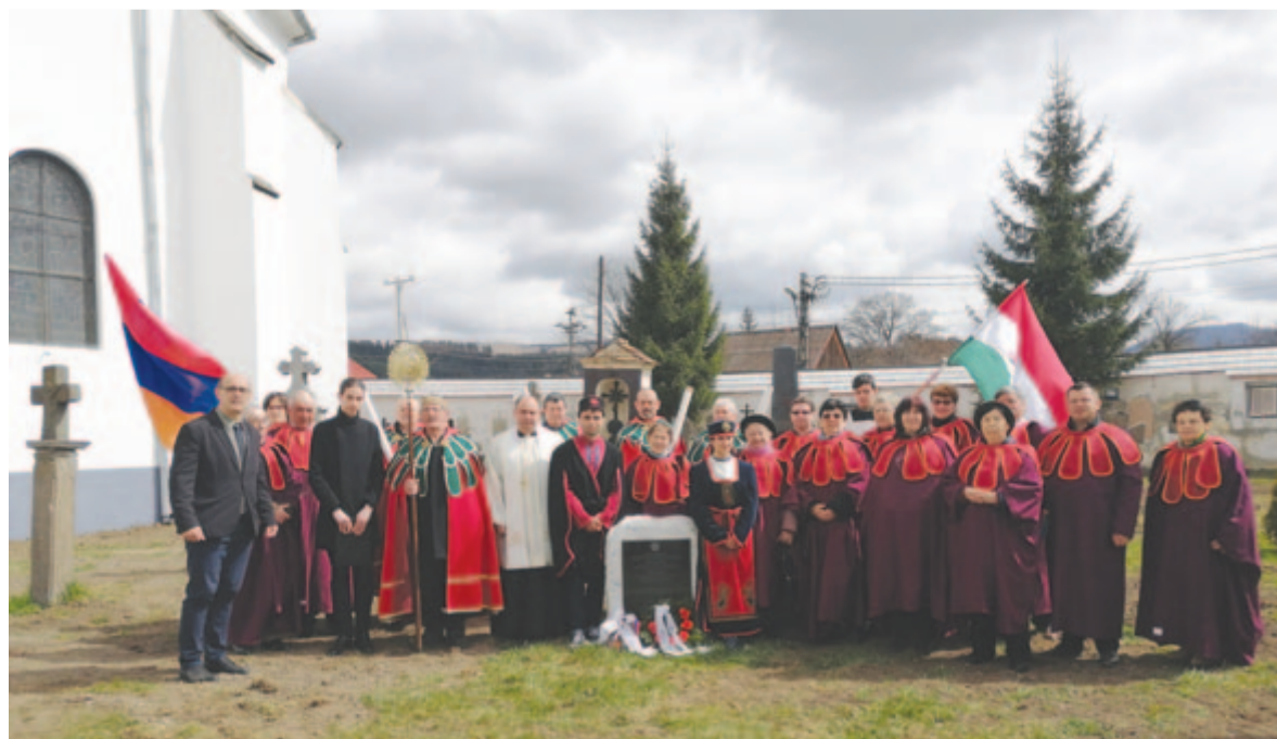
Gyergyószentmiklós: a Székelyföldön itt található az egyetlen genocídium-emlékhely

A rendezvényen rockzenei audióval egybekötött előadást tartott egy volt diákunk. Az amerikai örmény származású rockegyüttes, a System of a Down dalait hallgatták. A formáció tagjai örmény származásúak, és az együttes frontembere több dalban is megéneklie a genocídiumot. Az együttes kötelességének érzi, hogy híret vigye ennek a rettenetes eseménynek, és felhívja a világ figyelmét arra, hogy mit éltek át az örmények, továbbá hogy érzékenyítse a világ vezetőit, hogy ezt ismerjék el népi társaságként, hiszen, mint már mondtam, nem minden ország ismeri el az örmény genocídiumot; és nem utolsósorban, hogy az embereket figyelmeztessék: figyeljenek egymásra, próbálják egymás kulturális értékeit megbecsülni.