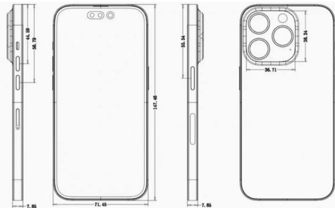
iPhone 14 tervrajz

Az Apple 2021 őszén mutatta be az aktuális felső kategóriás telefonjait, március elején pedig megérkezett az olcsóbb ársávban elhelyezkedő SE 2022. Nyílt titok, hogy a következő csúcskategóriás telefonokra szeptemberben lehet számítani, amikor megérkezik az iPhone 14 széria.