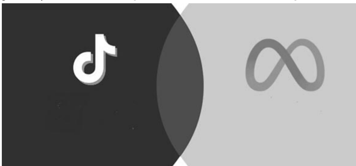
TikTok vs. Meta

A tervrajz továbbá alátámasztja azon közelmúltbeli pletykákat, melyek szerint kisebb lesz a szenzor-sziget, azaz a notch. A tervek szerint idén két kisebb sziget fogunk kapni az egy nagyobb helyet. Ezek közül a szélesebb tartalmazza a FaceID modult, a kisebb, kör alakú kialakítás mögött az előlapi kamera rejtőzik. Ezt az új felállást előreláthatólag először az iPhone 14 Pro és 14 Pro Max modelleken fogja alkalmazni az Apple.