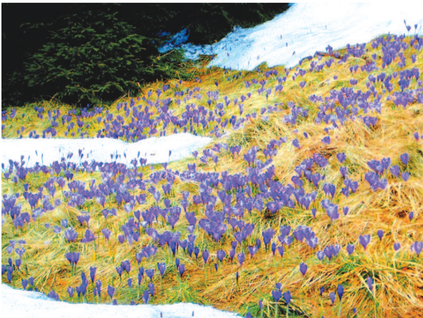
Lilás ibolyaszínű virágmező a Madarasi-Hargitán