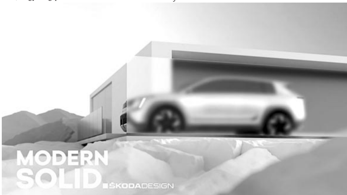
A Skoda új designja

Duncan Aldred, a GMC alelnöke azt mondja, hogy mostanra valamilyen sikerült felpörgetni a gyártást, de az eddigi 65 ezer megrendelés teljesítése nem kevés időbe telik. Az alelnök az amerikai szaksajtónak azt nyilatkozta, hogy aki ma megrendeli a GMC Hummer elektromos változatát, leghamarabb 2024 közepén kaphatja meg. Persze, ha nem lesz további probléma az alkatrészellátásban.