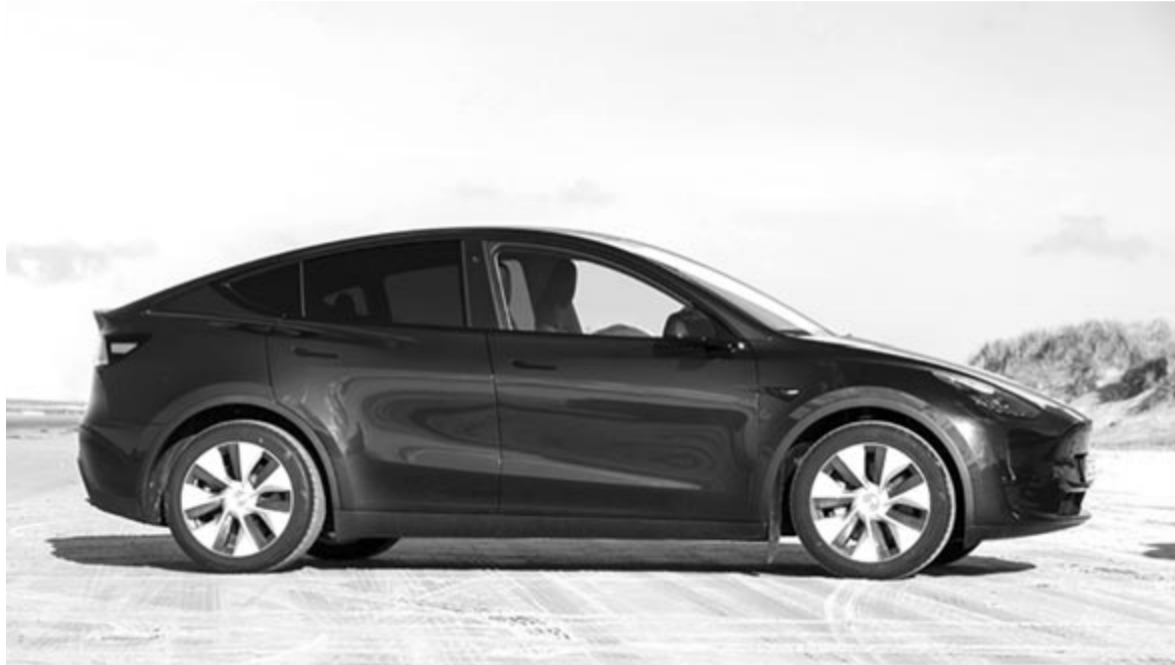
Tesla Model Y