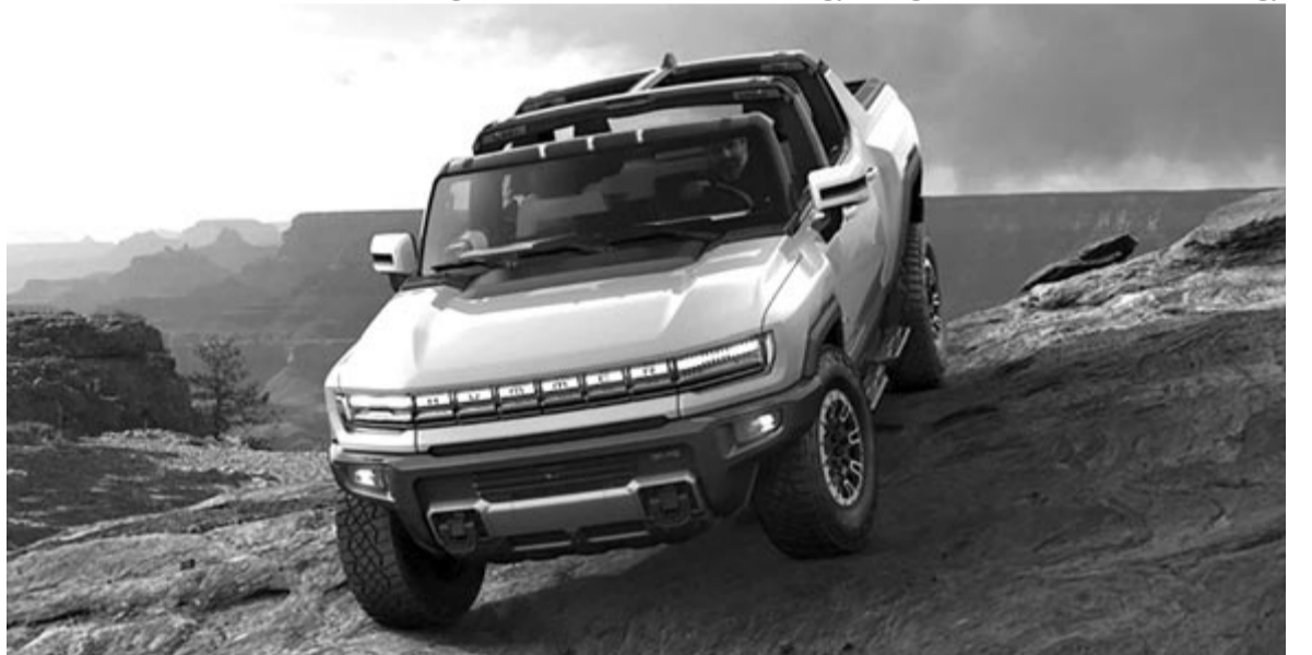
GMC Hummer EV

A factory Zero üzemben azonban elég lassan indul be a termelés. Egy