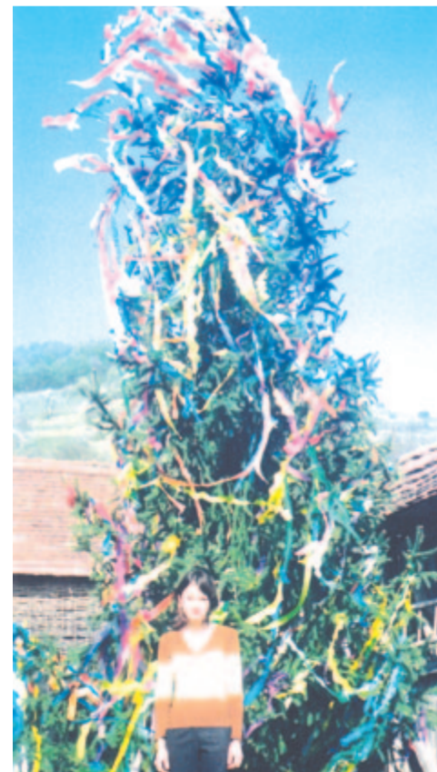
A kedvese udvarára állított, szalagokkal díszített fenyőfa mint szerelmi ajándék (Szentháromság, 2013)

Marosszékot tehát, ahol a húsvéti fenyőág állítása jellemző, a legváltozatosabb formában, május elsejére májusfát állító és pünkösdkor zöldágazó-virágozó régiók veszik körül. A Megváltó feltámadásának ünnepe, húsvét (virágvasárnapot is ide értve) itt, Marosszéken magához vonzotta az újjászületés, az élet ősi egyetemes szimbólumát. Gazdag jelentésvilággal ruháztuk fel, változatos formákban élünk, és napjainkban is élünk vele. Ebben áll a régió egyik húsvétünnepi és néprajzi sajátossága.