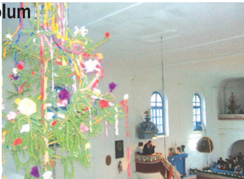
A zöld ág helye a református templomban virágvasárnaptól húsvétig (Kibéd, 2010)

A nyáradmenti falvak húsvéti fenyőágazása igen változatos. Az Alsó-Nyáradmentén – Akosfalva és Nyáradtő között – nagyleányoknak még tesznek szerelmi ajándékként