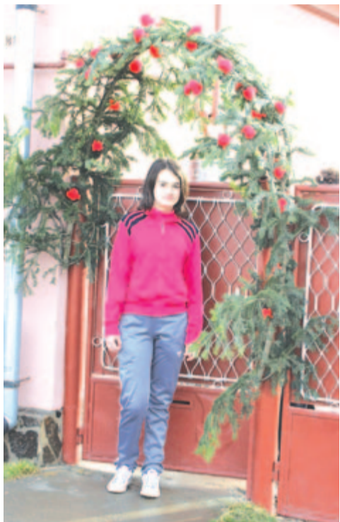
A gergyesszegi nagyleányunk ilyen bolthajtás jár (2013)

Az esztendő ünnepeihez kapcsolódó népszokásokat, azok változatait, elterjedtségüket, gyakoriságukat fel lehet használni egy-egy régió vagy kisebb néprajzi vidék kultúrájának meghatározására. Feltevődik a kérdés, hogy néprajzi vidékünknek, a történelmi Marosszéknél tágabban értelmezett régióknak lehet-e valamilyen sajátossága a tavaszi-húsvéti népszokások egyetemes és összmagyar rendszerében? A válaszom: lehet, sőt „szembetűnően” létezik, az alábbiakban éppen ezt szeretném bizonyítani.