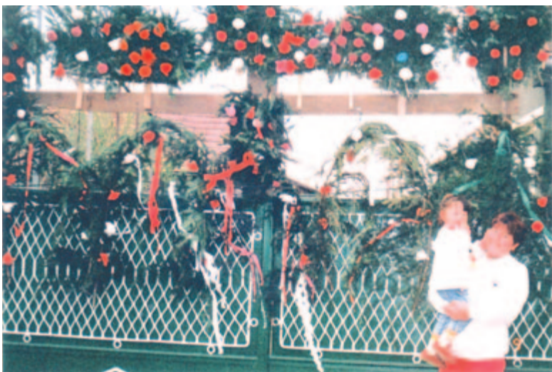
A kislányos családoknak bokrétákból díszkapu (Körtvélyfája, 2000)

Terepmunkánk során már az 1980-as években észrevehető volt, hogy a korcsportváltással új jelentéssel telítődött a gyermekek bokrétája. Ajándék maradt továbbra is, de a legény- és leányéletből lassan kimaradva már nem szerelmi ajándék, inkább a felnőttek közösségi ünnepi ajándéka gyermekeknek, gyermekeiknek. Ahogyan ők fogalmaztak: „kölcson a gyermekek öröme”. A zöld ág