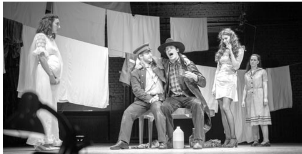
Jelenet a Parasztoperából

– A Parasztoperában még hatványozottabban áll az, amit az előbb mondtam, ott már a halásos bűnök is megjelentek. Az emberi léleknek még nagyobb amplitúdóján játszik. Tulajdonképpen – nézem innen, nézem onnan –, a Parasztopera egy görög tragédia. Hiába mondják, hogy Camus-tól jön, meg mit tudom én. Nem ez a fontos belőle, hanem az, hogy elköveltünk egy huszonöt éves bünt, amiről huszonöt év után már azt hisszük, hogy megúsztuk, és tulajdonképpen törvénytelenesen meg is lehet úszni, de lelkileg nem lehet megúszni egy ilyen dolgot. Pláne azzal a csavarral, ami a Parasztoperában van. Pintérnek ez annyira szép története, hogy amikor először láttam, már akkor belezúgtam. Annak is van vagy – talán jövőre lesz – húsz éve. Akkor mondtam neki, hogy meg fogom rendezni. Nem fenyegetésnek szántam, hanem addig kutya nem játszott Pintért, nagyon érdekes módon senki nem játszotta. Borzalmasan büszke vagyok arra, hogy nekem sikerült a Pintér Béla írói munkásságát elindítani úgy, hogy idegen társulatok is játsszák, és ne csak a Pintér saját társulata. Rá is azt mondták, amit ránk szoktak mondani, az Iso-Marci-én