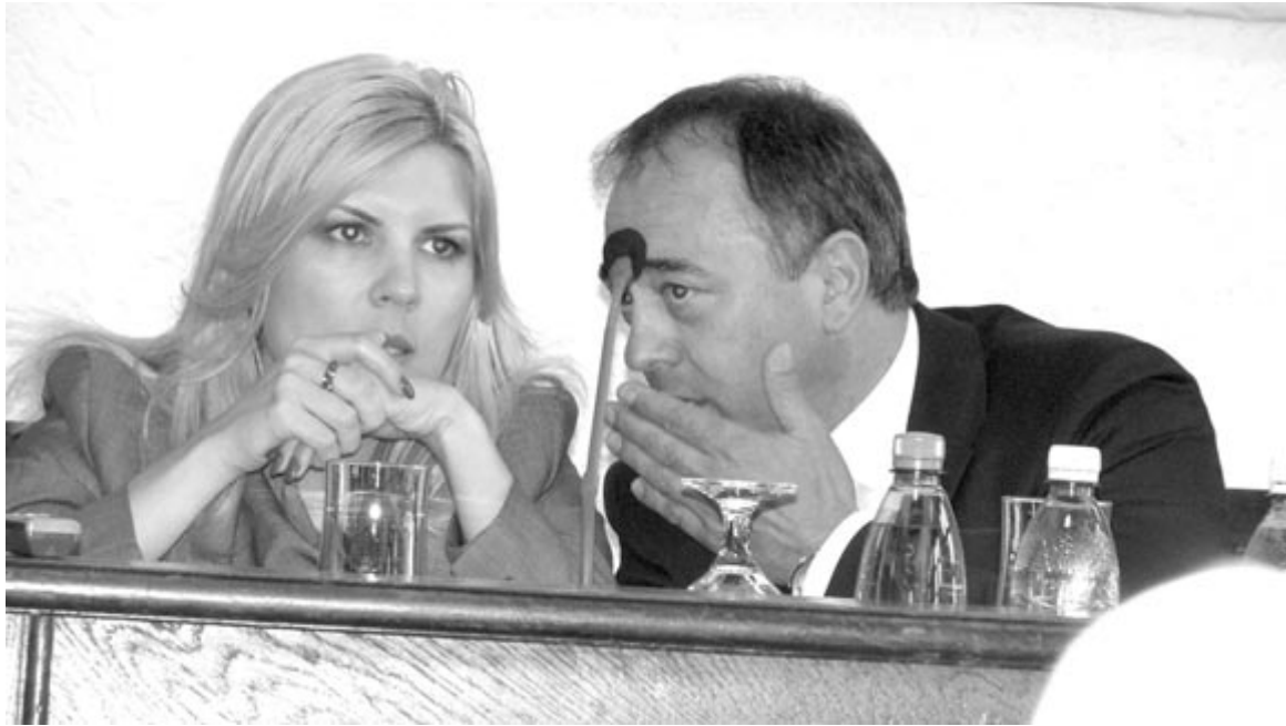
Elena Udrea 2011-ben Marosvásárhelyen tárgyalt Dorin Florea akkori polgármesterrel