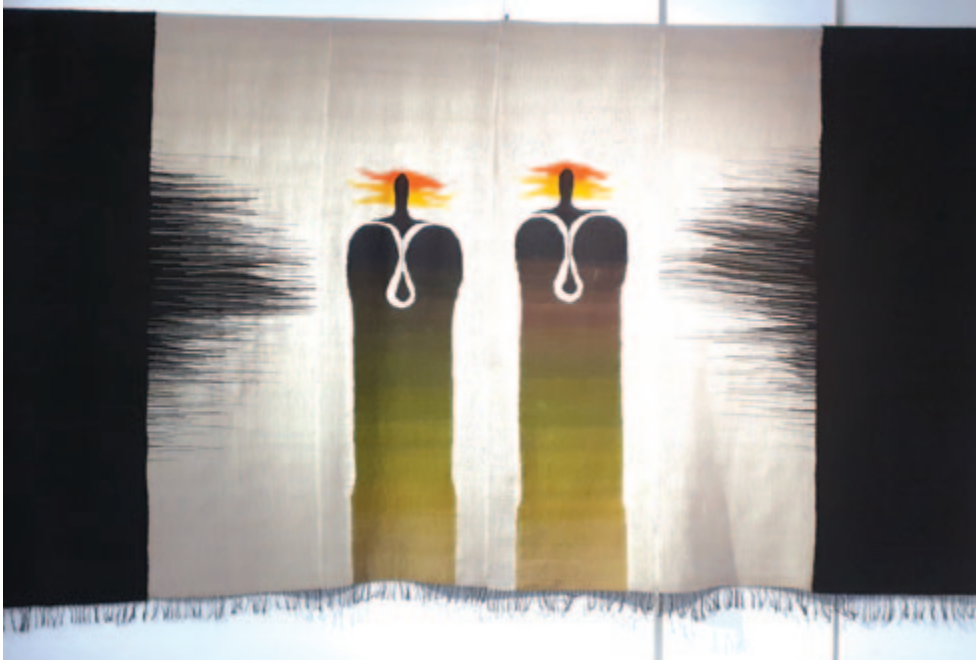
Tamás Anna: Bohócok, 1975

Sajnos nem személyesen, hiszen már több mint egy évtizede, 65 éves korában elhunyt Amerikában, és nem szülővárosában, Marosvásárhelyen, de monumentális kárpítjai által szülőföldjén, az Erdélyi Művészeti Központ sepsiszentgyörgyi székhelyén találkozhat vele ismét honi közönsége. Élhetne még, alkothatna is, hiszen egykori művészeti középiskolás osztálytársai, az alkotói megújulást ösztönző nemzedéktársai közül többen ma is kulturális életünk meghatározó, aktív résztvevői, a sors azonban így döntött, Tamás Anna 2010-ben végleg távozott. Textilművészeti, díszlet- és jelmeztervezői, illetve divattervezői munkássága, életműve így is rendkívül jelentős. Az itthoni fiatalabb tárlatlátogatók már nemigen ismerhetik, de az idősebbek közül sokan fel tudják idézni magukban a művész alkotásait, rendkívüli egyéniségét. Jó lenne, ha a