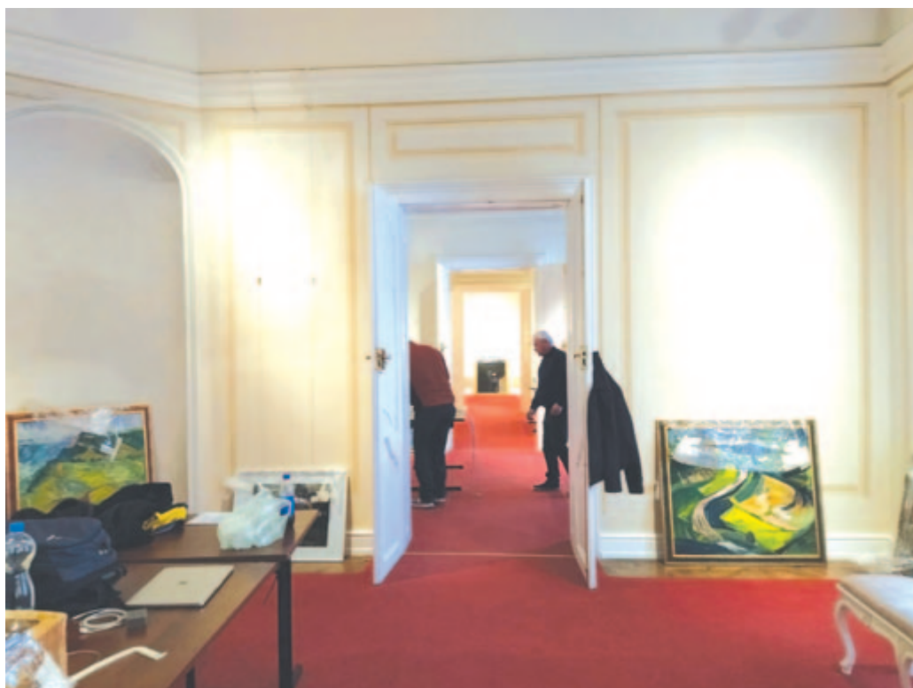
Tárlatrendezés a gödöllői kastélyban

A tervek szerint 2020-ban mutatták volna be a tervezett színvonalas anyagot a gödöllői kastélyban, de a járványhelyzet miatt a tárlat elmaradt. Április 8-tól azonban négy hónapig hetven, a gyergyószárhegyi alkotótáborokban készült tájfestmény lesz látható Gödöllőn.