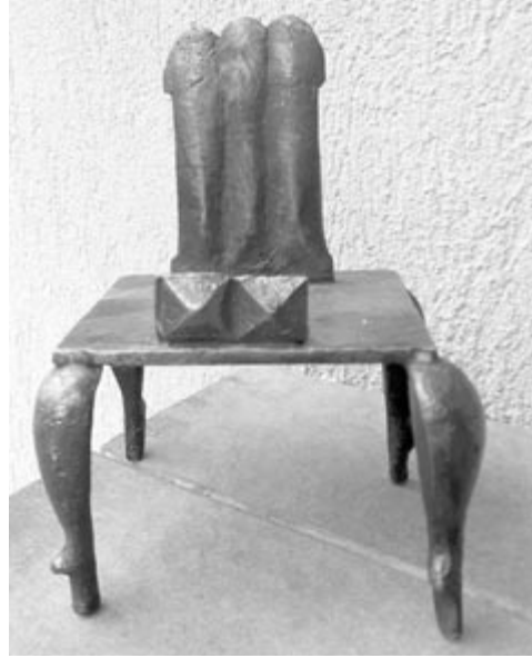
Sánta Csaba kisplasztikája

Valamikor az átkos múltban Bimbus is futballozott. Ő mesélte, mikor még élt, hogy a faluközi bajnokságot úgy nyerték meg, hogy el is veszítették a döntő mérkőzést, s nem is. Vagyis megnyerték, de mégsem. A zándorfalvi csapat mindig találomra állt össze, a magát Depnernek tituláló brigádos játszotta a menedzsert, a kollektív gazdaság traktora