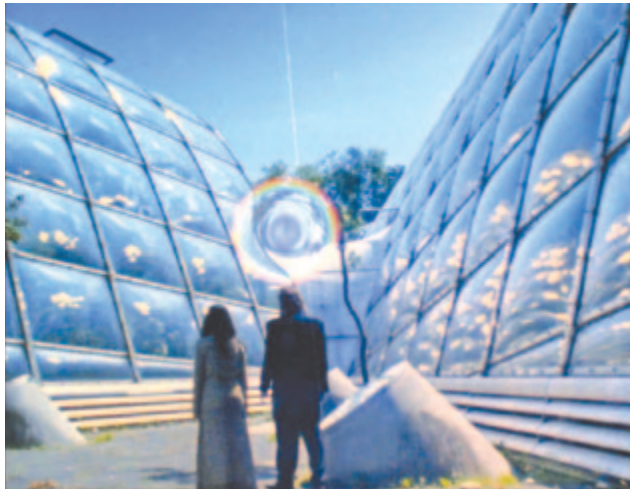
Jelenet a filmből

A 82 perces art-house film, a Melegvizek országa története egyszerre szimbolizálja az egymással ellentétes ideológiák keresztütlében vergődő világunk kilátástalanságát, de egyben egy reményteljesebb jövő felé is mutat, ahol a zöld anarchizmus által az emberiség szebb jövő elé nézhet. A Buharovok, akik ezúttal az emberen túli világ hírnökeivé válnak, ösztönös világukat egyfajta csendes poézissal vegyítve vezetik el a nézőt a Meleg Vizek Országába és a történetmesélés új dimenziói felé. A film szinopszisa azzal a kérdéssel indít, hogy