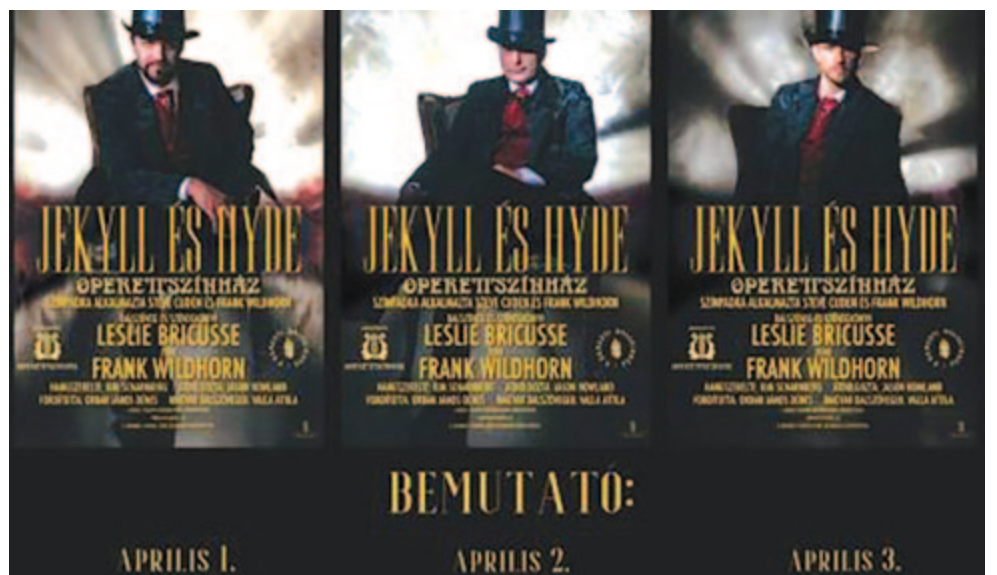
A musical plakátja