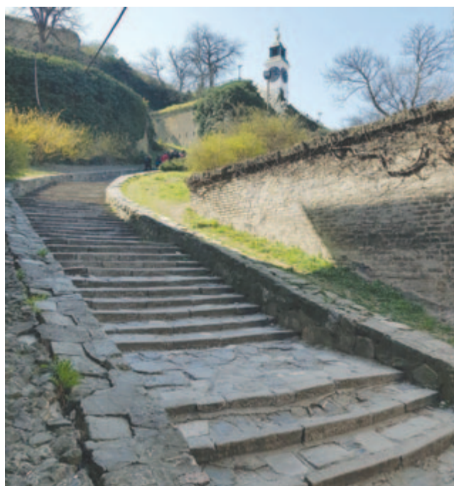
Több mint kétszáz lépcsőfok vezet a várba