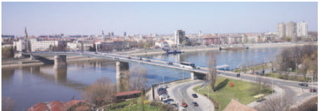
Városkép az erődítményből