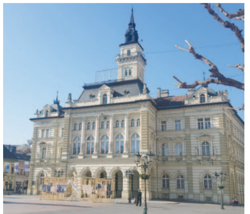
A városháza