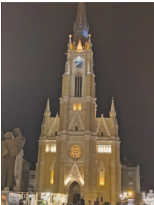
A Mária neve templom esti fényei