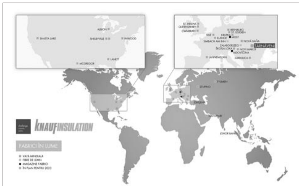
Knauf Insulation gyárak világszerte

A Romániában már 2008 óta jelen levő Knauf Insulation cég a dicsőszentmártoni gyárban az üvegyapot gyártását a cégcsoport szabványaihoz igazítja az innovatív ECOSE® technológiát alkalmazó műszaki megoldások, energiahatékonyság, az értékek, etikai és szociális standardok, valamint a munkavállalók számára biztonságos és jó munkafeltételek bevezetésével.