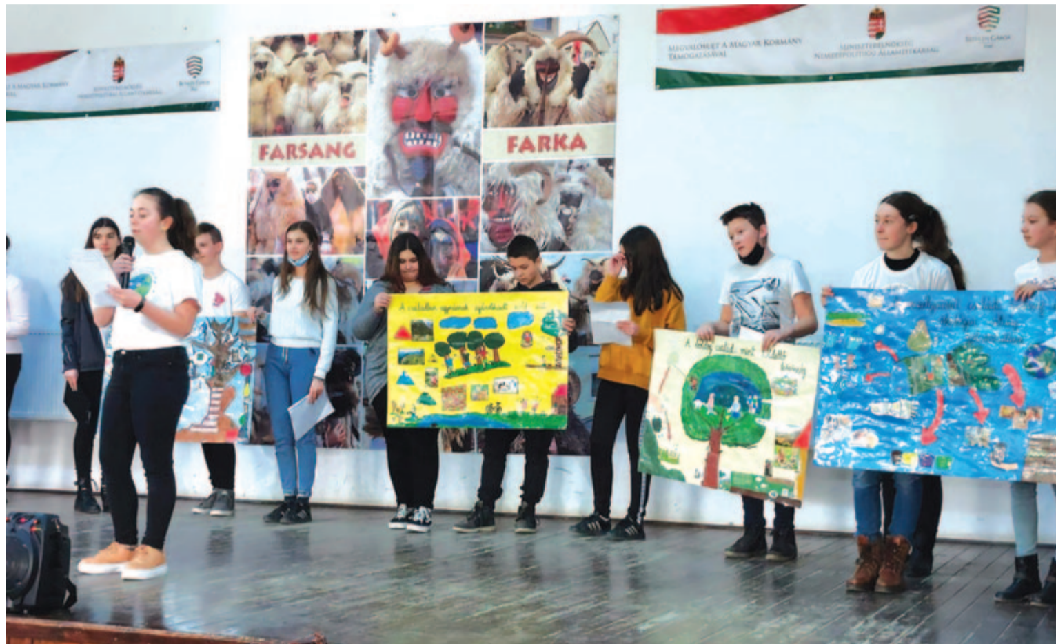
A búzásbesenyői diákok is több helyen mutatták be munkájukat