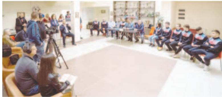
Bemutatták az idén kiemelkedő eredményeket elért sportolókat

– Ha már a kosárlabdánál tartunk, hogy állunk a csapatsportok terén? Hány alakulatot tud magas szinten fenntartani a város? Hisz pillanatnyilag ebben a tekintetben nagyon rosszul állunk.