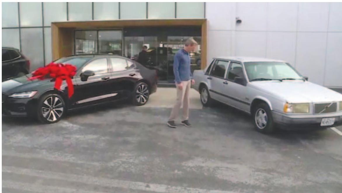
Az új és a régi Volvo