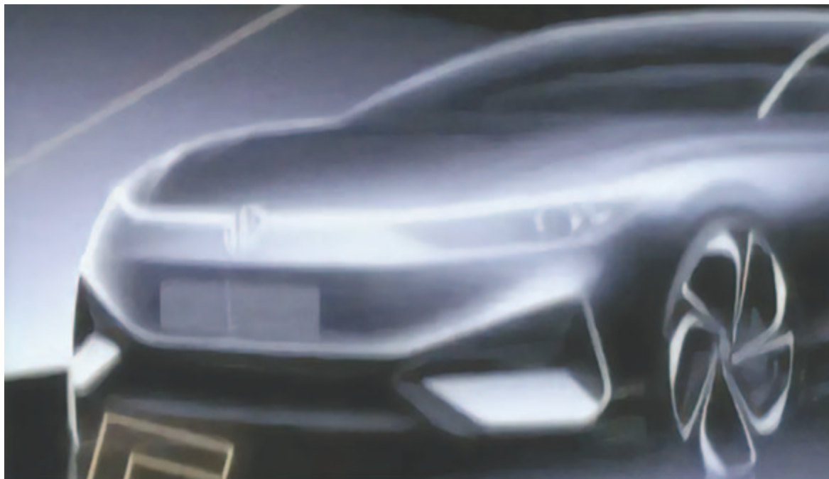
Volkswagen Aero B

Kémfotókon már ősszel is látható volt a szabvány MEB platformra épülő, azaz eleve elektromosnak is tervezett Volkswagen. Most azonban felkerült a világhálóra az első igazi – meglehetősen rossz minőségű – gyári fotó is az autóról. Egyelőre mindössze annyit lehet tudni, hogy egy ötajtós és egy rövid