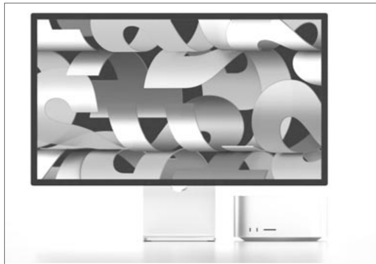
Mac Studio és Studio Display

Sokkal érdekesebb, hogy az Apple egyre inkább elkötelezi magát a környezetvédelem mellett.