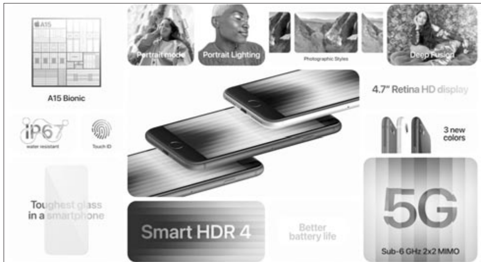
iPhone SE 2022

Ami még örömhír lehet, hogy az iPhone SE 2022 megkapta az IP67-es vízállósági tanúsítványt. Ez azt jelenti, hogy 30 percen keresztül egy méter mélységbe lemerülhe-