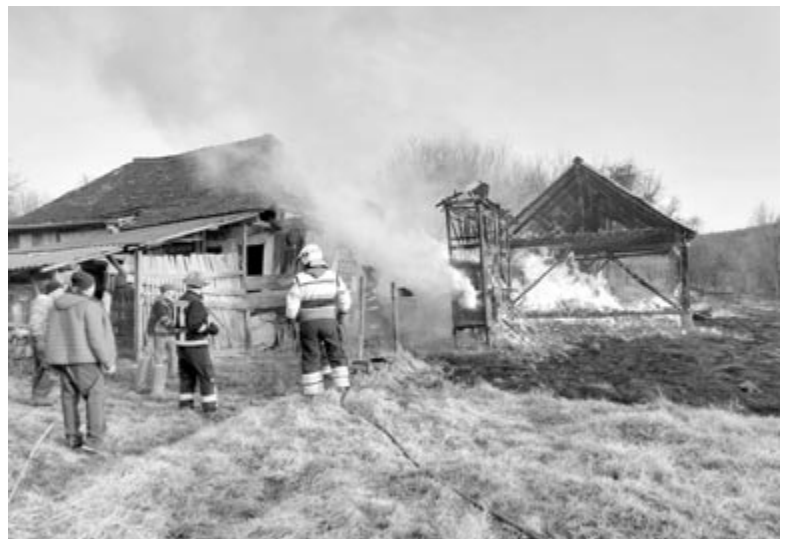
Vadadban és Nyáradmagyaroson gazdasági épületek váltak a tűz martalékává

Az elmúlt héten – a megyei katasztrófavédelmi felügyelőség adatai szerint – 67 tüzeset volt, amely a száraz növényzet felgyújtása következtében keletkezett, ebből 41 a hétvégén (péntek–vasárnap). Hasonló okokból volt múlt kedden Havadtón is jelentős anyagi károkkal