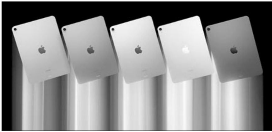
iPad Air, ötödik generáció

Persze ez sem olcsó, a Studio Display indulóára 7000 lej környékén van, kiegészítők nélkül. Ha a legjobbat szeretnénk a Mac Studio-ból és a Studio Display-ből, összesen körülbelül 53.000 lejt kell fizessünk. A Mac Pro és a Pro Display XDR legjobb változatai összesen meghaladják a 60.000 dollárt.