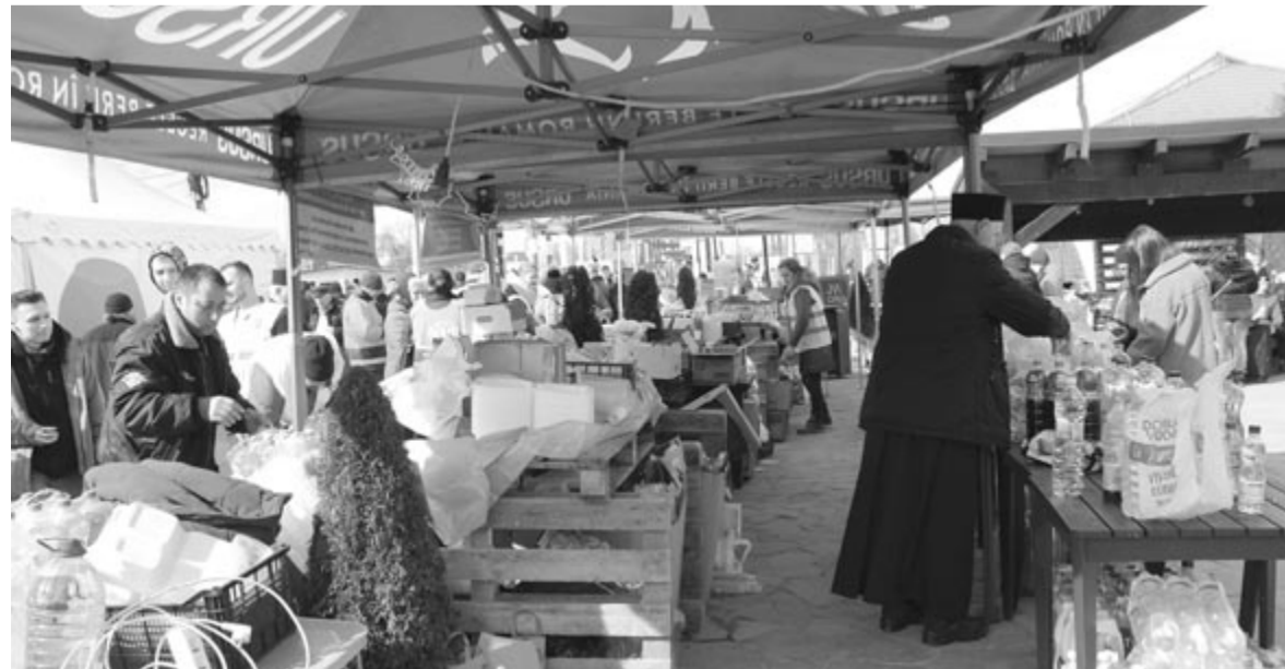
Az önkéntesek által felajánlott élelmiszerhalmaz