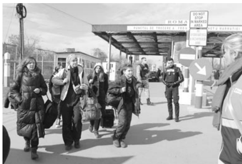
Münchenbe tartó család

Közben elvonja a figyelmünket egy csoport fekete bőrű menekült. Az egyik hölgy széles mosollyal, a győzelem jelével üdvözlő bennün-