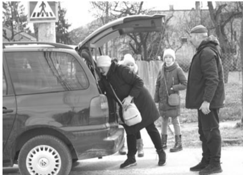
Önkéntes autóvezetők segítenek a szállításban

Közben egy nagyobb csoport jön át gyalog a határon. Két középkorú nő és négy gyerek. Jólöltözöttek, az egyik anyukán sínadrág, hátizsák, a gyerekeken kis hátizsák, sportcipő. A polgármesteri hivatal munkatársa és a máltaiak önkéntesei fogadják őket. Colopelnic atya segítségével megpróbálom kommunikálni velük, mivel csak az egyik fiú beszélt egy kicsit angolul. Megtudom, hogy február 24-én, a háború kitörésekor hagyták el Kijevet. A gyerekeket előreküldték rokonaikhoz Kolomeába, arra gondolva, hogy néhány nap múlva csendesedik a helyzet, és visszatérhetnek otthonaikba. Aztán amikor belátták, hogy nem javul a helyzet, férjük elhozta őket a határig, majd a férfiak visszamentek. A két nő testvér, mindketten gyere-