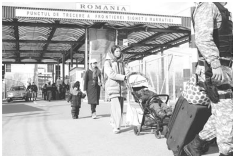
Román határőri segédlettel lépnek be a kisgyerekes anyukák az országba

Közben beérünk a fogadózónába. Az utca egyik felén hosszú sátor áll, amolyan irodaként, ahol a hatóságok fogadják az ide érkezőket. A másik felén, egy kávézó és bár egy méteres kőfállal bekerített teraszhelyiségének oldalán több sátoresztől alatt önkéntesek állnak sorban természetesen melegségű élelem, üdítő,