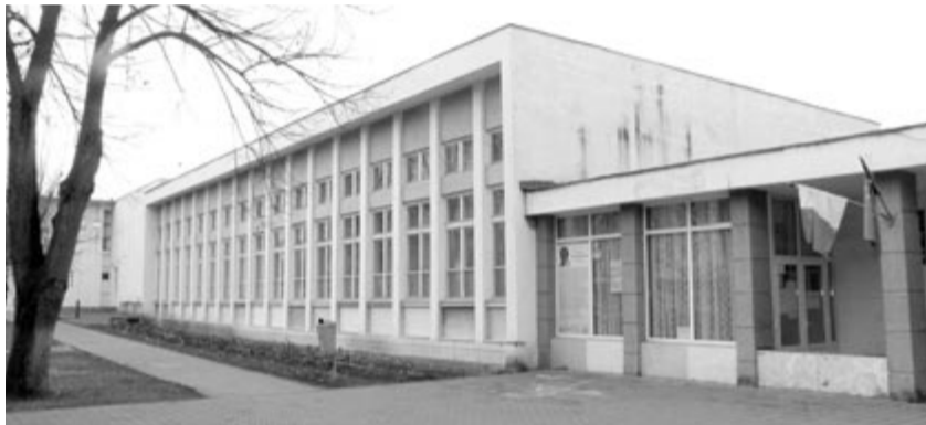
A ludasi művelődési ház

Marosludas két pályázatot nyújtott be a Saligny program keretében, mindkettő az úthálózat javítását szolgálja. – Egyik a város régi főtére körüli utcákra vonatkozik, azokra, amelyeken még nincs aszfaltburkolat. A temetők felé vezető 300 méteres utca nagyon rossz állapotban van, ezt is befoglaltuk a tervbe, melynek értéke 22 millió lej.