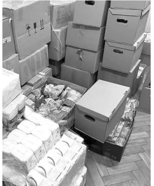
Több helyen gyűl az adomány a menekülőkhöz és a menekülőket ellátók számára.

Az ukrainai rászorulóknak számára a jobbágyfalvi üzletben is fogadják az adományokat csütörtökig, itt főleg tartós élelmiszert, édességet, vizet, takarót, hálósákat, elemlempát, pelenkát fogadnak, gyógyszert és gyümölcsöt nem vesznek át. (GRL)