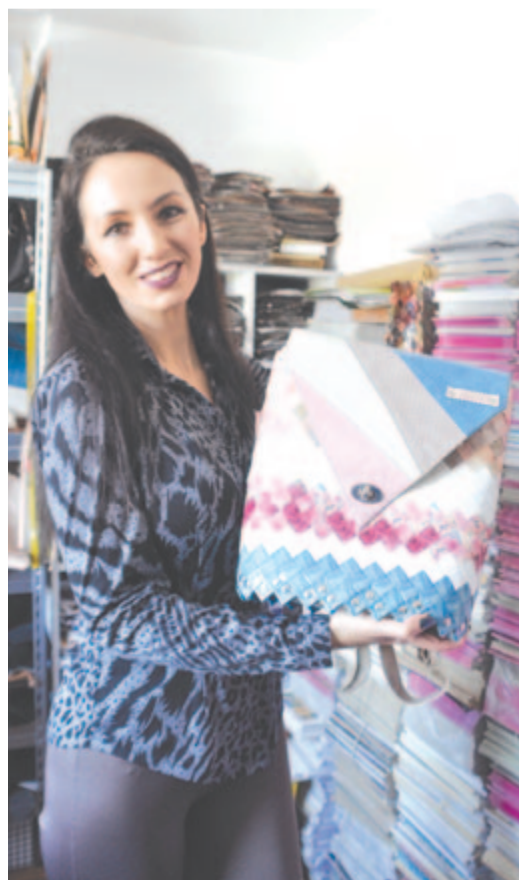
Háttérben az alapanyag és a késztermék