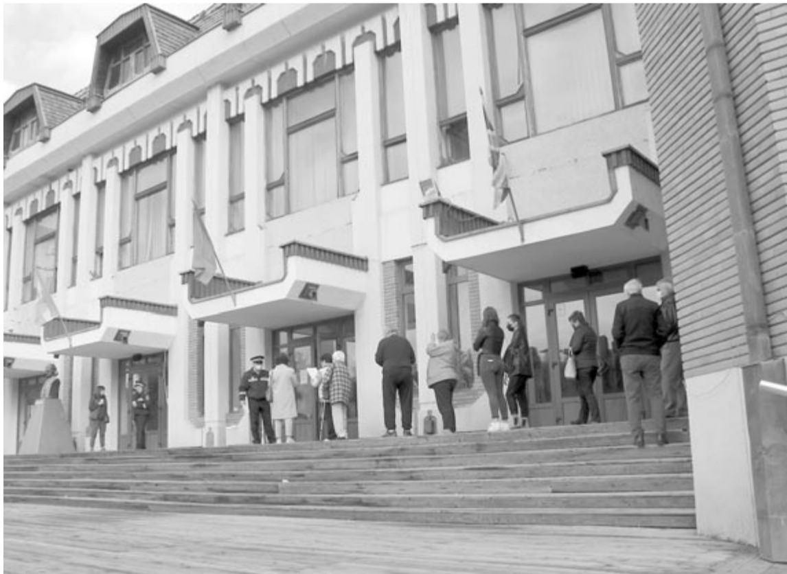
A Mihai Eminescu Házban kialakított oltóközpont

A prefektúra által közzétett jegyzék szerint február közepétől a vidéki oltóközpontok többségében is módosult a program, Nyárádszeredában hétfőn, szerdán és pénteken 8–14 óra között, Marossszentgyörgyön hétfőn, kedden, csütörtökön, szombaton 14 és 20 óra között, Marossszentkirályon kedden, szerdán, pénteken és szombaton 8–14 óra között, Erdőszentgyörgyön hétfőn, szerdán és szombaton 8–14 óra között, Szovátnán hétfőn és szombaton 8–14 óra között, Szászrégenben hétfőn, kedden, csütörtökön és szombaton 14–20 óra között, Segesváron hétfőtől csütörtökig 14–20 óra között, Nyárádtőn hétfőn, szerdán, csütörtökön és pénteken 14–20 óra között, Dicsőszentmártonban hétfőn, kedden, csütörtökön és pénteken 9–15 óra között, Marosludason hétfőn, szerdán, csütörtökön és pénteken 9–15 óra között, Radnóton hétfőn, szerdán, pénteken és szombaton 8–14 óra között, Nagysármáson kedden és szombaton 8–14 óra között, Görgényzentimrén kedden, csütörtökön és szombaton 8–14 óra között, Dédán kedden, szerdán és szombaton 8–14 óra között lehet oltásra jelentkezni.