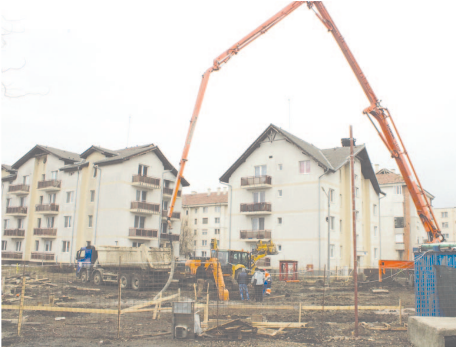
A marosludasi bíróság