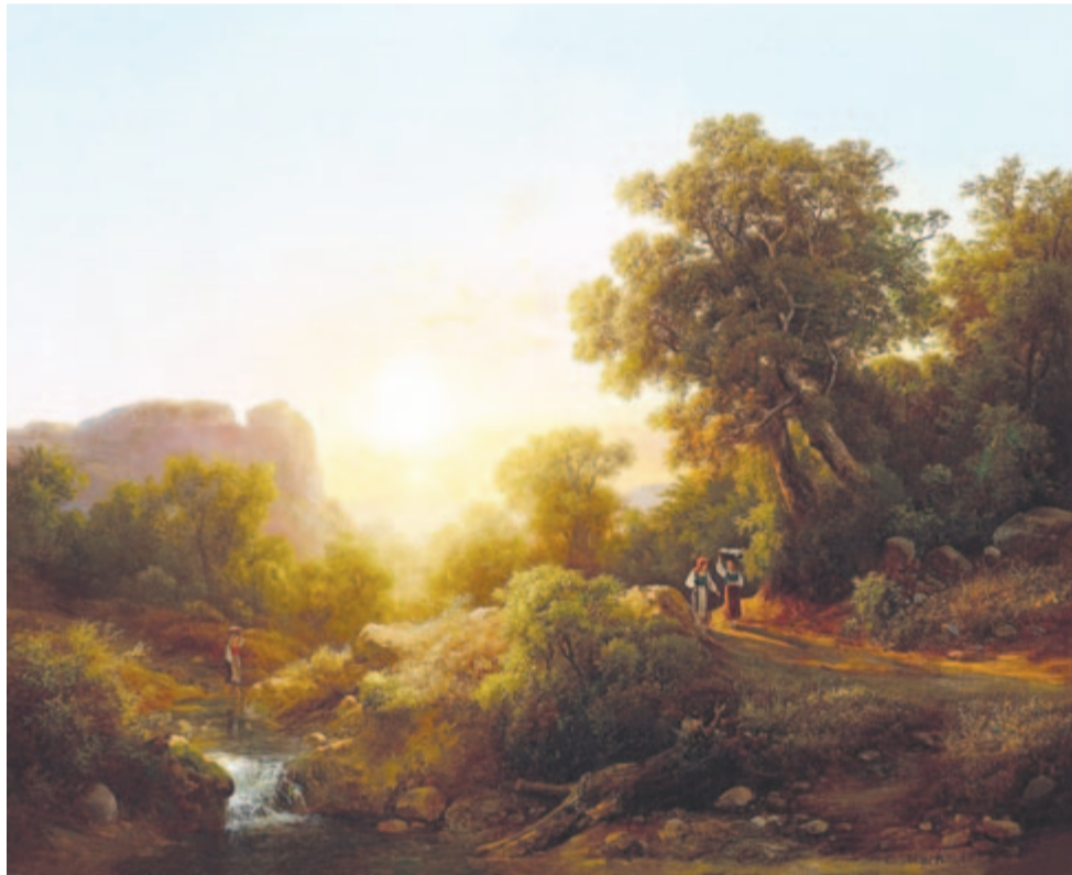
Ifj. Markó Károly: Olasz táj (1873)

Jegyek és bérletek személyesen kizárólag a Marosvásárhelyi Nemzeti Színház nagytermi jegypénztárában válthatók (nyitvatartás hétfőtől péntekig 9:00-18:00 óra között, tel. 0365-806.865), a helyszínen előadás előtt egy órával, valamint online a https://teatronational.biletmaster.ro/?lang=hun honlapon. Az előadásokra érvényesek a tavalyi évad szabadbérletei, előzetes helyfoglalással. (Knb.)