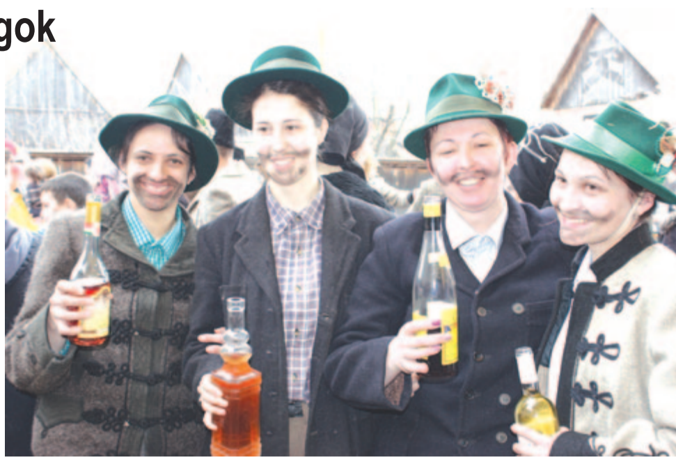
Amikor lányok a katonalegények (Alsósófalva, 2017)

A fonószínház vidékünkön kedvelt előadásait tematikus rendbe sorolva, kezdetben az állatmaszkos játékokkal (kecske, ló, medve, bika, gólya), folytatva a mitikus alakokkal (halál, ördög, bábuk), az életfordulókkal (lakodalmas és halottas játékok), a mesterségeket, embertípusokat megjelenítő játékokkal (betyárok, cigányok, kovácsok, orvos, borbély stb.), de jelenünkhöz közeledve egyre sűrűbben színre léptek a korabeli aktualitások alakjai is. A farsang végi utcaszínház jellegzetes szokásjátékai régiókban a szimbolikus lakodalom (a sámsondi fehér farsáng , a kölpényi szép farsáng , a kibédi farsáng ), a komikus-parodisztikus lakodalom (Beresztelke, Szászvádas-Pipe), a vénlegény- és vénleánycsúfolás ( csutakhúzás a Nyáradmente falvaiban), a farsang temetése (Görgényüvegcsúr, Sóvidék, Küküllő vidéke), a farsang és a bójt, Konc király és Cibere vajda küzdelme (szórványosan a teljes régióban). A hagyományos fonószínházi játékok közül lassanként kimaradtak az állatmaszkos és a mitikus alakok, a farsang végi utcaszínház lakodalmas és temetési játéka megőrizték népszerűségüket. A farsangi kultúrában egyszerre temetnek, üzik