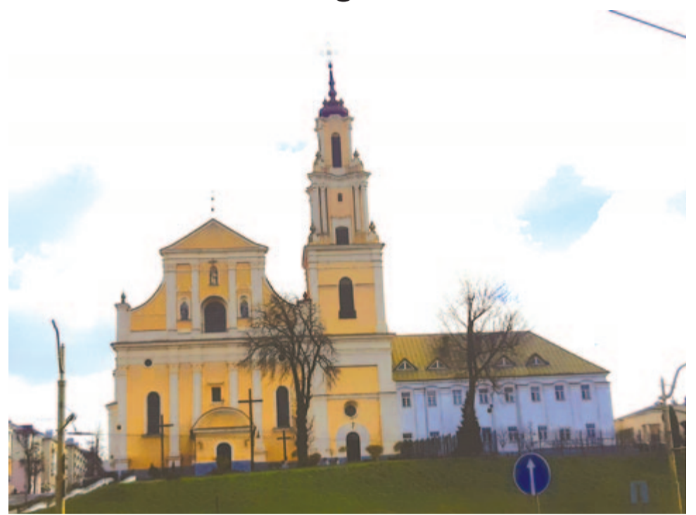
A papnevelde előtti bencés templom

A grodnói papnövédek közül akadt egy, akivel sikerült elbeszélgetnem angolul. A kapusnál a lengyel–magyar barátságra hivatkoztam ugyan, de az még nem bizonyult elegendőnek ahhoz, hogy megértsük egymást. Ezért az egyik hallgatóhoz közvetített,