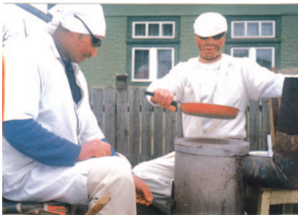
Utcai palacsintasütés Beresztelkén...

Változtak az idők a farsangi játékokban, de