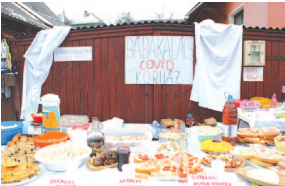
A farsangtemetés egyik aktuális helyszíne és asztala (Alsósófalva, 2021)

S ha már itt a járvány, és kell az oltás, bőven volt belőle a 2021-es alsósófalvi farsangtemetés utcai asztalán, úgymint sófalvi, atyhai, siklódi és bukaresti vakcina , a sófalviak közül többféle, és aki mégis elkapta a vírust, befeküdhett a rögtönzött, teljes felszereltségű, utcai Bábakalács Covid Korházba . A farsang szelleme, játékkedve nemcsak a hagyományos szokásokat élte, hanem megteremtí komikus vagy mellbevágó aktuális jeleneteit és alakjait is.