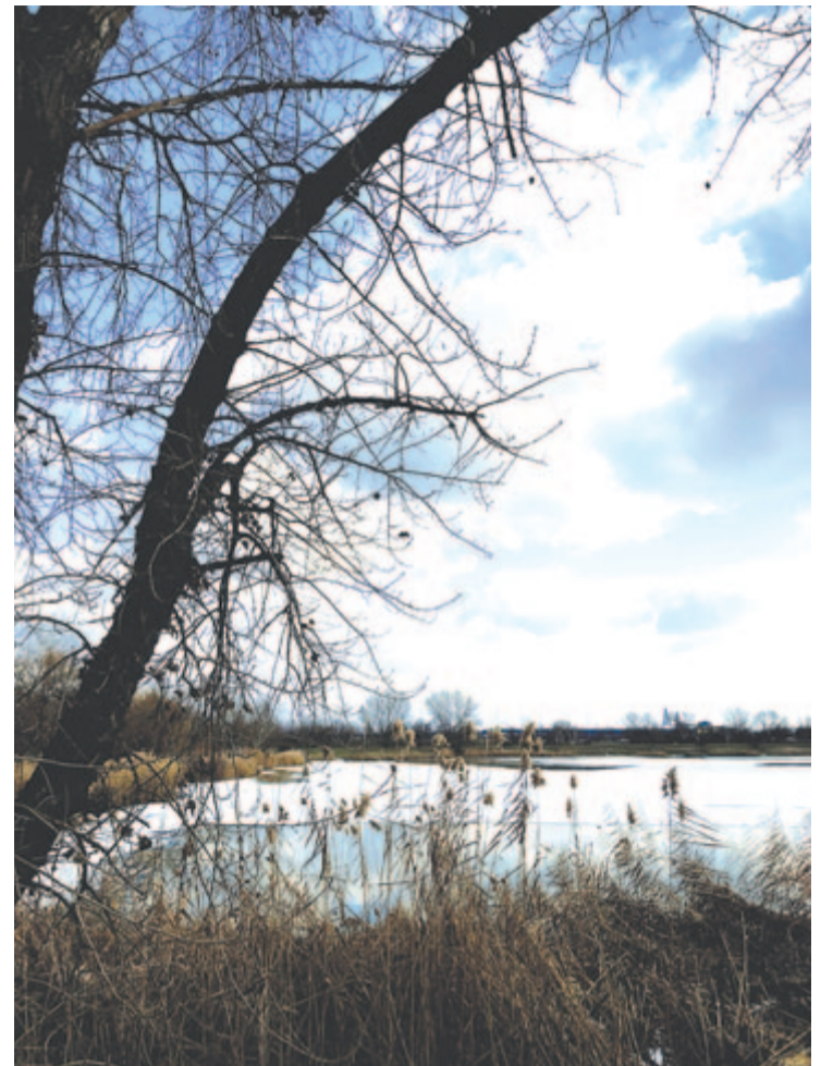
Még beheged éjszakára a tó széle csipkésen

Úgy sajog ez a vad tavasz, mint a letépett ragtapasz helyén a bőr, pedig beforrt a tél sebe: már burjánzik a fény fele