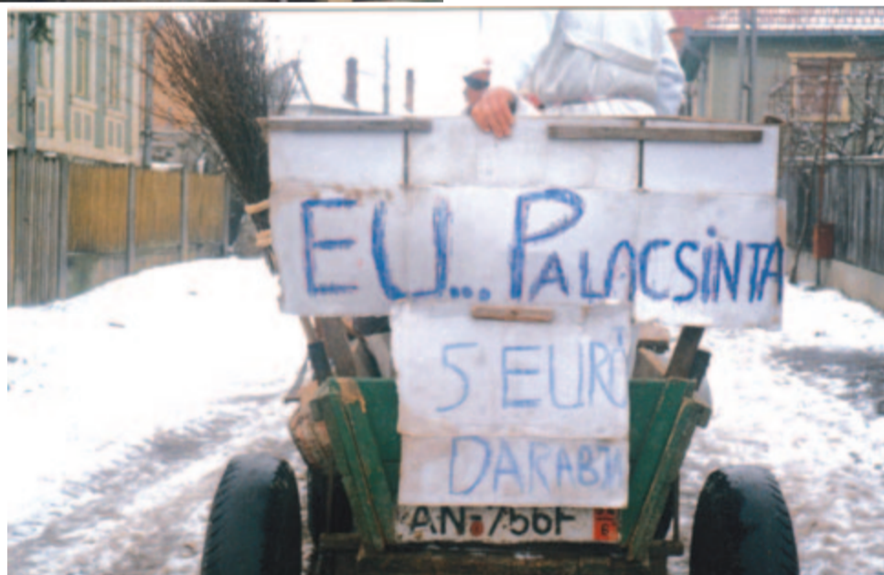
... de az nem is akármilyen: EU-palacsinta (2006)

a telet, és lakodalmaznak, párosodnak az új élet, a tavasz, a megtisztulás örök reményében és óhajával.