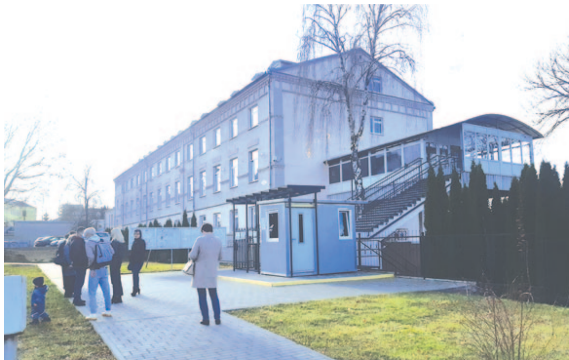
Néhányan a lengyel nagykövetség előtt