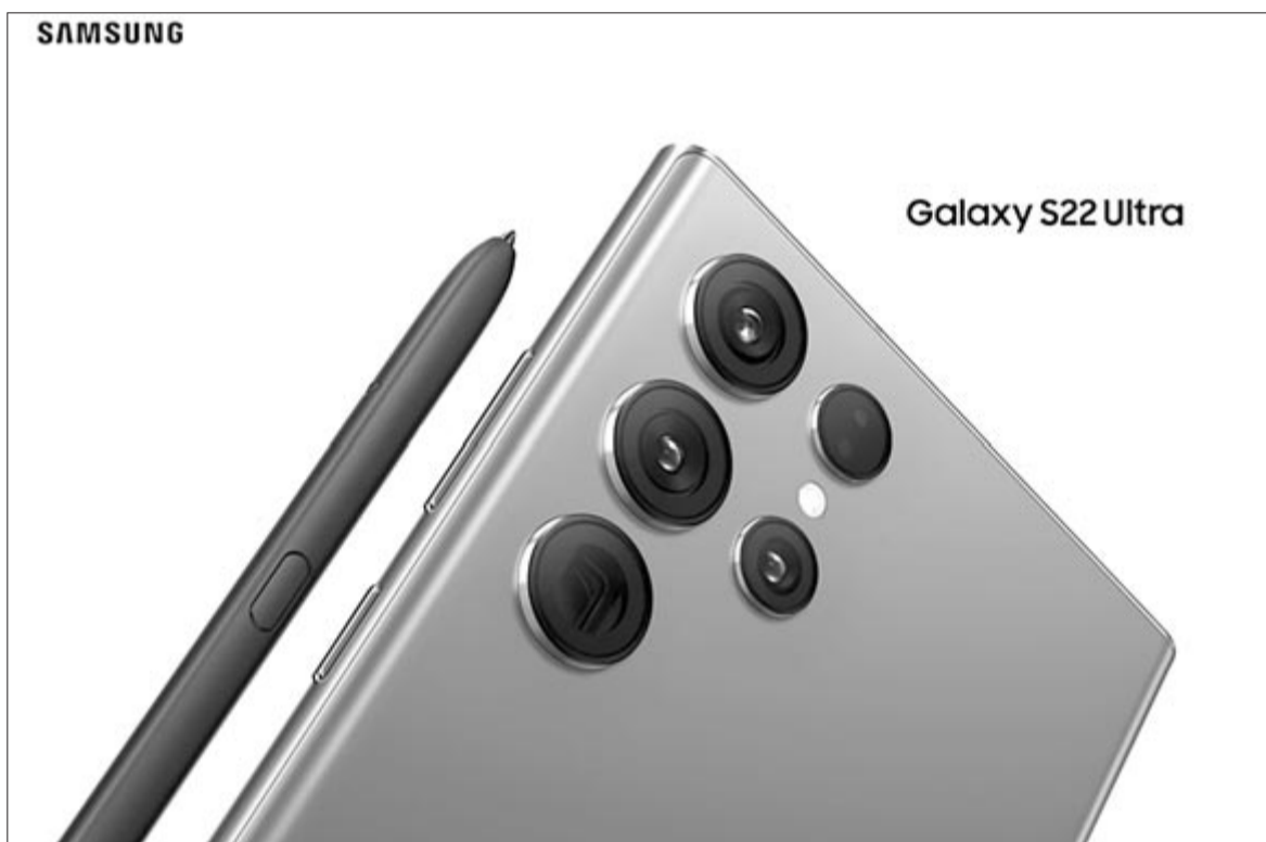
Samsung Galaxy S22 Ultra és S-Pen

A telefon belsejében ugyanaz a processzor, mint a kisebb testvérek esetében, de a memória változott. Az alapmodell szintén 8 GB RAM-os és 128 GB belső tárhelyű, aki nagyobb tárhelyet szeretne, az extra RAM-ot kap. A 256 és 512 GB-os változatok 12 GB RAM-mal érkeznek.