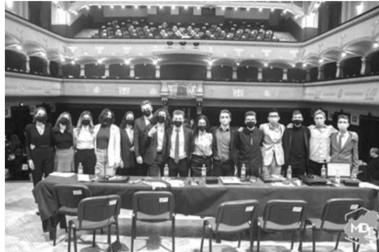
Az MDT kongresszusa, a leköszönő és az új elnökség