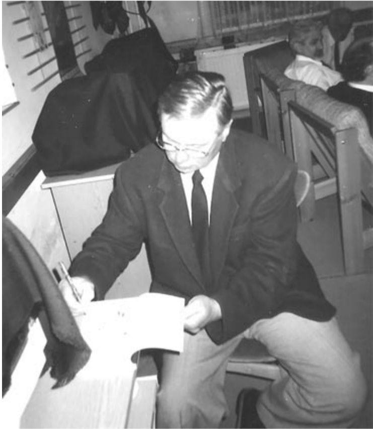
Dedikálás közben 2000-ben

Emlékét sokáig őrzik s őrzikék a fehéregyháziak, segesváriak; a Petőfi és népe örökségét mindenkor felvállaló, a turulmadaras szoborparki emlékhelyhez évente elzárándokoló magyarok.