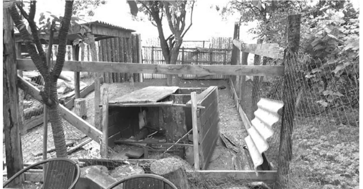
Tavaly számos gazdaságban garázdálkodott a medve

Tavaly gyakran láttak medvét a városban, a nyár folyamán többször bemerészkedett a forgalmasabb utcákra is, gazdaságokba tört be, főleg szárnyasokat pusztított el, de a település határában a háziállatokban is kárt okozott. (GRL)