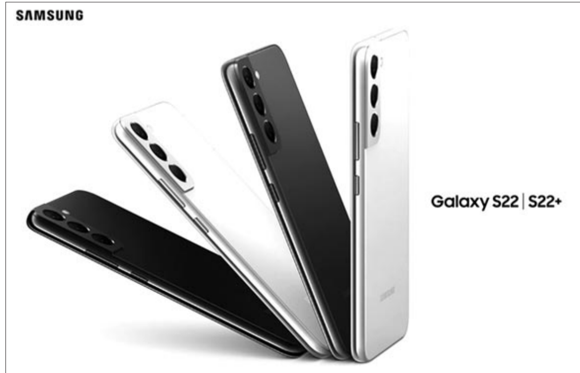
Samsung Galaxy S22/S22+

Most már csak az a kérdés, hogy mennyire fogják kiállni az idő próbáját a Samsung új eszközei? Hamarosan ilyen téren is okosabbak leszünk, illetve az is kiderül, hogy milyen típushibáik vannak, ha vannak.