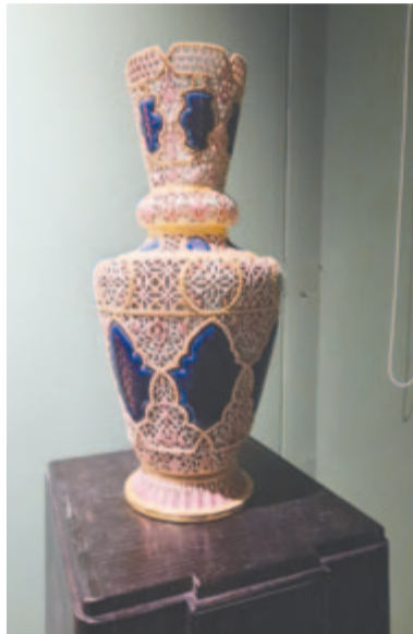
Zsolnay-kerámia a képtárban