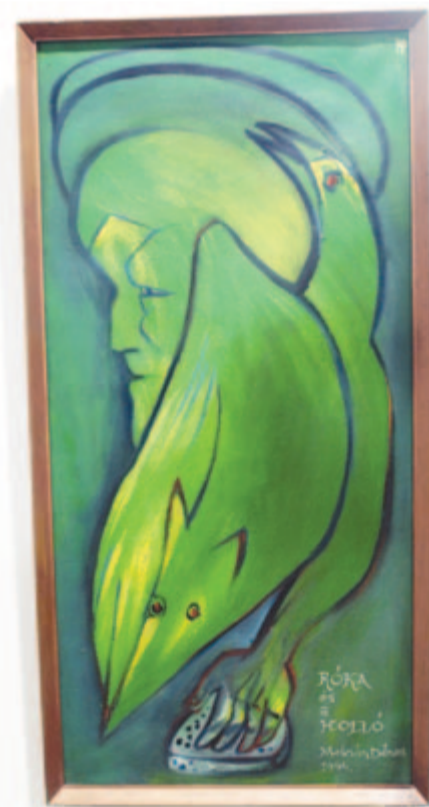
Róka és holló

– Az itt látható munkákon érződik, hogy a művész mosolygott alkotás közben – összegzett az est házigazdája.