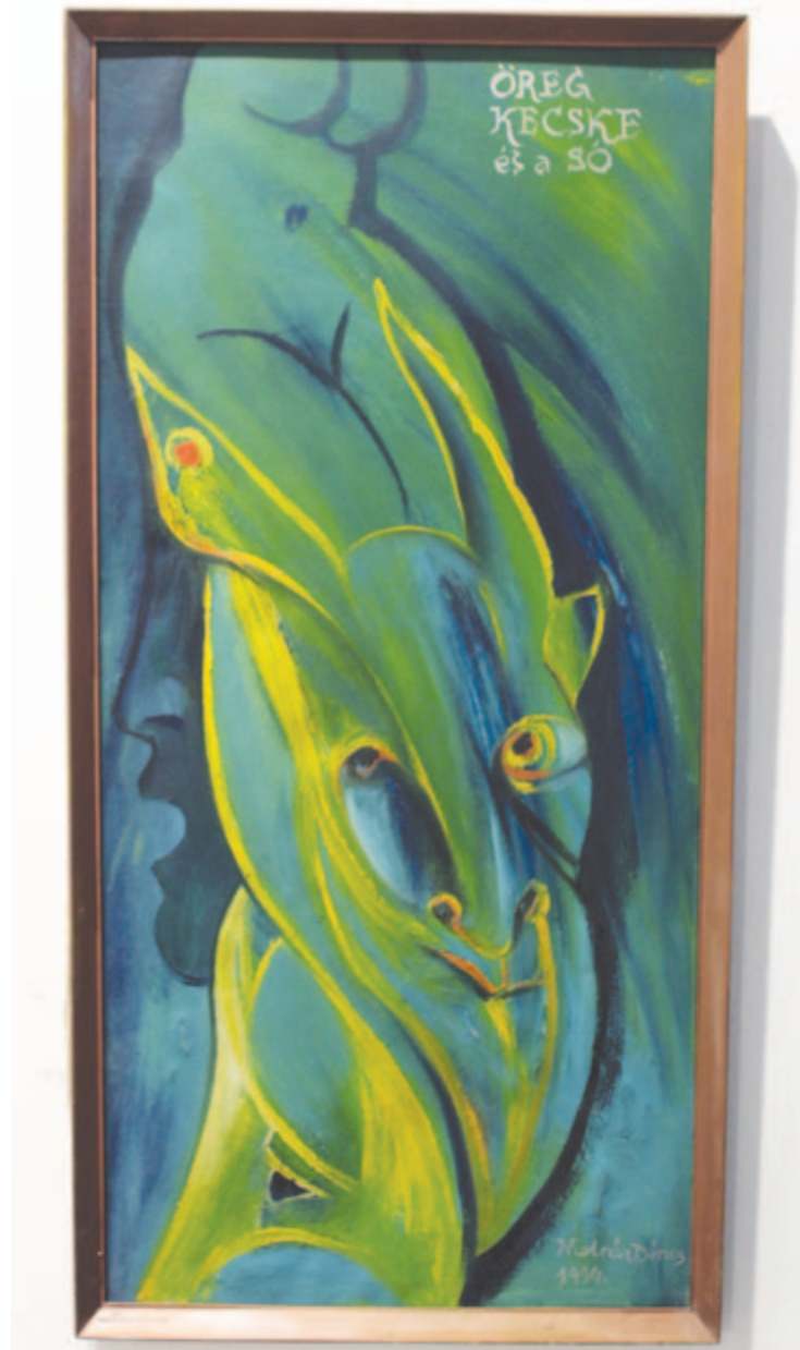
Molnár Dénes: Öreg kecske és a só

Kifelé tartó ismerősének – aki többedmagával volt – jelezte, várjanak egy kicsit, mert hamarosan