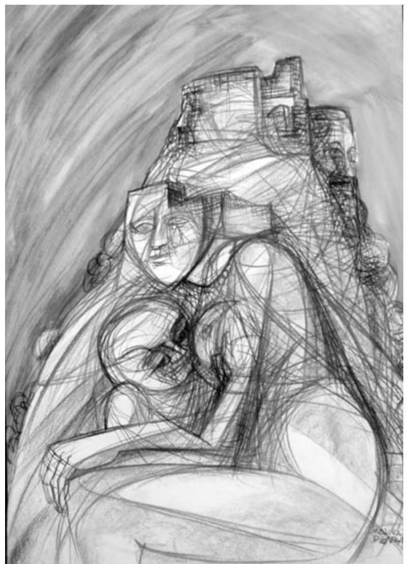
Molnár Dénes: Erős várunk